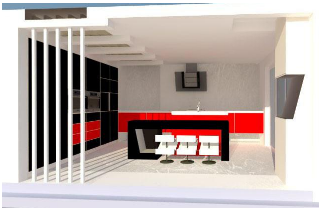
фиг.4. примера на кухня лабаратория (бяла + червен + черен)