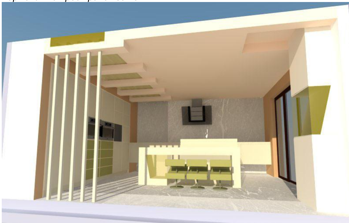
фиг.2. пример на кухня лаборатория (бяла + кафеава + зелена)

Бяла + кафяво + зелено (фиг. 2), бялата и кафеавата го неутрализират пространство, докато с въвеждането на зелената дава свежест, спокойствие и хармония на пространството.