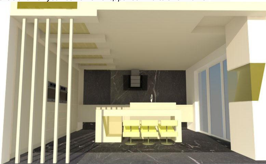
фиг.1. примера на кухня лаборатории (бяла + жълтата + сиво)

Бяла + жълтата + сиво (фиг.1), бяло и жълто прави усещане за топлина, класическа комбинация но с добавяне на малки сегменти от сив се получава модерна линия с чувство на потенцираност на елементите.