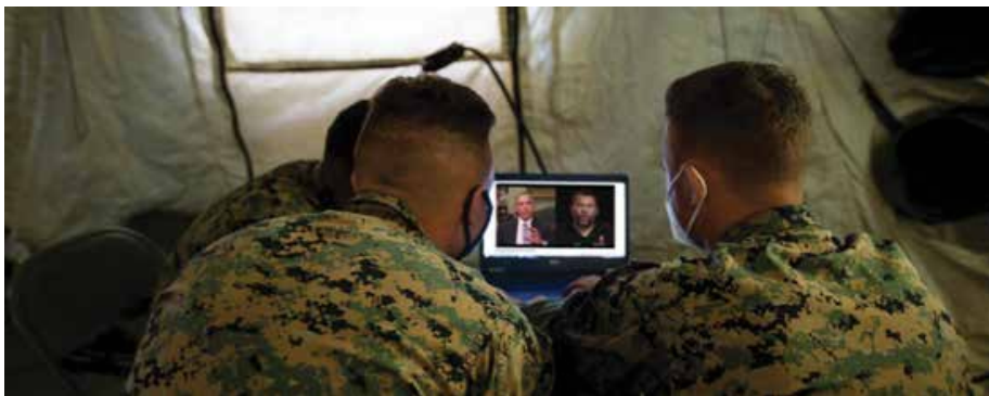
Слика 1. Ризик од „deepfake“ манипулации во далечинските командни комуникации

Сликата прикажува мултислојна безбедносна C2-архитектура, дизајнирана за заштита на командните комуникации од „deepfake“ напади, манипулирани команди и