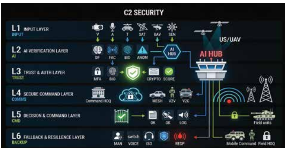
Слика 3. Архитектура на безбеден командно-контролен систем (C2) со AI-базирани верификација

лажни идентитети во современите воени операции.