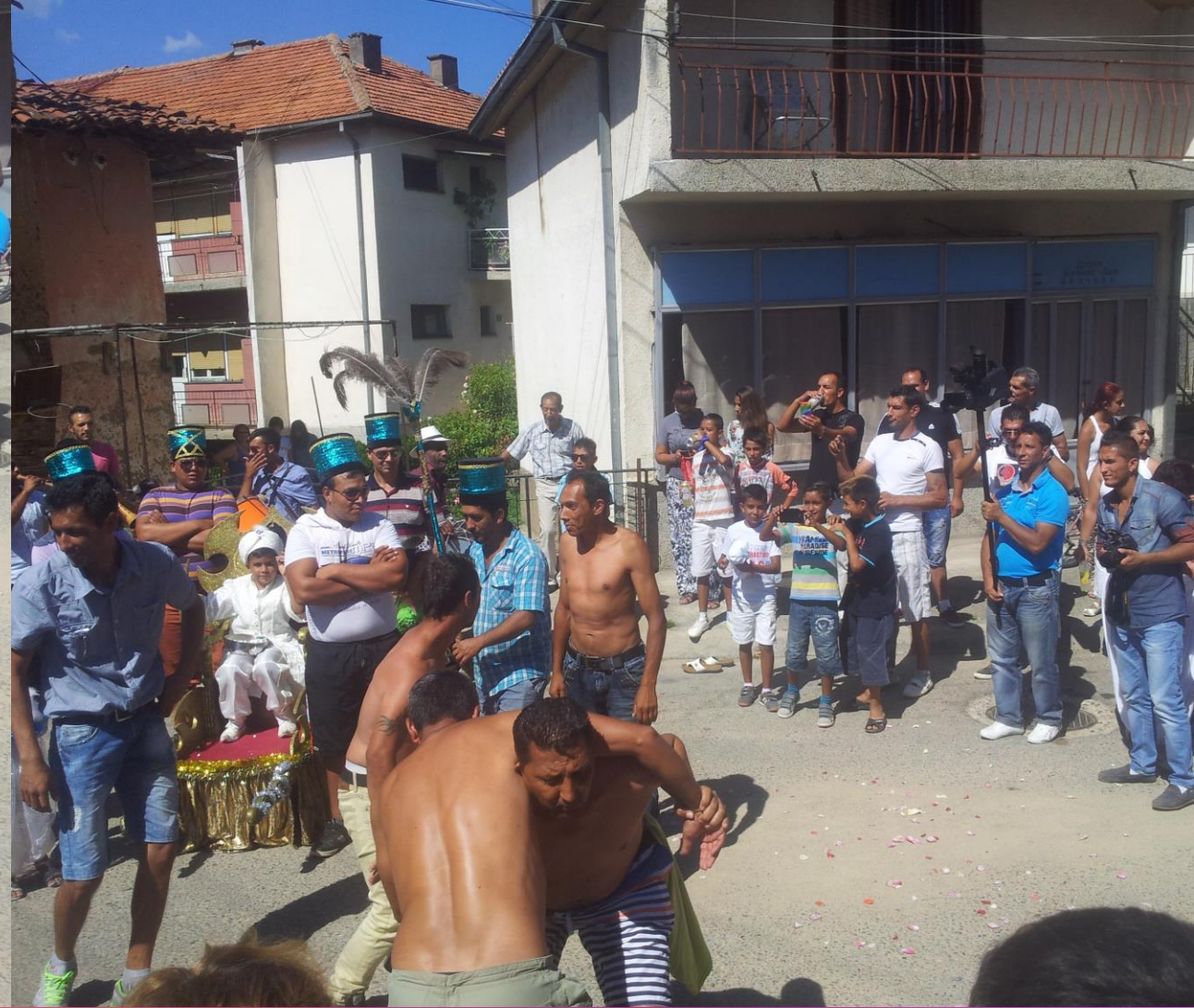
Симболини пеливански борби за време на сунет на ромско дете во Делчево придружени од зурлаџиска музика