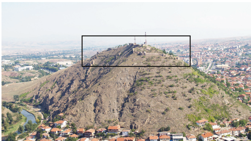
Слика 2. Местоположба на утврдувањето Исар, Штип.