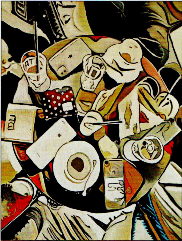
Миливој Симеонов „КОНЕКЦИЈА“ - 2025 г. акрил на њлајно / 70 x 50 cm