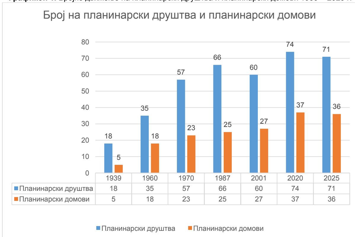
Графикон 1. Бројно движење на планинарски друштва и планинарски домови 1939 – 2025 г.

Извор: (Динчев, Атанасов, 2001; Димитров, 2015; Poljak, 1971; Ribarov, 1971; Панов, 1968; Стојмилов, 1977; Стаменков, 1987; Makedonija – turisticki vodici, 1956; Планинска карта на Република Македонија, 2002; Извештај Податоците за развојот на планинарството во СРМ, 1976; Федерација на планинарски спортови на Македонија, http://www.fpsm.org.mk/ , 2021 и 2025 г.; Dimitrov, 2021).