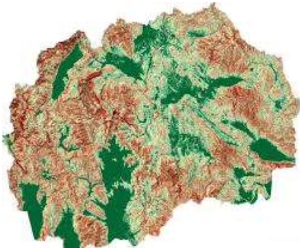
Карта 5. Морфометриски изглед на релјефот во РС Македонија