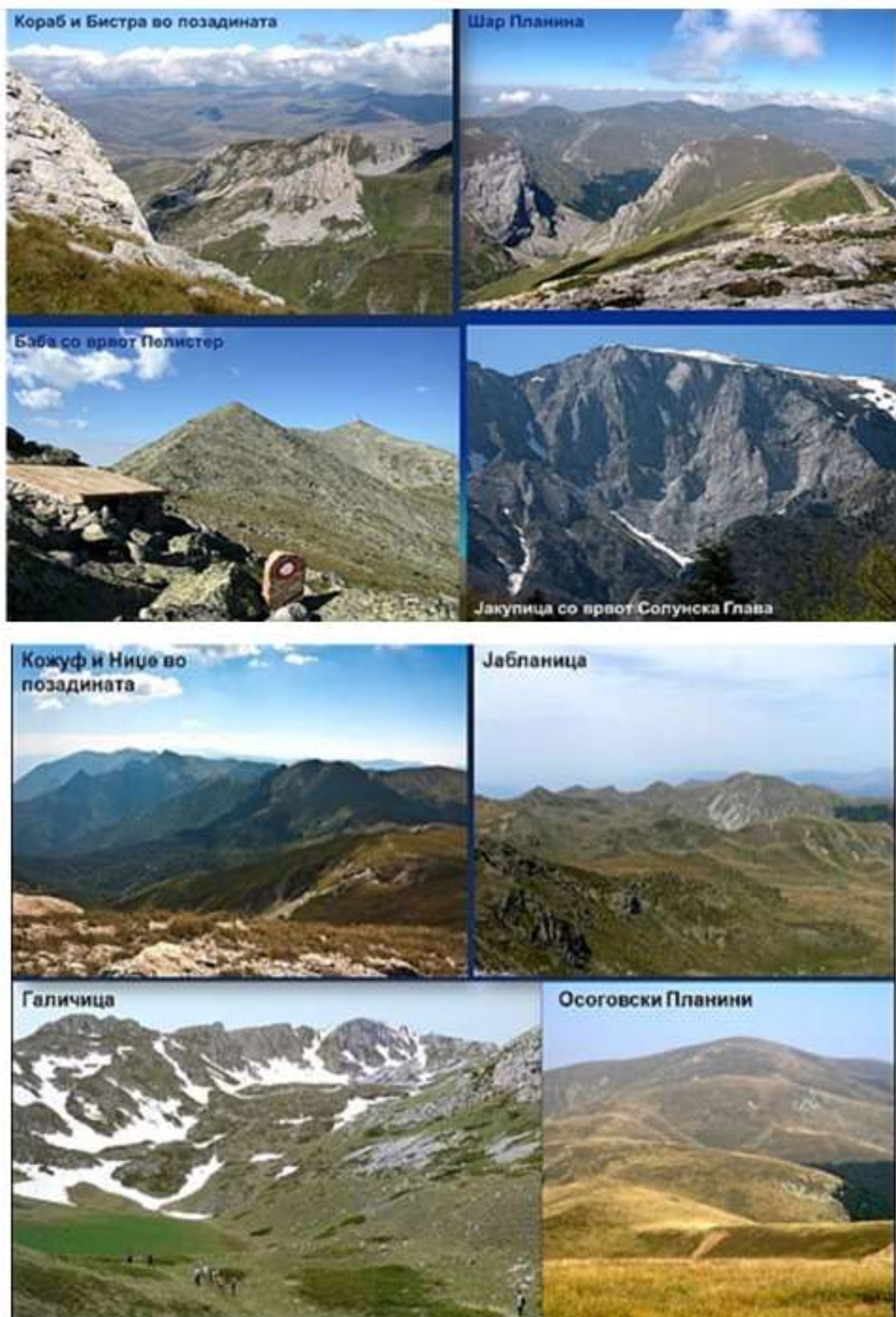
Слика 1 – 8. Врвови на високи планини во РС Македонија