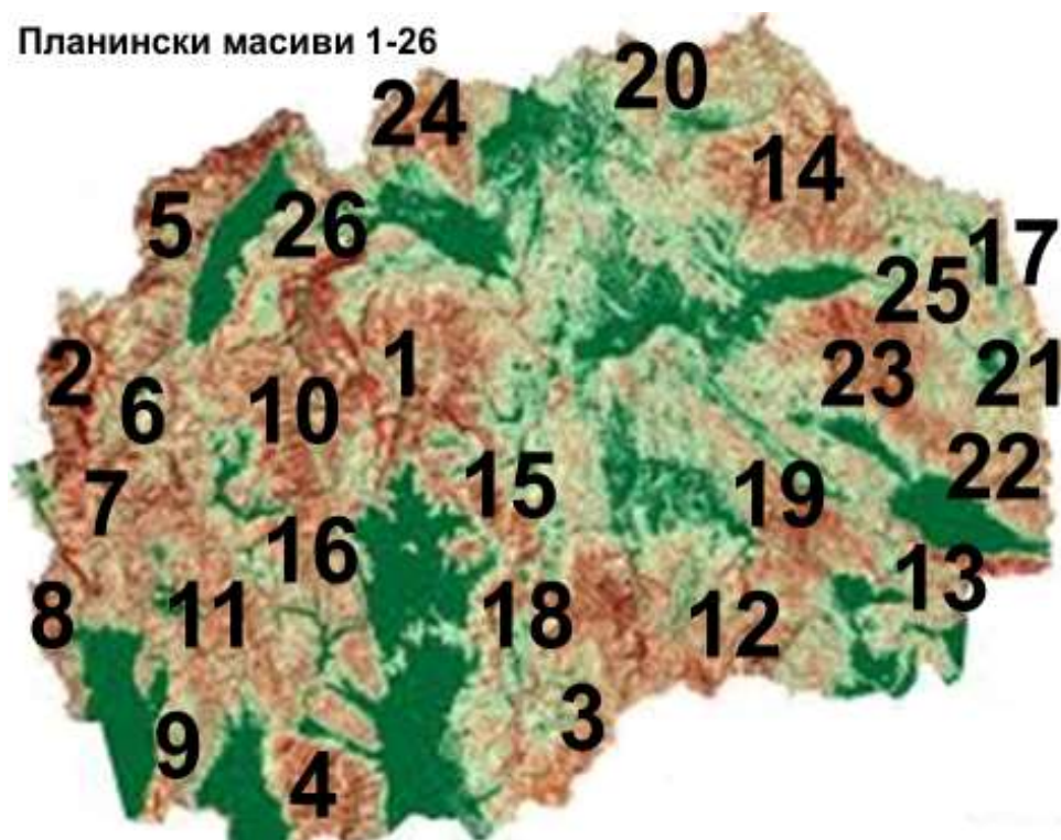
Карта 1. Планински масиви во РС Македонија

Од 26 планински системи, 14 се гранични, а останатите 12 се во внатрешноста на државата. Од 14 гранични планински системи, 10 се високи со над 2 000 м н.в., а останатите 4 се во внатрешноста на државата. Од 12-те континентални планински системи со височина од 2 000 м н.в., 4 се континентални. Од вкупно 221 врвови со над 2 000 м н.в., повеќе од половината се гранични врвови.