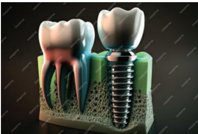
Figure 1. Foto e gjeneruar nga IA 2

Konstruksionet protetikë dentare të mbështetura në implante mund të prodhohen me ndihmën e inteligjencës artificiale (IA), duke sjellë një ndryshim rrënjësor në stomatologjinë bashkëkohore. Analitika e bazuar në të dhëna, e gjeneruar nga inteligjenca artificiale, ofron informacion të vlefshëm mbi mënyrën se si klinikistët mund të identifikojnë strategji trajtimi të individualizuara për pacientin, duke përmirësuar normat e përgjithshme të suksesit. Me evolucionin e vazhdueshëm të inteligjencës artificiale, pritet që ajo të riformësojë të ardhmen e implantologjisë dentare dhe të na udhëheqë drejt një kujdesi oral të personalizuar dhe më efikas (figura 1). 1