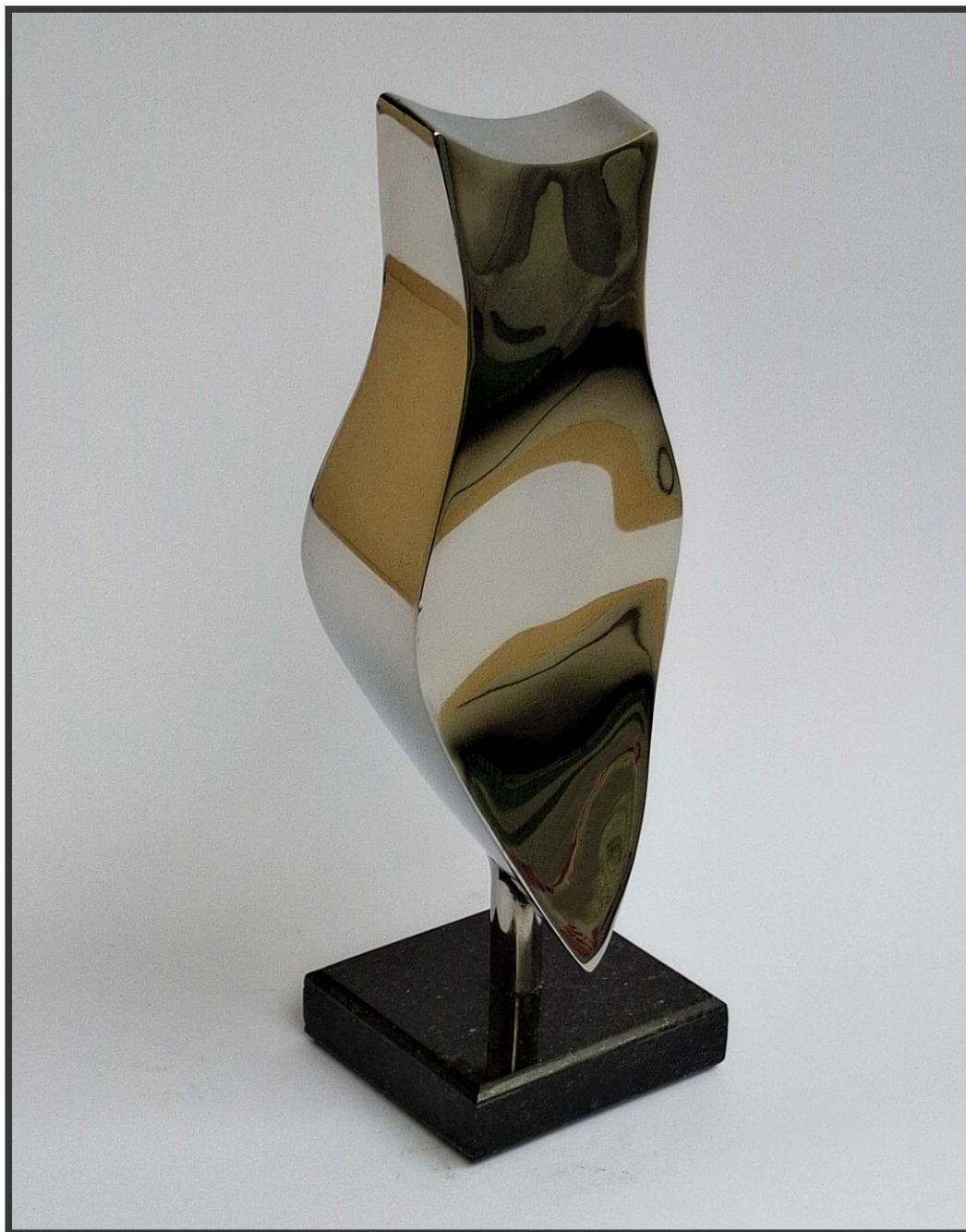
„Чувар простора“ 23x8x7,5cm.