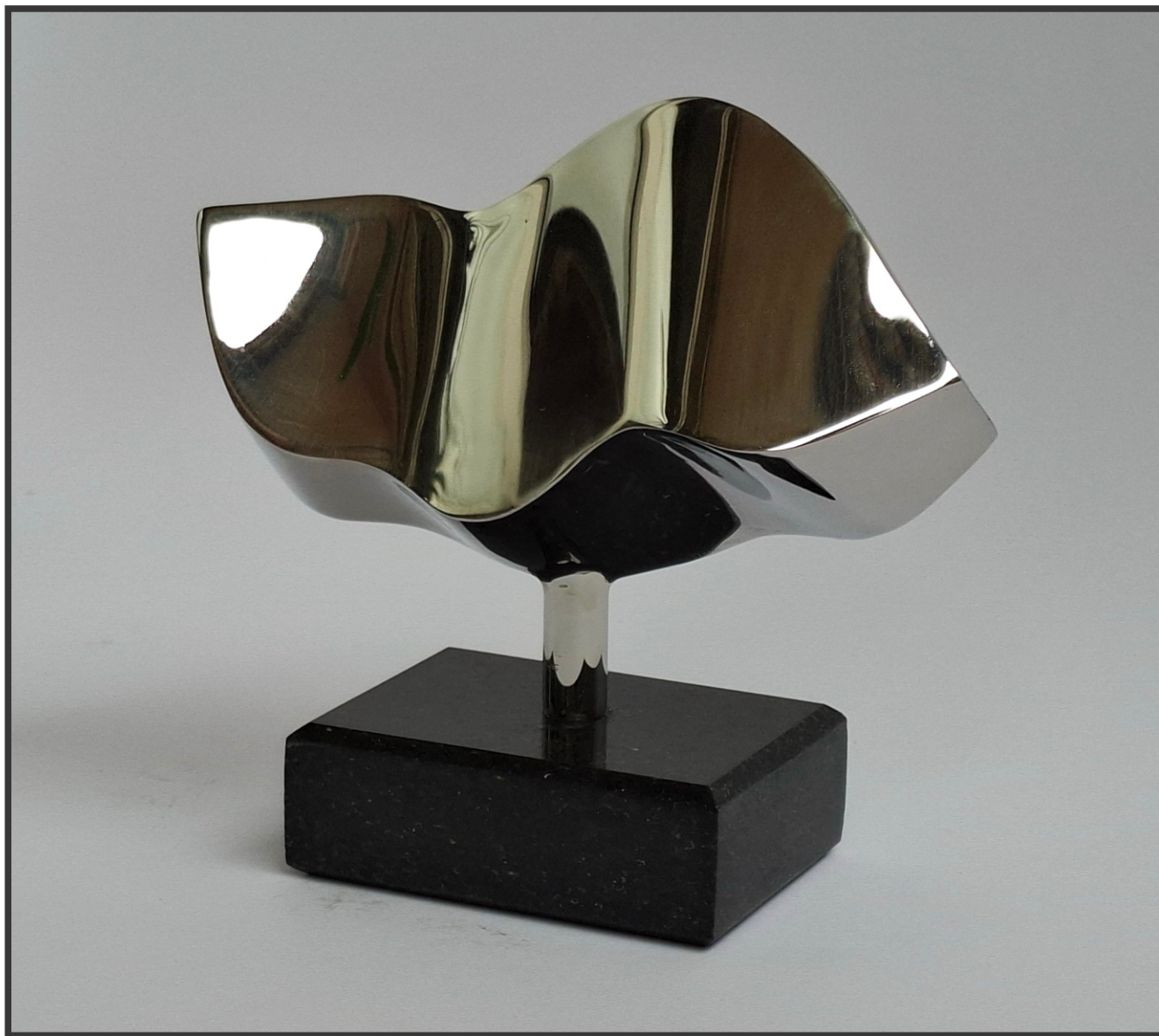
„Узбуркана тишина пре новог почетка“ 14,5x16x8cm.