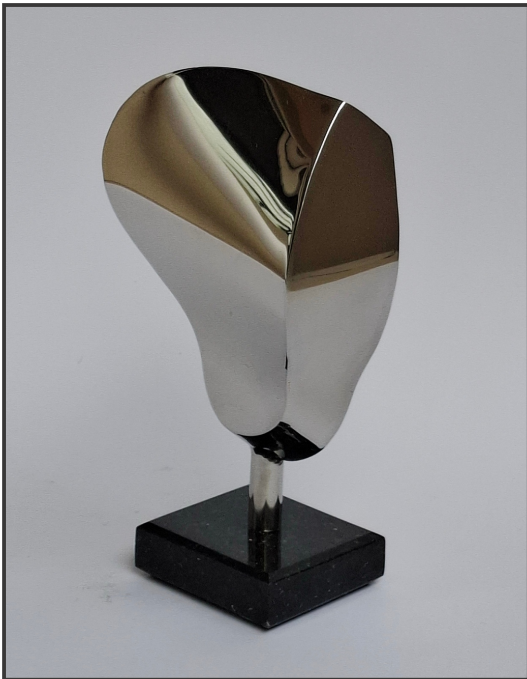
„Унутрашњи ехо“ 19x9,5x6,5cm.