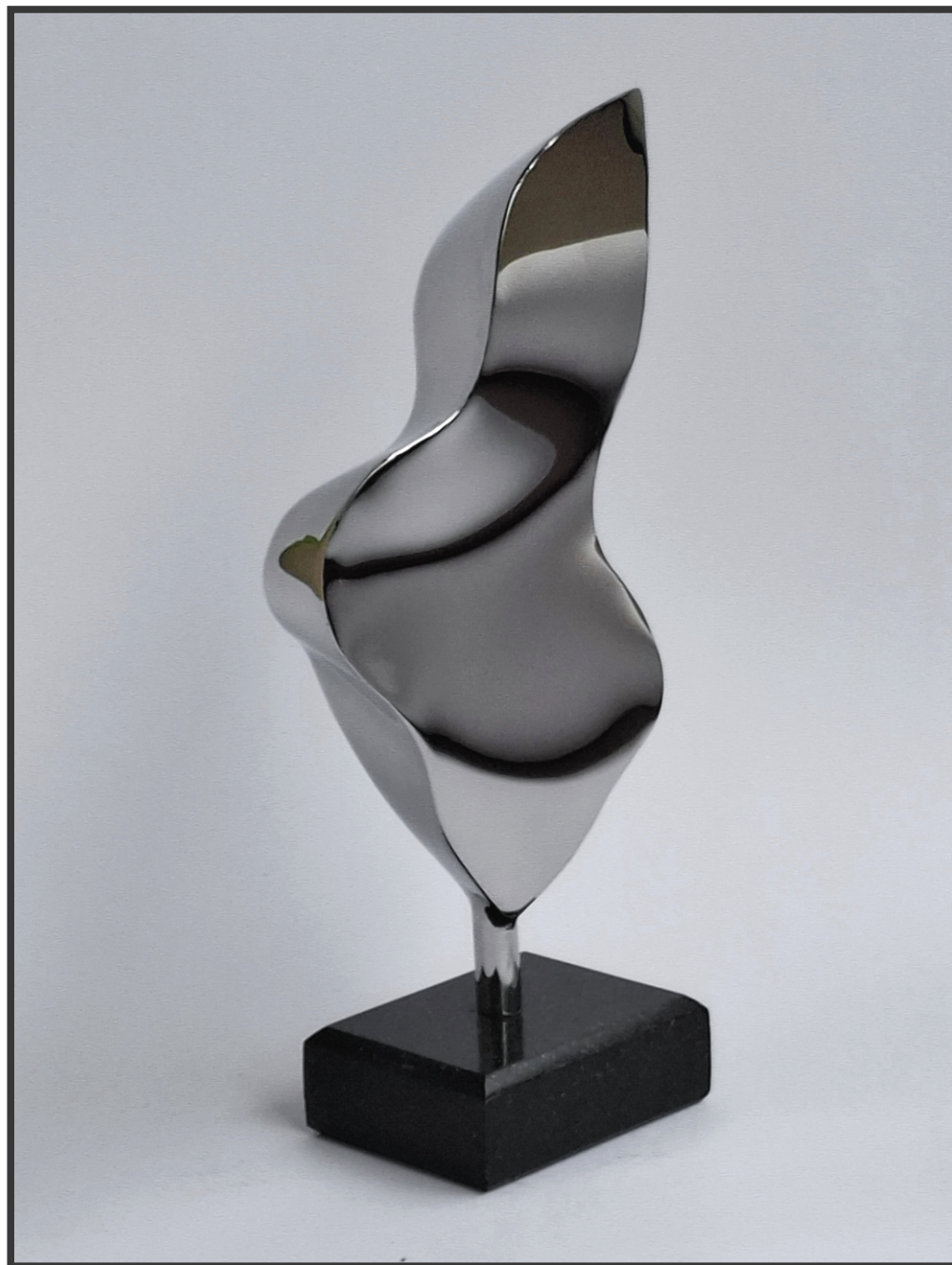
„Додир ветра“ 27x12,5x6,5cm.