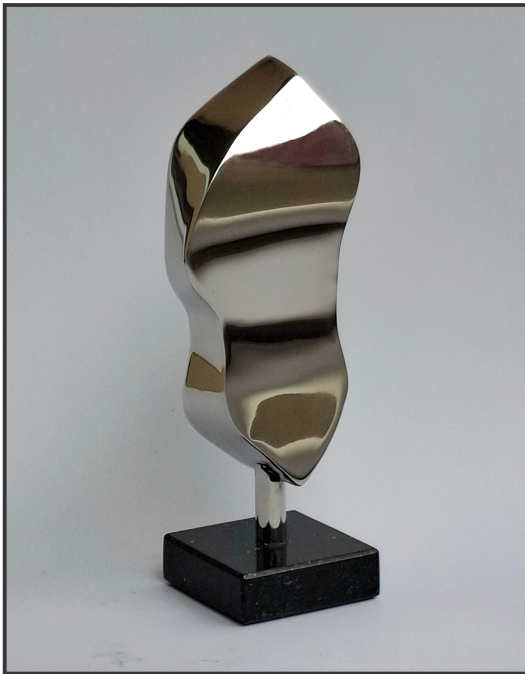
„Између духовног и материјалног“ 21x8x6cm.