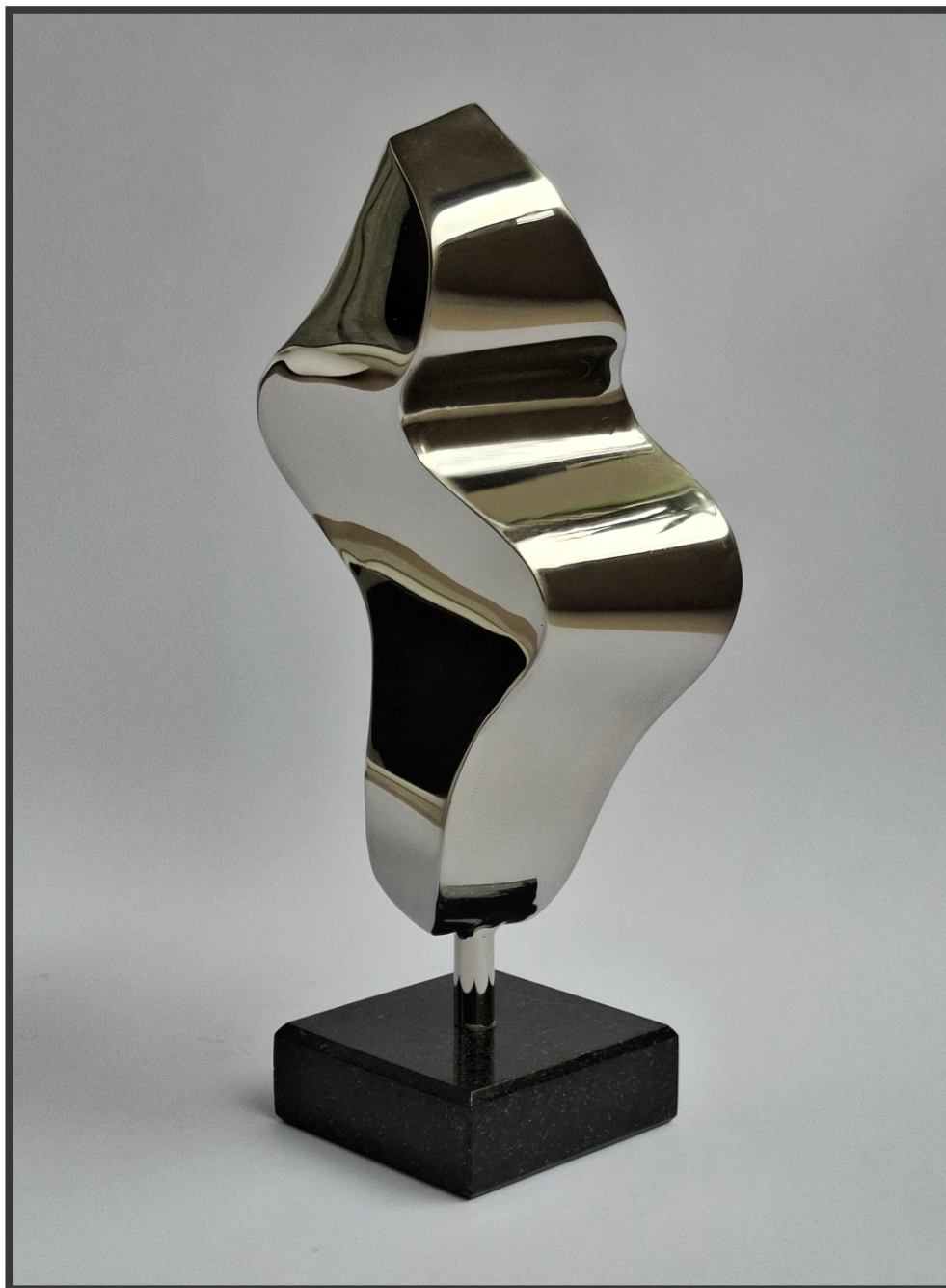
„Светлосни шапат“ 29x12,5x9,5cm.