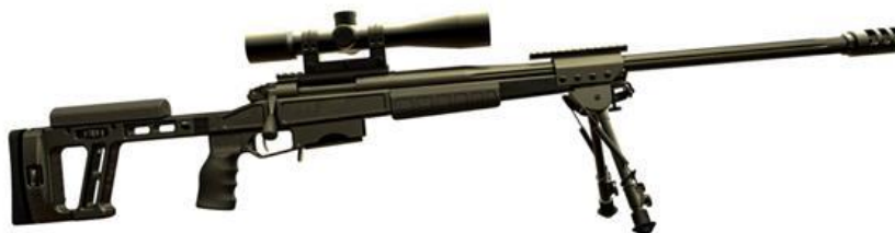
Figura 9: Pușca cu lunetă OPCIC T-5000

Pușca cu lunetă de înaltă precizie OPCIC T-5000 (fig. 9) a fost proiectată și produsă la uzina de arme „OPCIC” a grupului industrial „Promtehnologii”, FR. Pușca poate fi utilizată atât de unitățile speciale FSB, FSO, Ministerul Afacerilor Interne, cât și de grupurile de lunetiști din armată special instruiți [5].