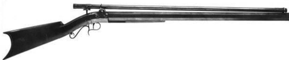
Figura 2: Pușca cu lunetă calibru .45, producția J. F. Brown.

În premieră utilizarea masivă a puștilor cu lunetă în luptă a devenit războiul civil american din anii 1861-1865. Dintr-o pușcă cu lunetă cu țeava octogonală calibru .45 (fig. 2), un trăgător iscusit la distanța de 160 metri încadra cinci gloanțe într-un cerc cu diametrul 28 mm [8, p.12].