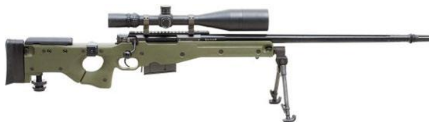
Figura 7: Pușca cu lunetă calibru .300 Winchester Magnum Accuracy International Arctic Warfare Magnum Folding (AI AWM F), cu pat rabotabil.

La o distanță de 550 de metri, o serie de 5 lovituri din pușca modelul AW de bază se încadrează într-un cerc cu diametrul mai mic de 50mm. Puștile pot fi echipate cu diferite înălțătoare optice al cărora loc de fixare servește placa „Weaver”, iar în cazul disponibilității adaptoarelor și a altor înălțătoare optice, fără reglare în câteva secunde. Compania propunea înălțătoare optice Smidt & Bender cu mărimi variabile 3-12 ori, sau Leupold Mark 4 cu mărire de 10 ori, precum și cu un biped amovibil pliabil.