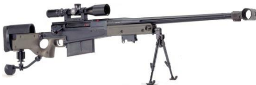
Figura 8: Pușca cu lunetă calibru .50 Arctic Warfare AW50.

O altă pușcă în proiectarea căreia sunt utilizate unele elemente ale „Arctic Warfare” este modelul AW50 calibru .50 BMG (sub cartușul mitralierei Browning de 12,7x99mm) din Marea Britanie (fig.8). Pușca AW50 deține o serie de mijloace care reduc reculul cartușelor puternice, un pat pliabil cu suport reglabil pe înălțime, care împreună cu bipedul standard formează un trepied. Practic este imposibil să efectuezi tragerea din mâni, deoarece greutatea puștii ajunge la 16kg. Lungime țevii este de 686mm. Distanța eficientă de tragere a acestei arme este de 1500-2000 de metri [8, p.287].