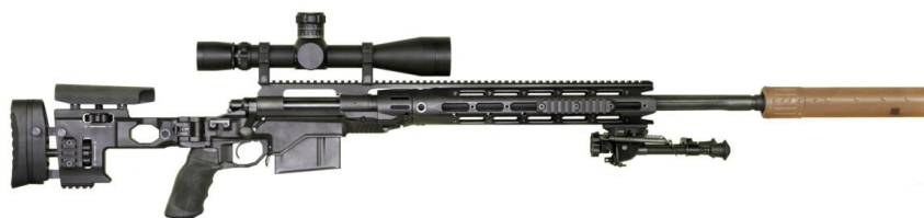
Figura 11: Pușca cu lunetă XM2010 ESR (Enhanced Sniper Rifle)

Pușca cu lunetă XM2010 ESR (Enhanced Sniper Rifle) (fig.11), cunoscută anterior ca M24 Reconfigured Sniper Weapon System, și chiar mai devreme, M24E1, proiectată în anul 2010 de „Remington Arms Company, Inc.”, reprezintă o pușcă cu lunetă M24 cu o modernizare profundă, care la rândul său, este versiunea puștii pentru armată Remington 700 [7].