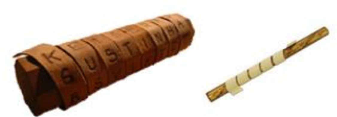
Figura.1 Structura simplă a criptografiei și structura complexă reprezentată prin Scytale

Spartanii, cei mai mari războinici dintre greci, au fost deschizători de drumuri pentru criptografie în Europa. În jurul anului 400 î.Ch., aceștia au creat un dispozitiv cunoscut sub denumirea de scytale pentru a transmite mesaje codificate în timpul campaniilor militare.