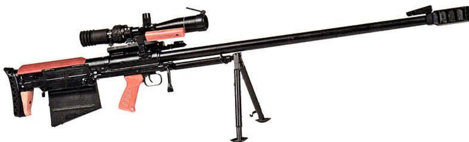
Figura 10: Pușca cu lunetă pentru armată de calibru mare ACBK

Pușcă cu lunetă de armată de calibru mare ASVK, index ГРАУ – 6B7 (fig. 10), cu înălțătoare optic și nocturn – 6C8, 6C8-1, cu o schemă de dispunere a mecanismelor „bullpup”, creată în 2004 de o echipă de designeri ai fabricii „V.A. Degtyarev” din orașul Kovrov, FR, pe baza puștilor KSVK (pușcă cu lunetă Kovrovskaya de calibru mare) și SVN-98 (pușcă cu lunetă Negrulenko). Acest eșantion de arme, din 2004 până în prezent, a fost lansat în producția pe scară largă [8, p.305].