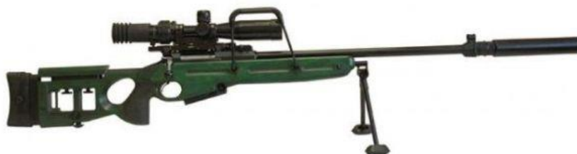
Figura 3: Pușca cu lunetă CB-98.

Țeava puștii este realizată prin forjare radială rece folosind tehnologii occidentale de șlefuire (reglajul fin al piesei prelucrate până la cerințele necesare prin utilizarea barelor abrazive) și ameliorarea tensiunii interioare. Țeava este întărită prin consolă în cutia cu mecanisme și atârnată liber, atinge leagănul, alte părți ale puștii și nu este influențată de suportul biped (așa-numita „țeavă liber plutitoare”). Acest factor asigură constanța fluctuațiilor acesteia, care pot fi luate în considerare la reglarea puștii cu lunetă. Pentru a îmbunătăți precizia focului, alezajul țevii nu este cromat. La gura canalului țevii este partea filetată pentru fixarea atenuatorului de zgomot.