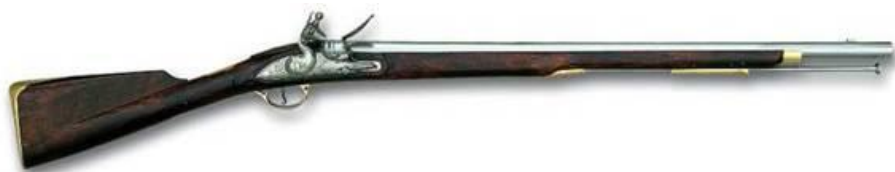
Figura 1: Arma britanică cu mecanism de percție cu cremene

Distanța eficace de tragere pentru acea perioadă de timp nu depășea 91 de metri (100 de dublu pași): 75% de lovire a țintei cu dimensiunea de 180x120 cm. Un exemplu izbitor al unei arme cu țeava lisă din acea perioadă reprezintă arma britanică modelul secolului XVIII cu mecanism de percție cu cremene (fig. 1) [8, p.8].