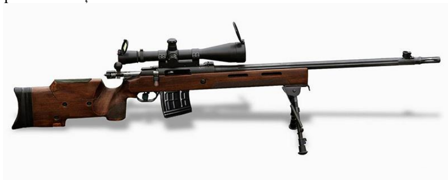
Figura 4: Pușca cu lunetă MIŁ-116M

Țeava masivă cu stingător de flăcări, liber fixată pe uluc. Alimentarea puștii cu lunetă manuală din încărcător. Potrivit producătorului, pușca cu lunetă poate fi echipată cu două tipuri de țevi, destinate pentru cartușe diferite.