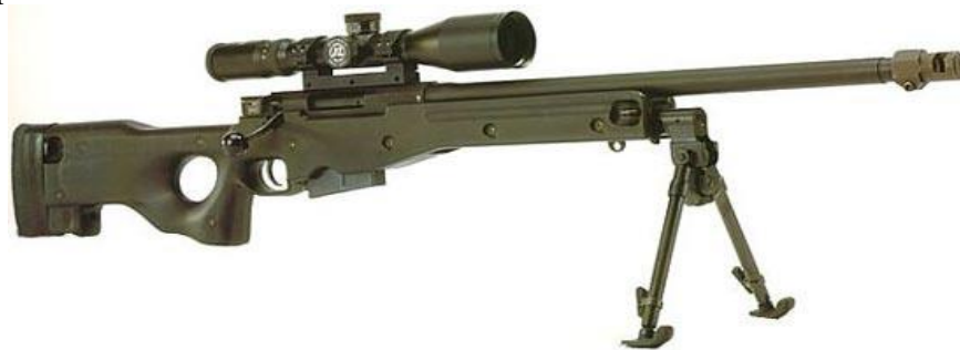
Figura 6: Pușca cu lunetă numite Accuracy International Arctic Warfare (AI AW) calibru 7.62x51mm.

La începutul anilor 90, compania „Accuracy International” a început proiectarea generație doi de puști cu lunetă numite AW „Arctic Warfare” (fig. 6), permițându-i să fie folosit în condițiile de temperatură din Arctica.