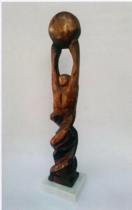
Филип Добривоевски „Стремеж”, дрво, 62x10x8cm, 2024