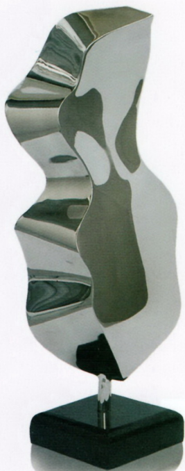
вон. проф. д-р Слободан Милошески „Пркосен поглед”, инокс, 39x14,5x12,5cm, 2023