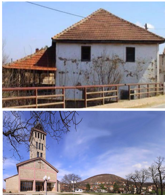
Слика 2: Џамијата на селото Гермова (околу 1827 година) и црквата Свети Јосиф во Горно Стубеле.

Дваесет и двајца (22) од нив се под привремена локална заштита. Многу од сегашните џамии се реновирани. Православните цркви сè уште се во употреба на српската заедница, тие се наоѓаат во селата Бинче, Вербовц, Могила и во градот Витија.