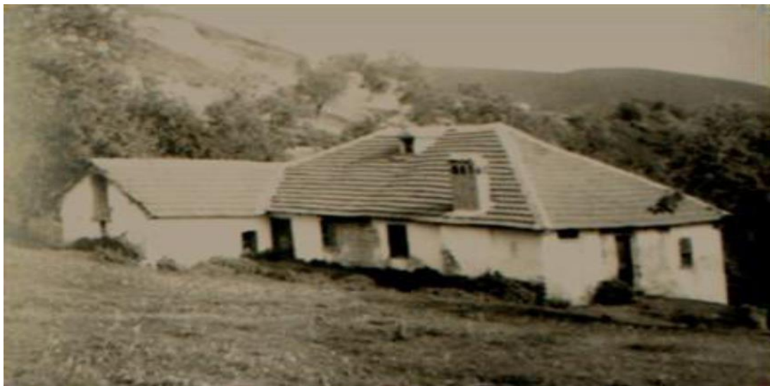
Слика 1: Прво училиште на албански јазик - Стубел - Општина Вити

прашањата, важноста. Улогата на настаните е да привлечат посетители во област во која вообичаено не би патувале. Покрај тоа, тие можат да патуваат до одредена дестинација по завршувањето на настанот или манифестацијата и на тој начин да создадат нова дестинација како вредност. Меѓу другото, има многу факти кои се манифестирани, дека немаат никаква врска, а посетителот мора да биде физички присутен за да ужива во друштвото. Тие се случуваат само еднаш годишно, за разлика од другите туристички настани, што значи дека туристичките движења се концентрираат во кратко време.