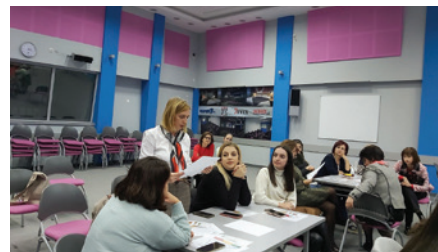
ЕДУКАЦИЈА НА ФАРМАЦЕВИ И МАТИЧНИ ЛЕКАРИ НА ЛОКАЛНО НИВО ЗА ВИСТИНСКА ГРИЖА ЗА ПАЦИЕНТИ СО АСТМА