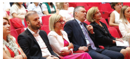
ПО УСПЕШНАТА РЕАЛИЗАЦИЈА НА ПРВИОТ СИМПОЗИУМ СО МЕЃУНАРОДНО УЧЕСТВО ОД ОБЛАСТА НА ФАРМАЦИЈАТА, ОРГАНИЗАТОРИТЕ СО МОТИВ ПОВЕЌЕ СИМПОЗИУМОТ ДА ДОБИЕ ТРАДИЦИОНАЛЕН КАРАКТЕР