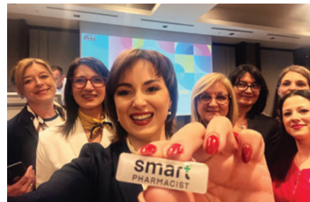
ВТОР СИМПОЗИУМ АПТЕКАРСКА ЗДРАВСТВЕНА ЗАШТИТА ДИЈАБЕТЕС (1-3 АПРИЛ 2024)