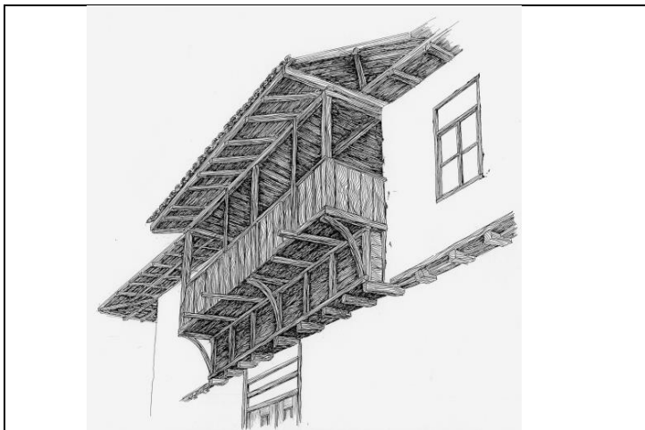
Сл.2.Изглед на еркер, Митрашинци, Берово. Fig 2. View of jety, Mitrashinci, Berovo