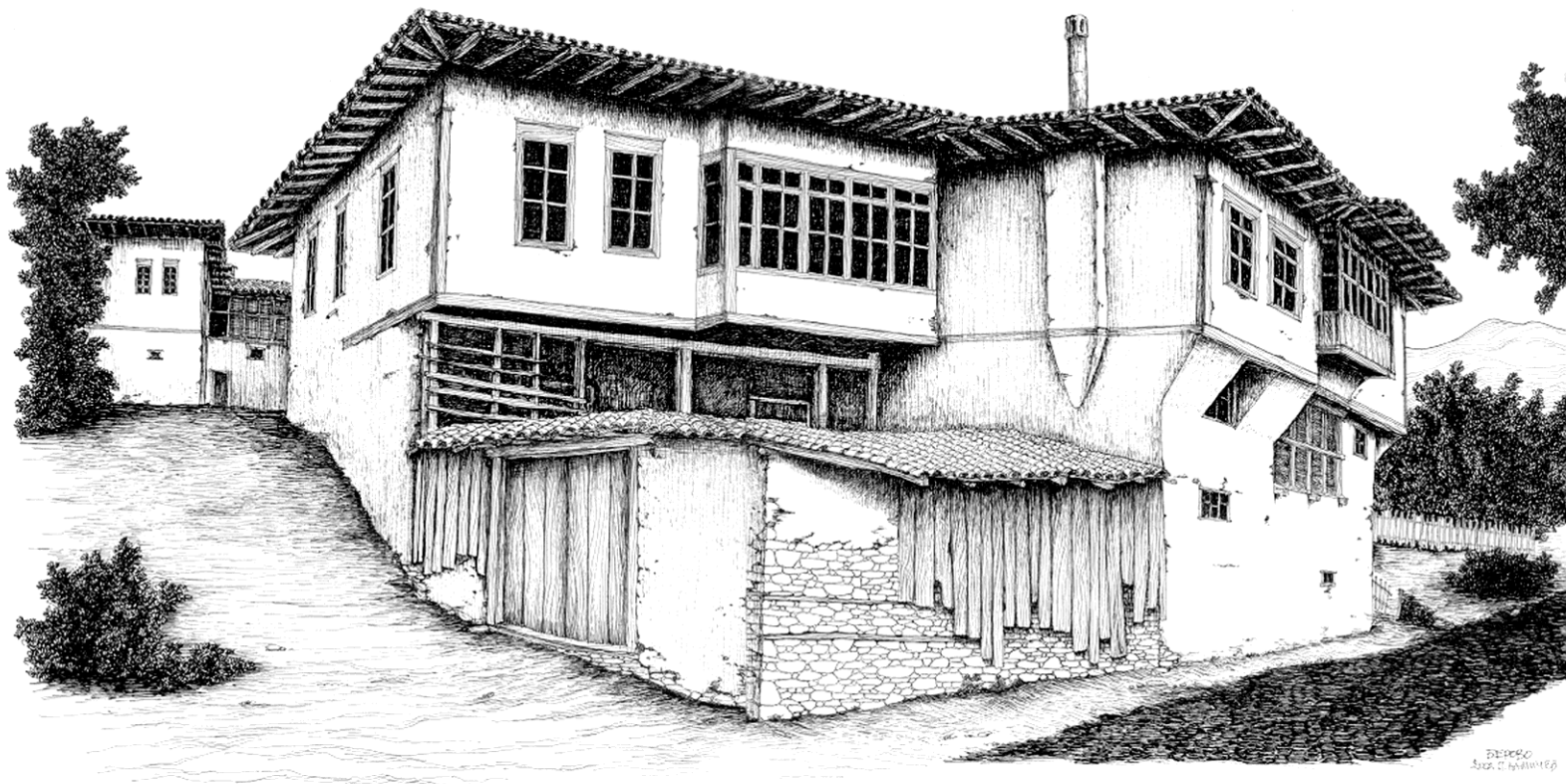
Сл.23.Надворешен изглед на куќа во две нивоа,Берово; Fig.23. Exterior view of a two-level house,Berovo.