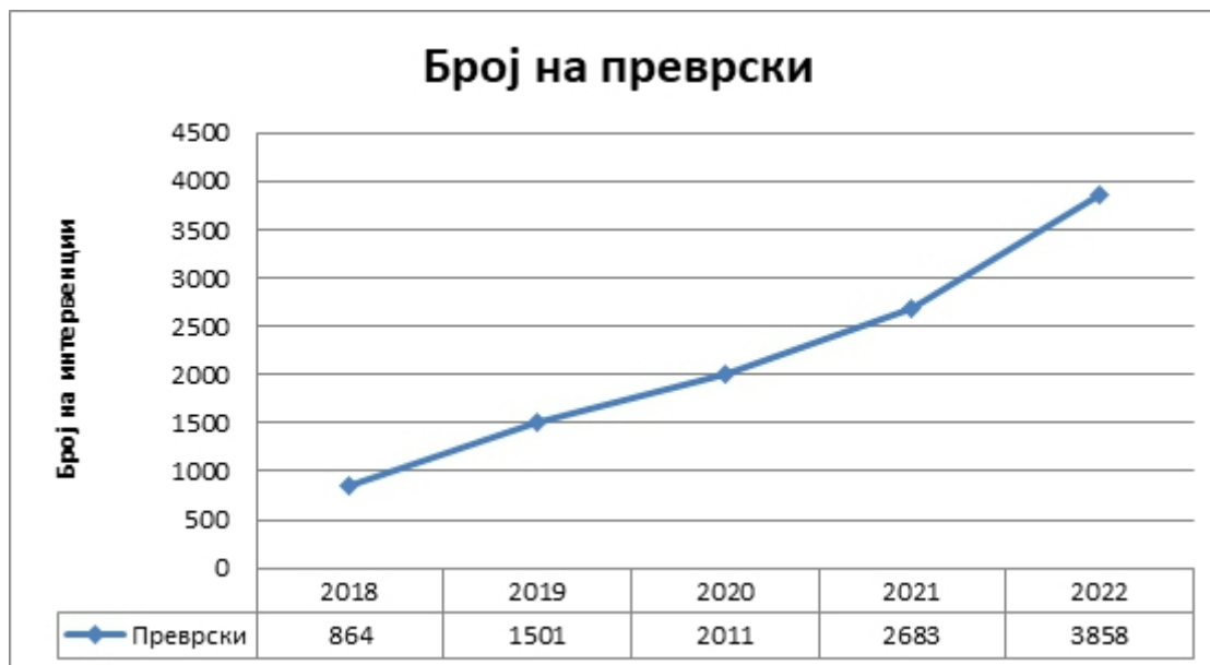
Графикон 1. Број извршених преврјања у периоду од пет година. Chart 1. Number of performed dressings in a period of five years.

У периоду од 2018. до 2022. године на Клиници за радиотерапију и онкологију у Скопљу урађено је укупно 10.917 преврјања амбулантних и хоспитализованих пацијената. Због тренда раста броја интервенција, Хитна помоћ је проширила своје капацитете обезбеђивањем додатног простора и људских ресурса.