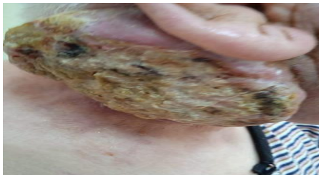
Слика 1. Малигна хронична рана. Figure 1. Malignant chronic wound.

Ране које не показују знаке зарастања у року од четири недеље терапије и не зарасту за 6-8 недеља сматрају се хроничним. Они лече секундарно. (Черниц & Врховник, 2010).