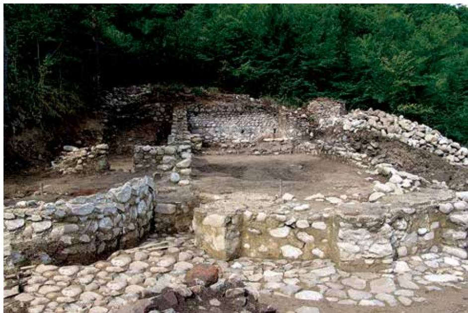
Обр. 7. Съборна църква Extra muros на обект „Шишманово кале“