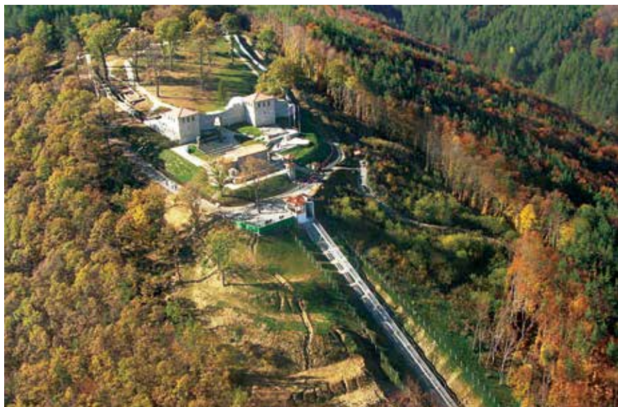
Обр. 5. Крепостта „Цари Мали град“, с. Белчин