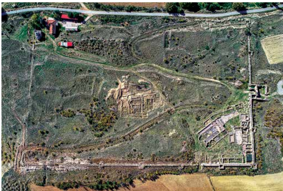
Обр. 1. Късноантичният град Баргала

Началната и крайната точки от разработката маркират градовете, в които живеят и работят двама приятели и колеги, отдадени на древната история и култура, с ясното съзнание за общото историческо минало както през Античността, така и днес. Материалната и духовната култура в селищата и крепостите по трасето между Щип и Самоков е идентична и близка в продължение на повече от две хилядолетия. Нека направим така, че този път да се превърне в маршрут за културен туризъм.