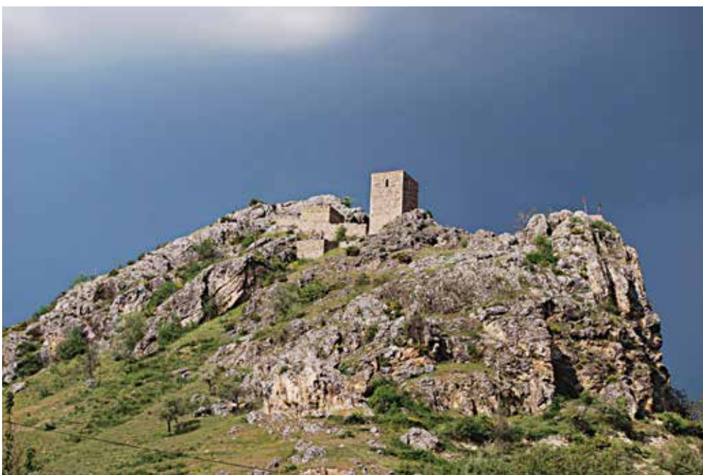
Обр. 3. Късноантично и средновековно укрепление „Градо“ или с. Градище Град – Делчево