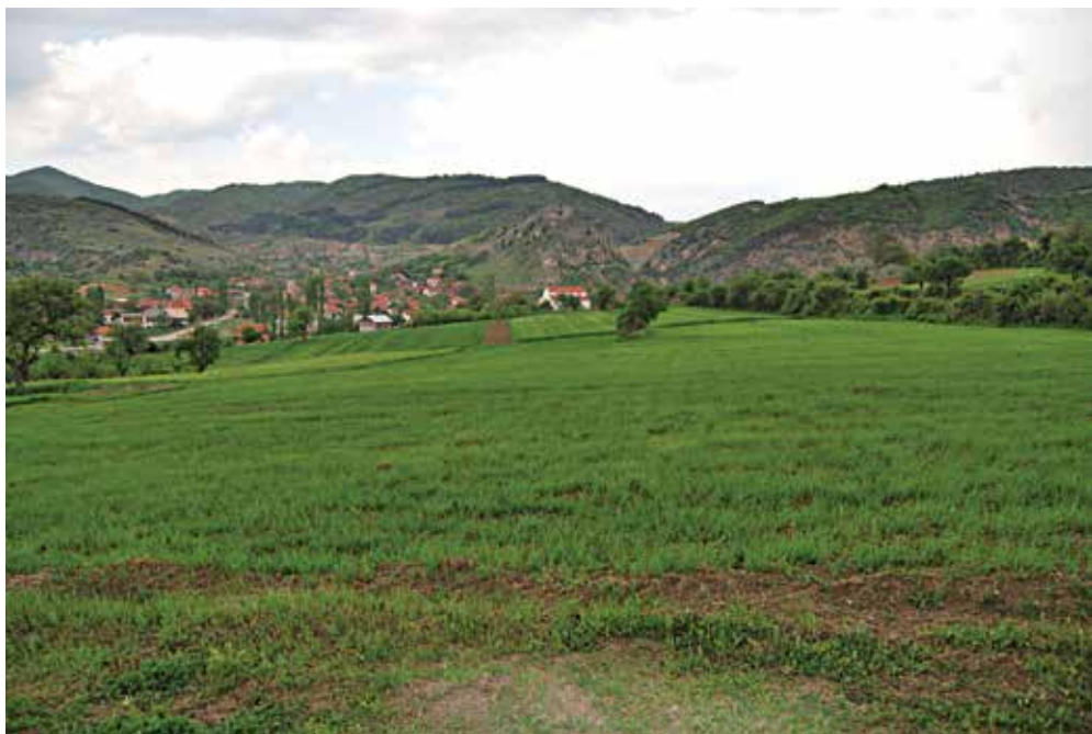
Обр. 4. Село Калище Град – Делчево