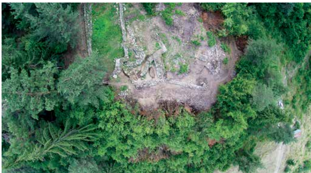
Обр. 6. „Шишманово кале“, сектор Подградие