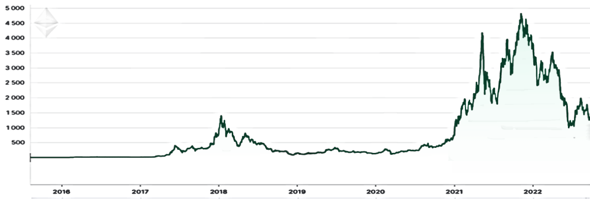
Графикон 2: Движење на цената на Етериум од 2015 до 2022 година (во долари)

Според првичните информации, количината на електрична енергија што се троши ширум светот за одржување на блокчејнот на Етериум паднала за 99,99% и наместо 23 милиони MWh годишно, сега троши само 2 600 MWh. Се намали и вкупната глобална потрошувачка на електрична енергија за 0,2% и наместо да се троши 200 kWh електрична енергија за една трансакција, сега се потребни само 0,03 kWh. Блокчејнот на Етериум сега има капацитет за спроведување и до 100.000 трансакции во секунда, а брзината на извршување на една трансакција од 14 секунди, се намали на 12 секунди.