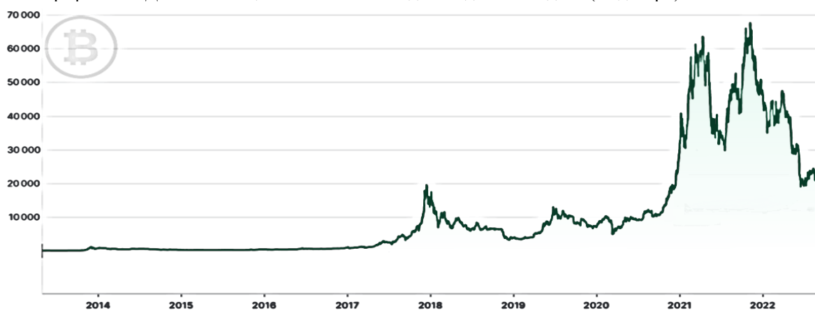
Графикон 1: Движење на цената на Биткоин од 2013 до 2022 година (во долари)

Кога биткоинот започна да се тргува во почетокот на 2010 година, неговата цена изнесуваше 0,06 долари, а својот врв го достигна во ноември 2021 година кога изнесуваше 68 649 долари. Се претпоставува дека овој раст е поради најавата на компанијата Tesla, производител на електрични автомобили, дека купила 1,5 милијарди американски долари во биткоин и дека планира да овозможи клиентите да плаќаат и со биткоин. Во крајот на септември 2022 година, цената на биткоинот се движи околу 19 000 долари.