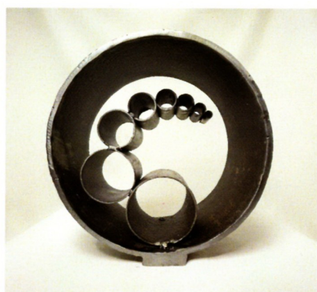
Озбег Ајваз „Живот во живот“ метал, 23x22x9см 2023