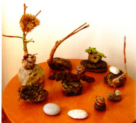
Тања Миљоска „Композиција“ тех.комбинирана, 50x50x50см 2023