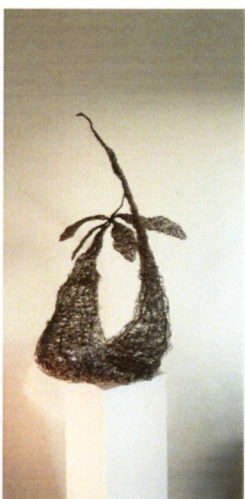
Маја Танева „Одмарање“ метал, плексиглас, 100x20x20см, 2022