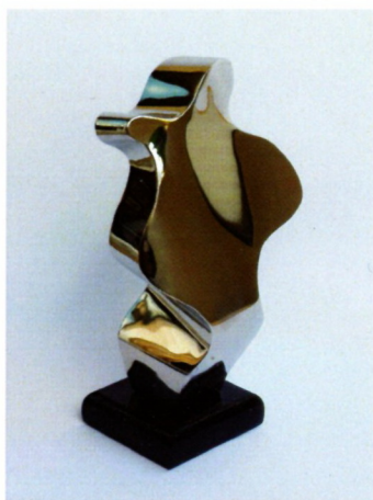
Слободан Милошески „Будење“ инокс, 32,5x18,8x12,7см 2022