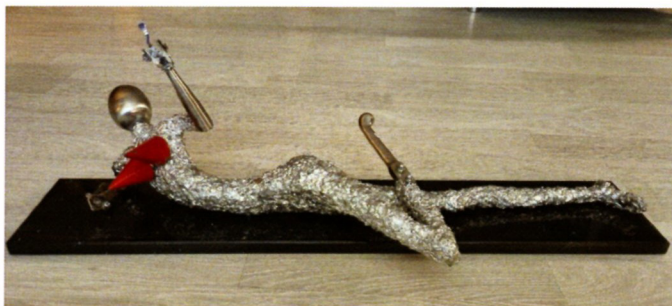
Златко Бојковски „Муза“ калај, железо,челик,цинк, 50x30x30см 2023