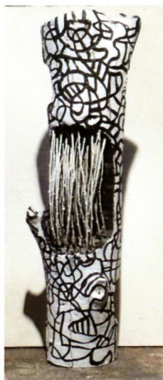
Душан Георгиевски „Не секогаш шума“ дрво, акрил, 90x35см 2022