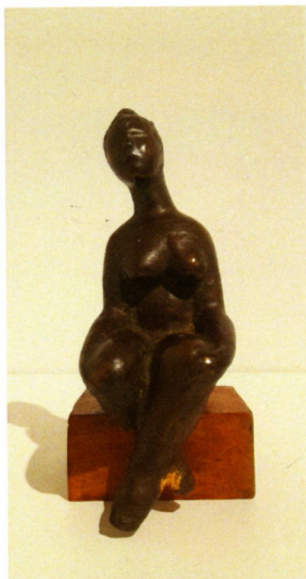
Боро Митриќески „Девојка“ бронза 24x7x9см