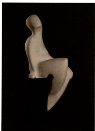
Никола Смилков „Двоумење“ мермер, 40x15x20см 2022