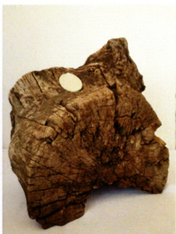
Стефан Анчевски „Сосредочување на творецот и жртвата“ дрво, огледало, 26,5x29x21см, 2022