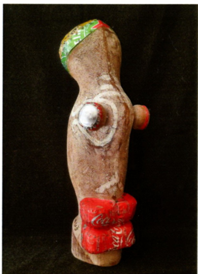
Анѓел Димовски Чауш „Генерација КК“ дрво, метал, 57x23x17см 2023