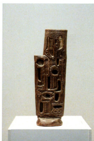
Боро Новаковски „Откривање“ керамика, 57x17см 1976