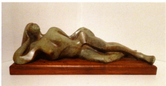
Димитар Филиповски „Лабаво“ бронза, 15x50x14см 2022-23