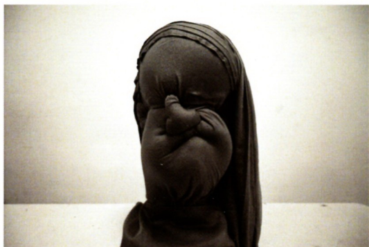
Ненад Тонкин „Портрет“ сунгер, текстил, 49x30x30см 2023