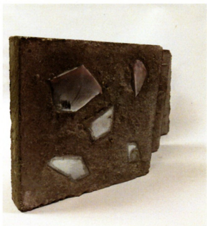
Стефан Јакимовски „Квадар“ бетон, цинк, 3x20x20x5см 2022-23