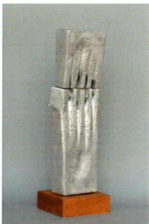
Синиша Новески „Лузни“ алуминиум, 40x12x12см 2023