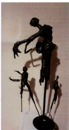
Нела Јанковска „Матеврзум мајка“ тех.комбинирана, 115x55x 34см