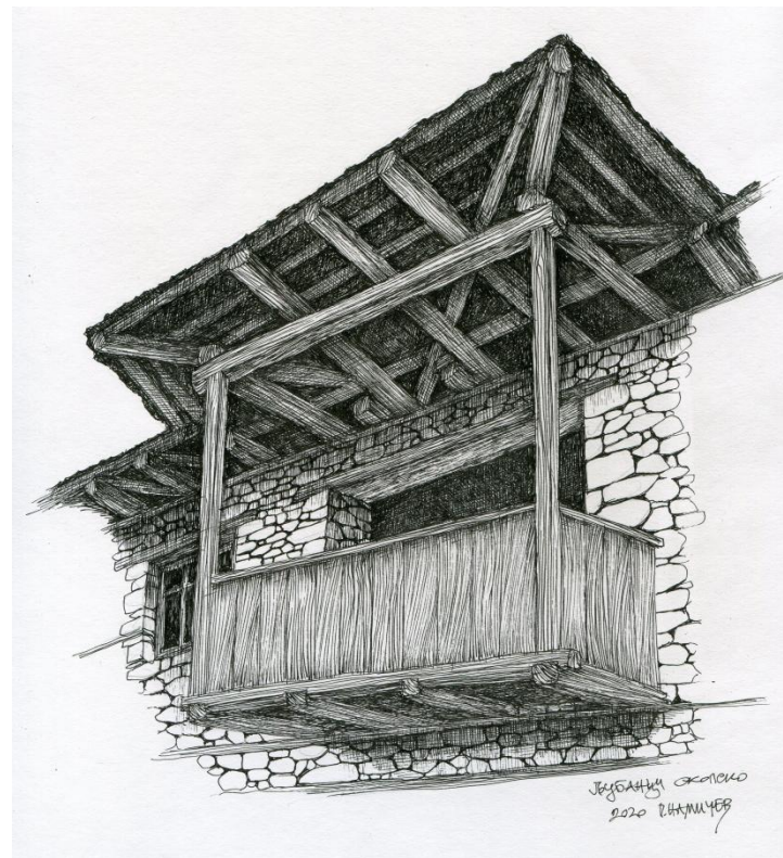
Сл.3.Балкон од куќа, Љубанци.Fig.3. A balcony, Ljubanci