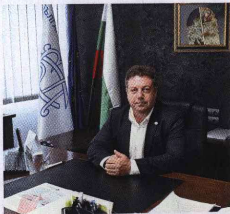
Д-р Иван Маджаров Председател на Управителния съвет на Българския лекарски съюз