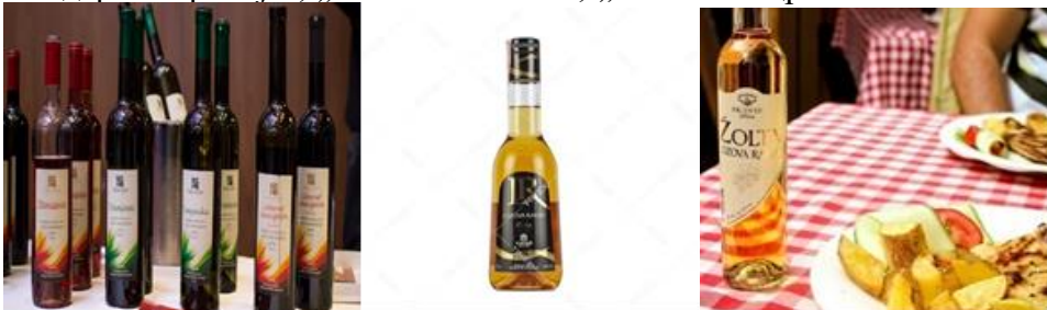
Слика 6. Македонски традиционални пијалаци (вино и ракија).

А од пијалациите би ги споменале: „македонски вина“, „македонска лозова“, „сливова ракија“, „струмичка мастика“, „кавадаречка ракија“, „неготинска жта“, „тиквешко црвено“ и слично.