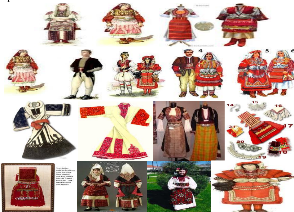
Слика 1. Приказ на разни носии од разни региони во РС Македонија

Извор: Стојмилов, А. (1993), Туристичка географија, Просветно дело, Скопје, стр. 121 – 122