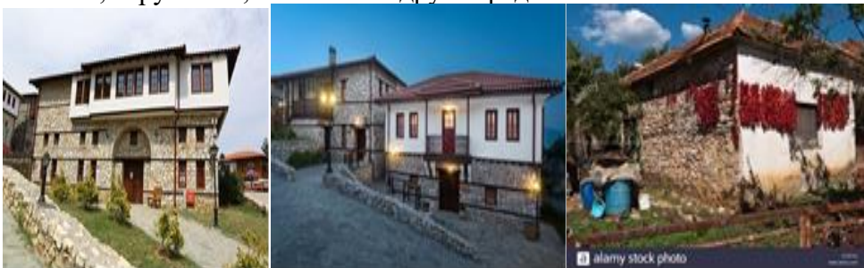
Слика 3. Слики од разни видови на македонски куќи

Додека пак, типични станбени градби од ќерпич има во рамничарските делови на: скопско, пелагониско, дебарско, тетовско, велешко, струмичко, кочанско и други средини.