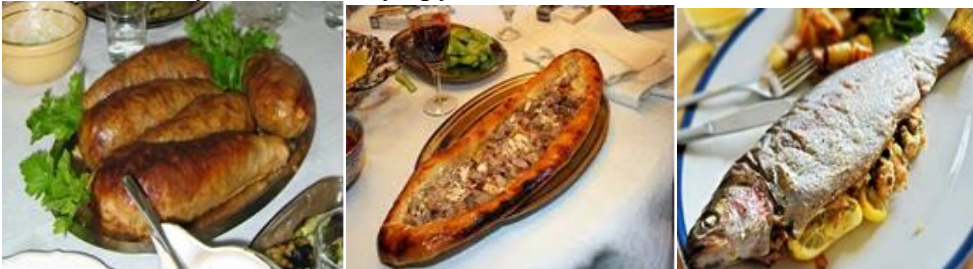
Слика 5. Специјалитети од македонската кујна: од лево кон десно охридска пастрмка, прилепски ширден и штипска пастрмалија

Од големиот број специјалитети на македонската кујна кои им се нудат на странските туристи би ги издвоиле: „пастрмка на охридски начин“, „јагула на струшки начин“, „прилепски ширден“, „битолска шкембе чорба“, „штипска пастрмалија“, „преспански крап“, „дојрански крап“, „овчеполска пастрмалија“, „кумановска пивтија“, „вардарско грне“, „беровско сирење“, „кочански пилав“, „македонска турли-тава“, „македонски ајвар“, „македонско тавче–гравче“, „македонска мусака“ и многу други.