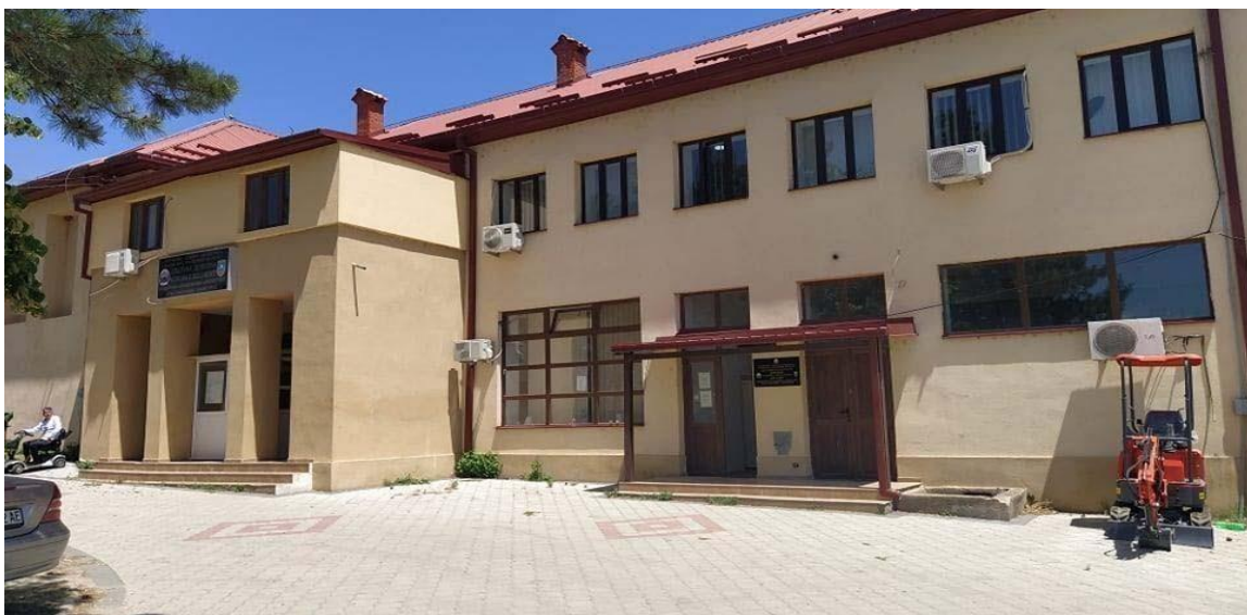
Слика 1.1. Општинска зграда од Општина Долнени - с. Ропотово

Во прилог ви доставуваме слики од терен, со цел визуелизирање на социоекономските карактеристики на оваа општина и објектите со кои таа располага.