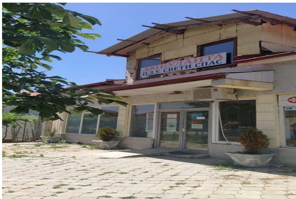
Слика 1.2. Повеќенаменски стадион во с. Ропотово, сликано од Анита Волческа Picture 1.2. Multipurpose stadium in Ropotovo, taken by student Anita Volceska

Сликано на терен, студент Анита Волческа, 1.07.2021