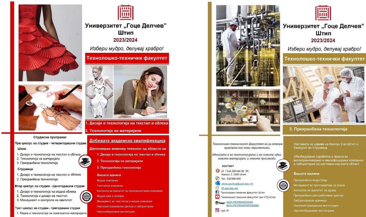
Флаер и и Флаер 2 (на насловна)