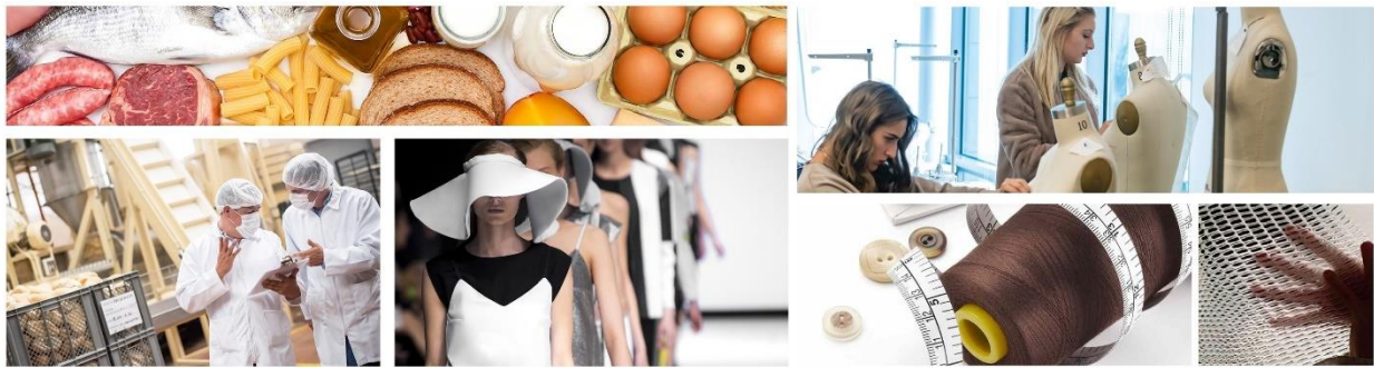
Страна 0 (Насловна)