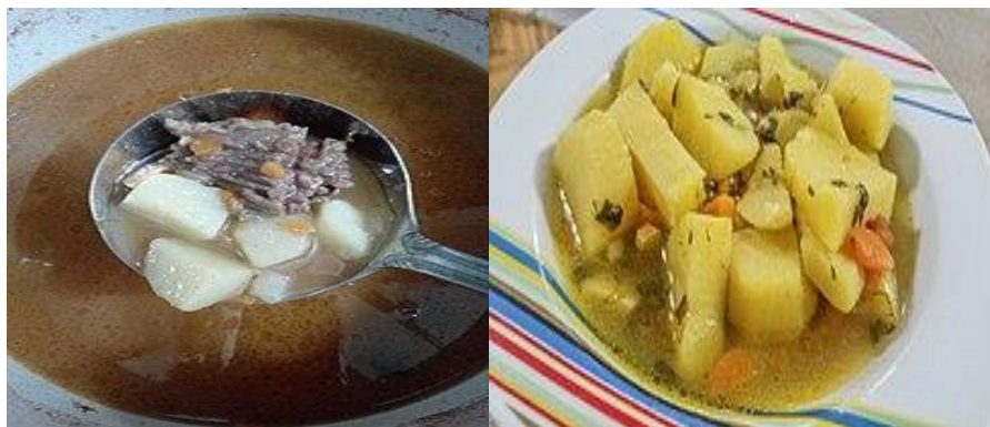
Слика 6. Од лево на десно: Јанија со телешко месо и посна јанија

- Исто така има и додатно салати како: зелка салата, мешана салата и туршија.