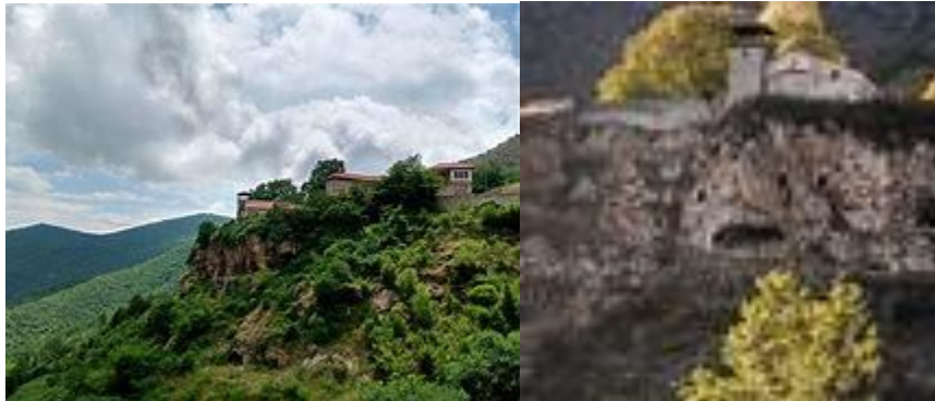
Слика 4. Приказ на испосниците и тихувалиштата под манастирот Зрзе

постапки со јасно разликување на печките, огништата и работните платоа (Димитров, Методијески, Котески, Ангелкова-Петкова, Религиозен туризам, 2017).