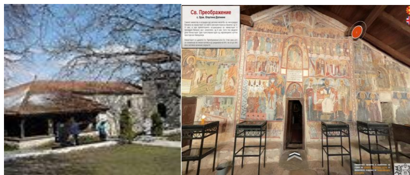
Слика 3. Надворешниот дел од црквата Св. Преображение https://markukule.mk/wp-content/uploads/2021/09/Screenshot_4-8.png 2. Археолошки наоди во манастирот Зрзе