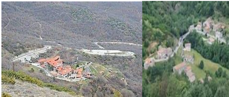
Слика 5. Приказ на дел од пристапниот пат до манастирот Зрзе

Прилеп е оддалечен од Битола 40 километри (Р106). Со оглед на фактот што од грчката граница до Битола има само 15 километри манастирот Зрзе срдечно го препорачуваме на сите туристи кои често престојуваат во Битола. Дел од своето слободно време можат да го искористат да го посетат манастирот Зрзе, и сигурни сме дека ќе ги импресионира со својата убавина. ( Котески, Собраќај во туризмот, 2017).