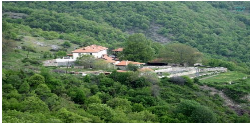
Слика 2. Панорамска слика на манастирот Зрзе