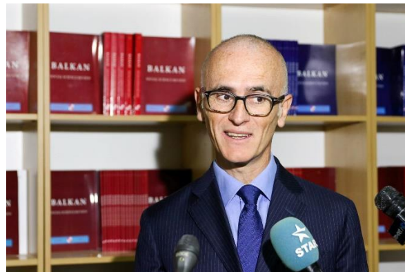
Италијанскиот Амбасадор Н.Е. Андреа Силвестри