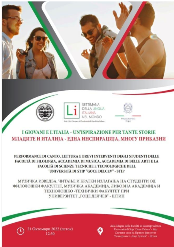
Постер од настанот