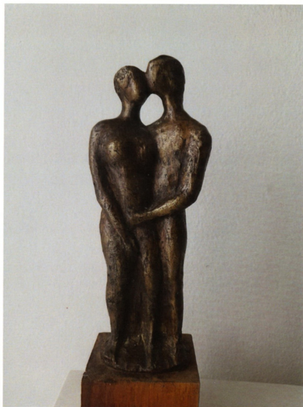
Боро Митриќевски, „Занесеност“ бронза, 17x7x5см, 1989 г