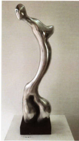
Анѓел Димовски Чауш „ Танчерката на Дионис VII “ техника -алуминиум дим 64x18x7см 2021 г