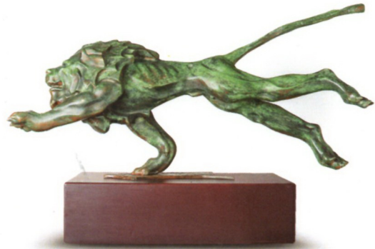
Димитар Филиповски, „Трк“, бронза, 56x21x81см,2019г2022 г