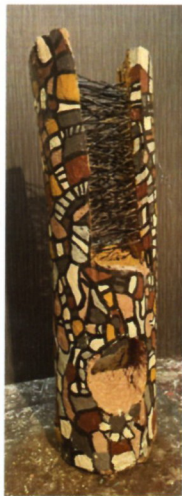
Душан Георѓиевски, „ Крик “ техника-дрво дим 100x30x25см 2022 г