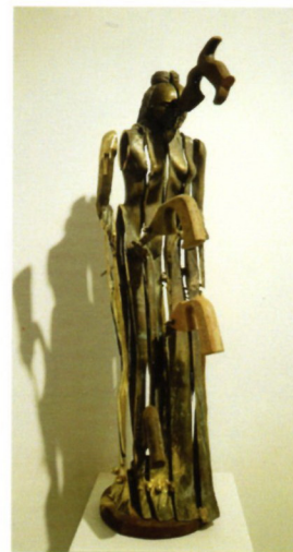
Златко Бојковски, „Мадона“ бронза, 80x25x10см, 2022