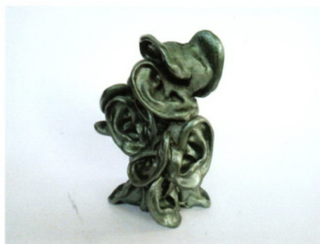
Перо Кованцалиев „ Послушај “ техника-лиен полиестер дим 19x15x12см 2022 г