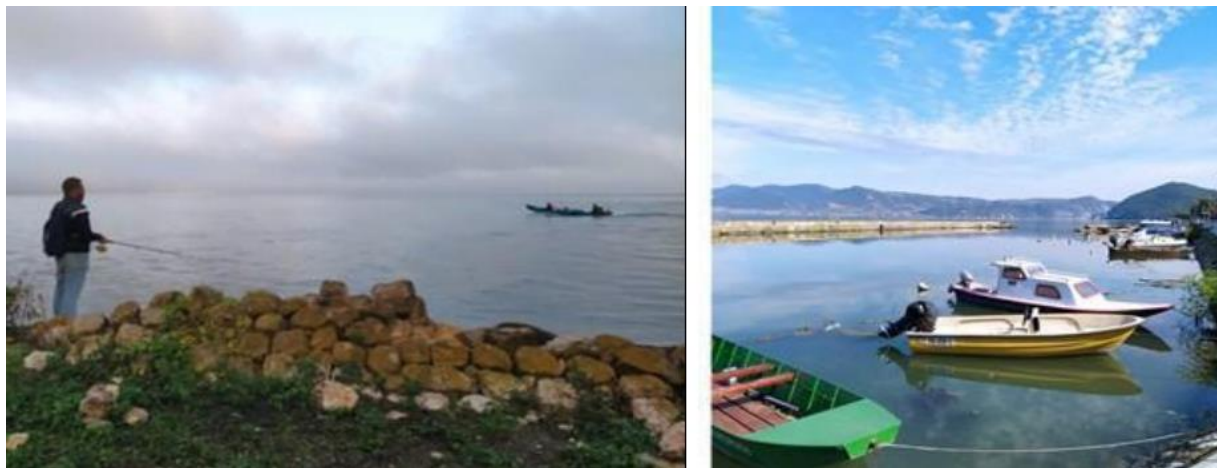
Слика 7: Руралната Општина Голубац

потоа руралните општини Жагубица, селата Милановац, Лазница и Сув Дол, како и руралните општини Голубац (слика 7), со селата Радошевац, Добра и Брњица на брегот на Дунав.