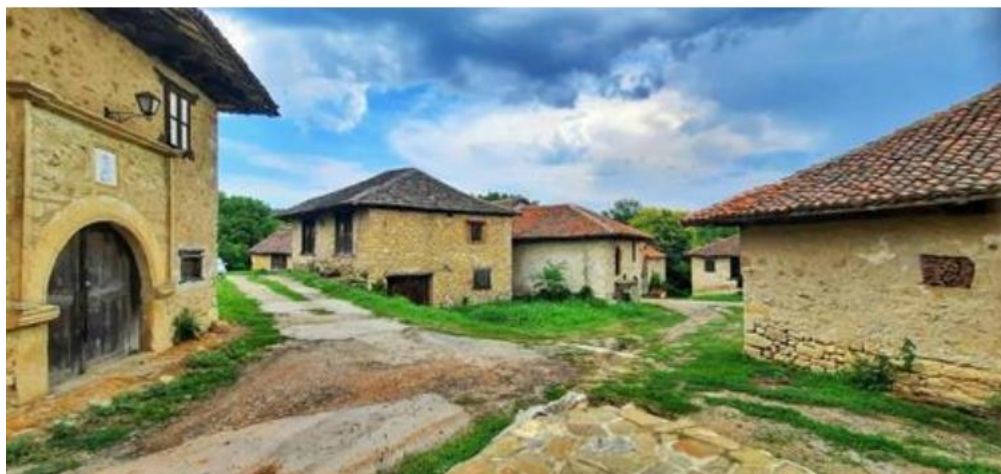
Слика 3: Рајачки пимници, Рајац (Неготин)

Според пописот од 2012 година, во Србија се евидентирани дури 628.552 земјоделски домаќинства, од кои само 0,7 % биле директно вклучени во туризам, покрај основните земјоделски и преработувачки активности (Богданов и Бабовиќ 2014). Според податоците на Асоцијацијата за