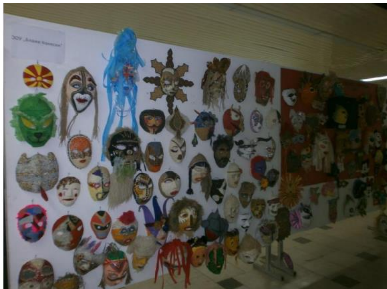
Слика 1: Прилепските „мечкари“ за Прочка 2017

• Полошкиот Регион има вкупно 184 населби (182 рурални и 2 урбани), распоредени во 9 општини со вкупно 312.957 жители во 2018 година и со просечна густина на населеност од 133,3 ж/км 2 . Во овој регион, носител на туристичките активности е планинскиот туризам на планините Шар Планина, Бистра, Кораб, Дешат, Крчин и Стогово. Значајни активности се реализираат и во националниот парк „Маврово“, со ендемична и живописна флора и со разновидна фауна.