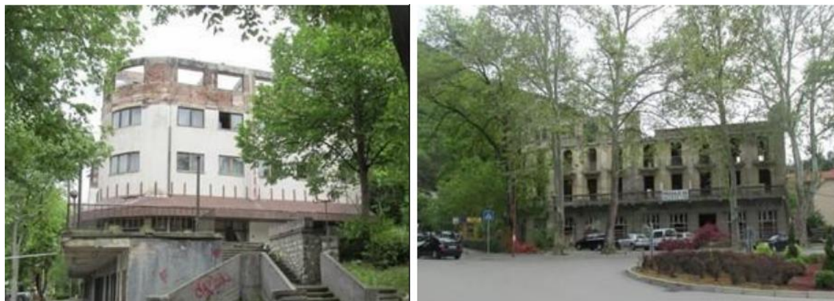
Слика 5: Руинираните хотели „Партизан“ и „Србија“ во Нишка Бања Извор: Фотографии на Александра Терзиќ (коавтор)

Извор: Републички завод за статистика, „Општини во Србија“, 2019.