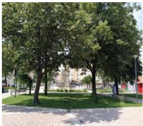
Слика 8а: Централен плоштад на Куршумлија

Подунавскиот Округ има скромна концентрација на туристи (19.385 туристи), со поизразена побарувачка насочена кон урбаниот центар Смедерево (76,7 %). Притоа, во 2018 година, дури 88,9 % се странски туристи, додека во другите општини доминираат домашните туристи (87,4 %). Урбаните центри Смедерево, Смедеревска Паланка и Велика Плана, имаат мал број рурални туристички домаќинства и најмногу се насочени кон урбан и транзитен туризам. Приватно сместување во вид на рурални вили и домаќинства има во приградската населба Удовице, во крајбрежниот дел на излетничката област Југово. На територијата на Смедеревска Паланка, селски домаќинства има во селото Азања и во Велика Плана (приградска населба на Велико Орашје), каде што се наоѓа етноселото „Моравски конаци“.