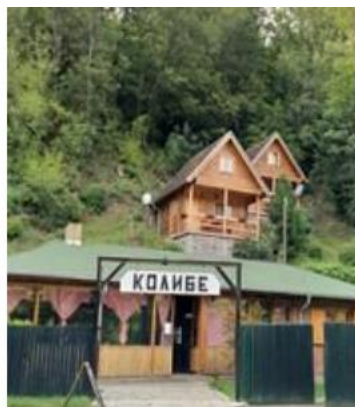
Слика 8б: Ресторан „Колиби“