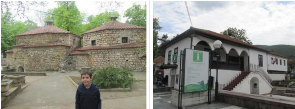
Слика 6: Сокобања

поголема мера во општините Нишка Бања (село Банцарево, Јелашница, Сиќево), Алексинац (Бован, Мозгово, Липовац, Моравски Бујмир), Сврљиг (Белоиње, Попшица, Нишевац, Пирковац), Гаџин Хан (Дубрава), Долни Душник, Семче, Гркиња, Горно Власе, Горни Барбеш и Бела Паланка (Мокра, Варандол, Дивљана).