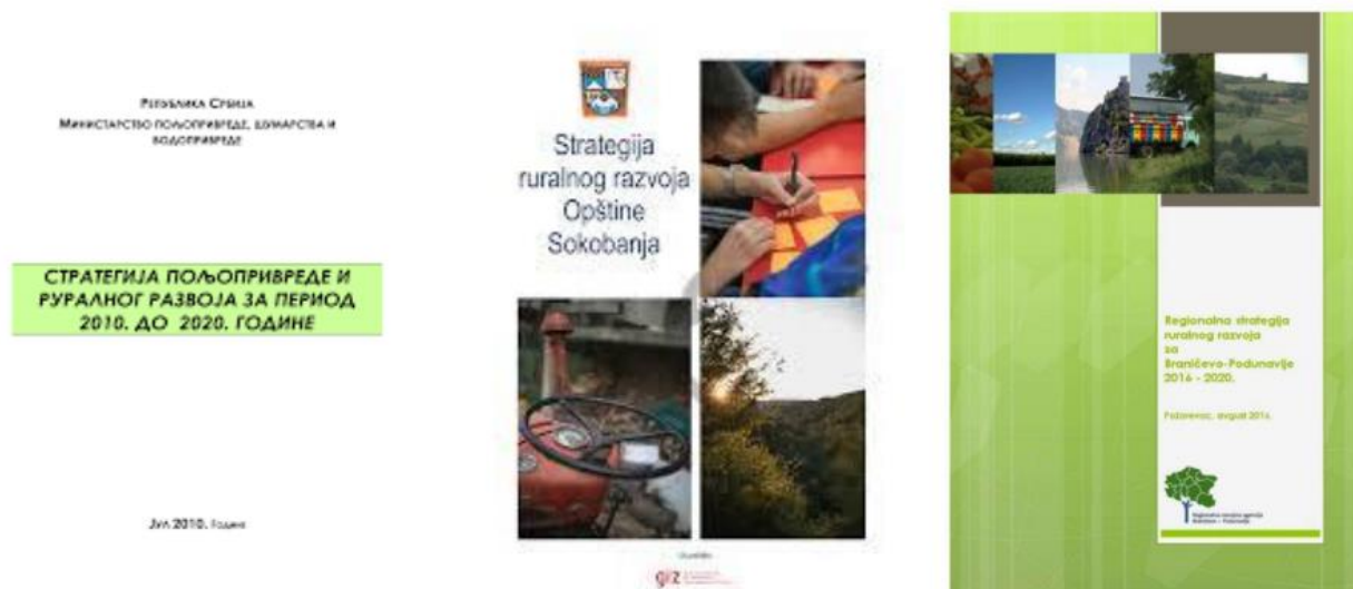
Слика 2: Стратегии за рурален развој на национално, регионално и локално ниво