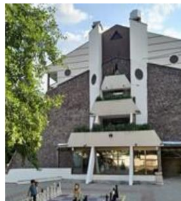
Слика 8в: Хотел „Радан“ во Пролом Бања