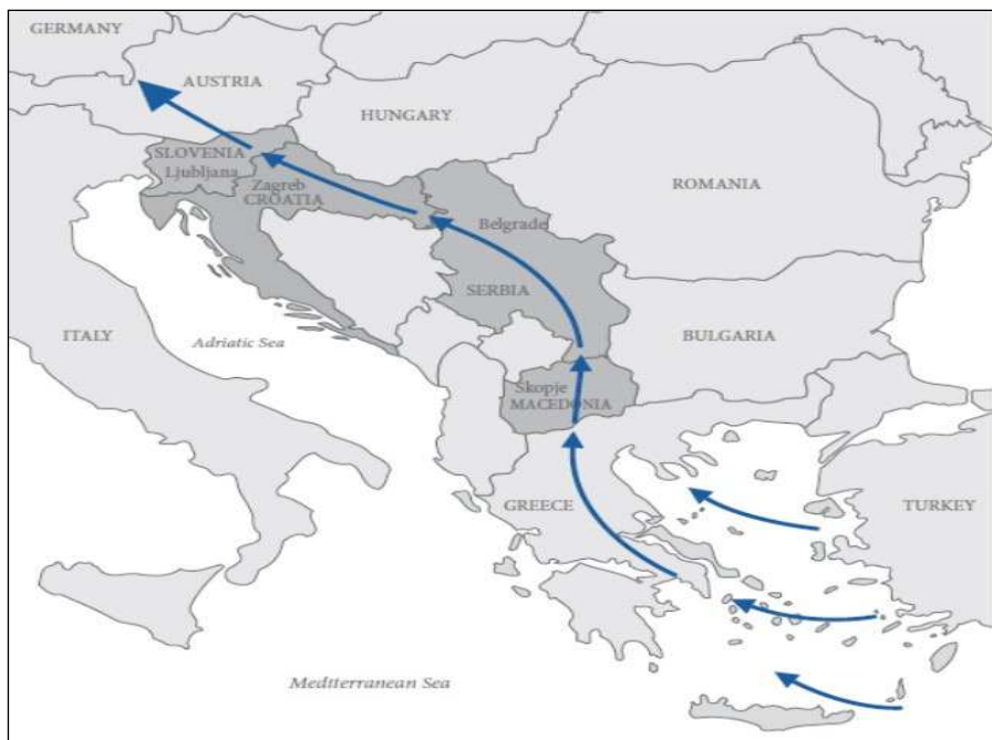
Слика бр. 1. - Карта на Источно-медитеранската и Балканската рута, на вратата од Европа