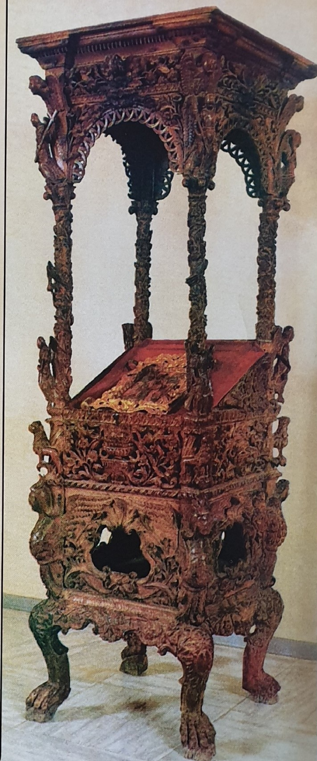
ЦЕЛИВАЛНА од Црквата „Св. Спас“ - Скопје 1824 година димензии: 2,60 x 0,65 м

Комплетна компјутерска обработка и печат: МНИП „РАСТЕР“ - Прилеп Тел./факс: 098/35-694, 35-993