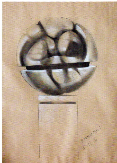
Нацевски Ангелитар „Форми I“, 1986 год, молив на хартија, 170x120см, Колекција НГ