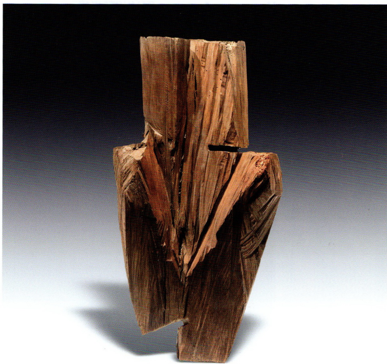
Николовски Борис „Фигура“, дрво, 45x30x20см