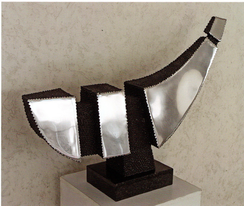
Милошевски Слободан „Патувачки рефлексии“, тех. метал, 77x57x18 см., 2020 год.