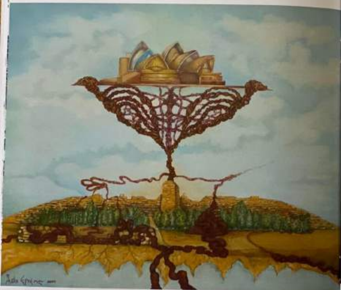
Дело бр. 3. Биокинетична конекција (Штип – Sydney), 2009 год.