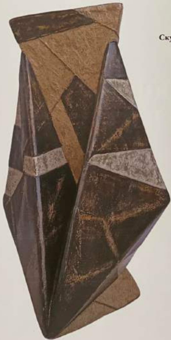
Скулптурно дело „Исар“