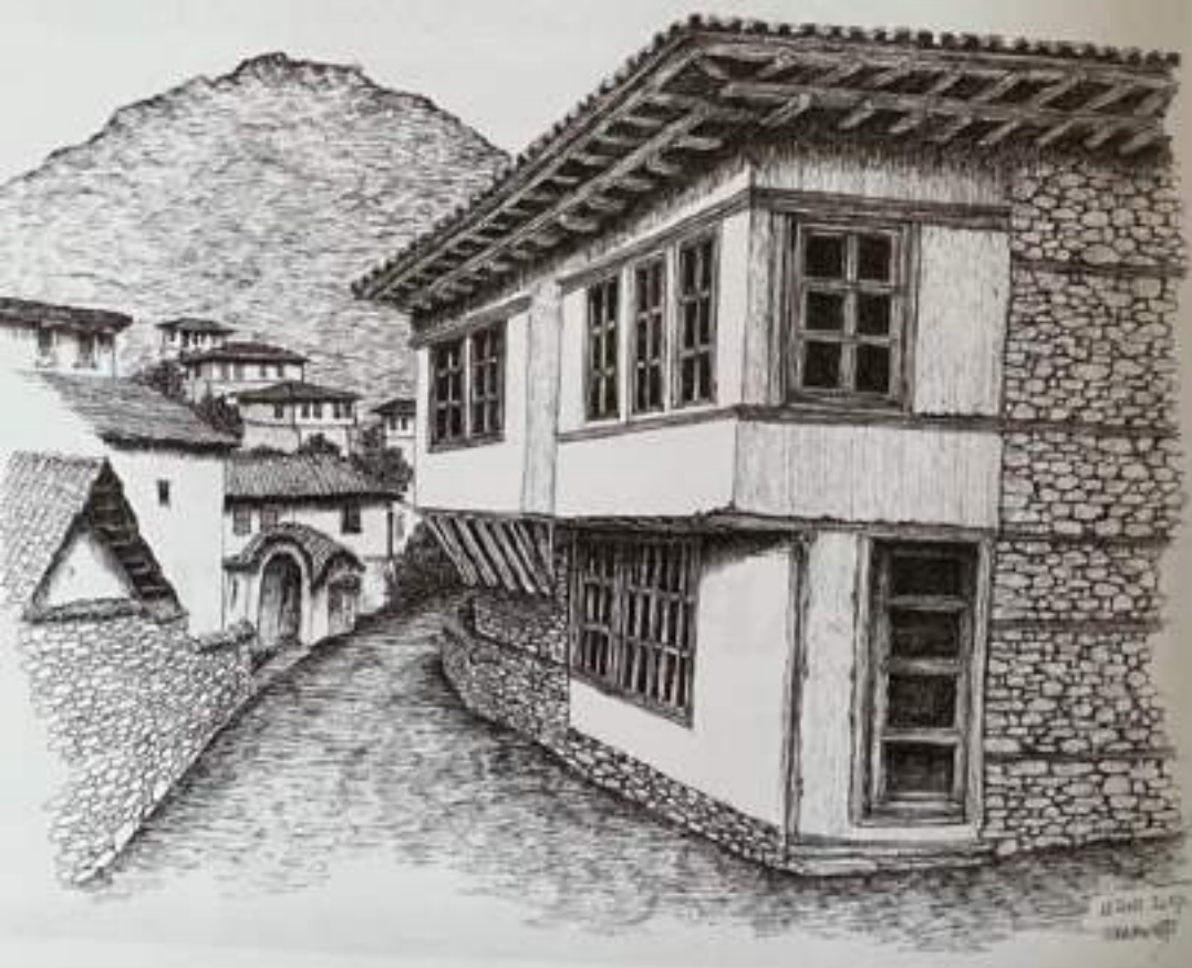
Сл.1. Изглед на градска куќа со затворен чардак, Штип, 19 век