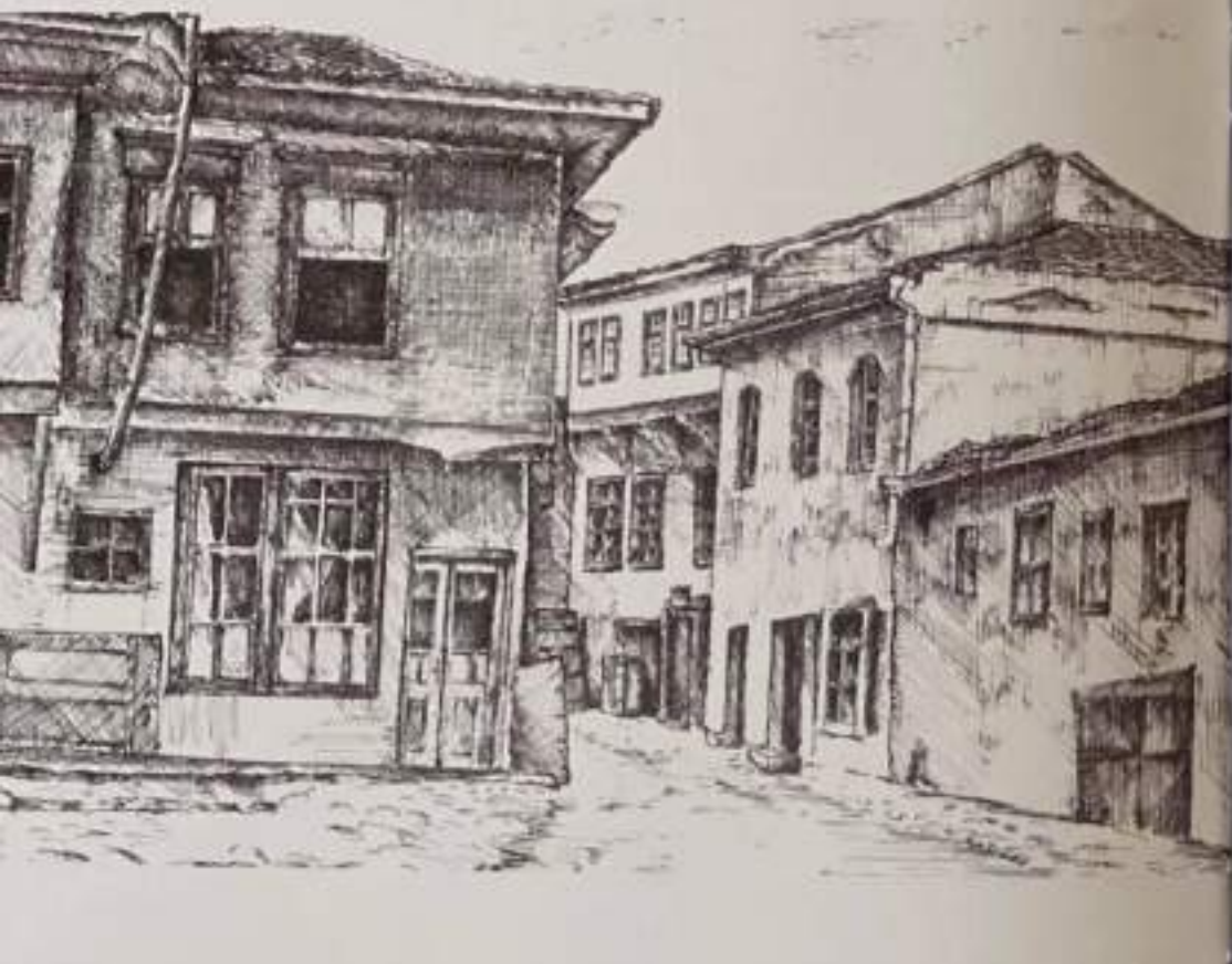
Дело бр. 1. „Мотив од Еврејското маало - Штип“ – 1997 год. 50x70см. Техниката: туш, перо и четка