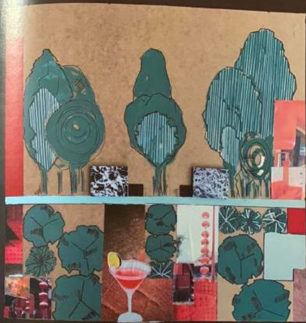
Сл.2: Композиција 2