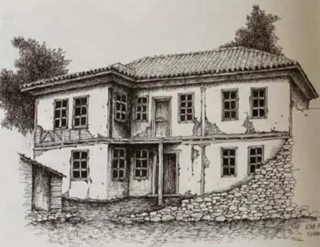
Сл.3. Изглед на градска куќа со затворен чардак, Штип, 19 век