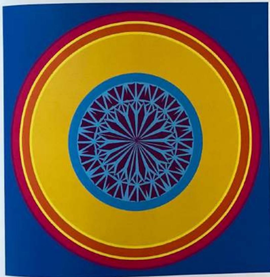
IV МАНДАЛА: КРИСТАЛ СПОРЕД БОГДАН БОГДАНОВИЌ