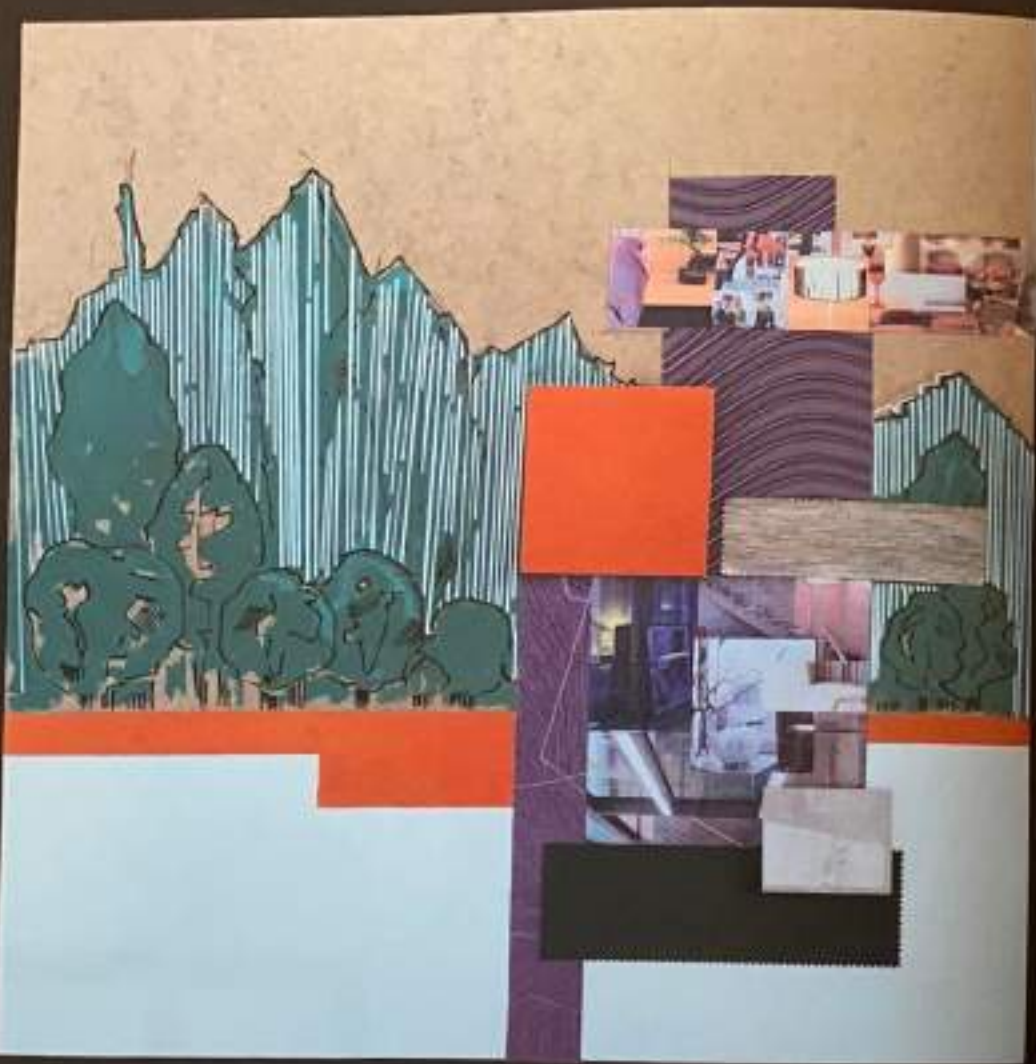
Сл.1: Композиција 1