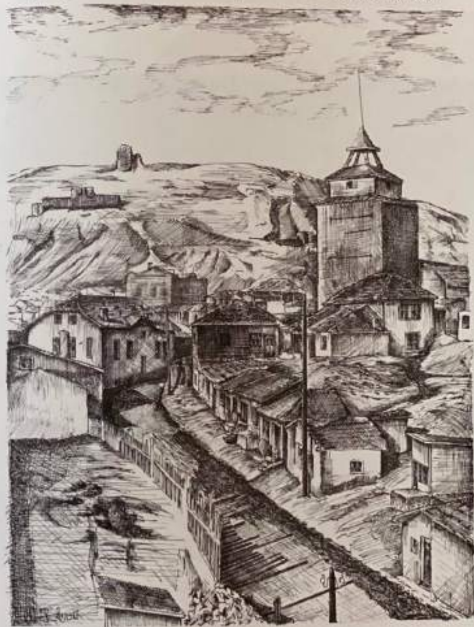
Дело бр. 2. „Мотив од стар Штип“ – 1997 год. 50x70см. Техниката: туш, перо и четка