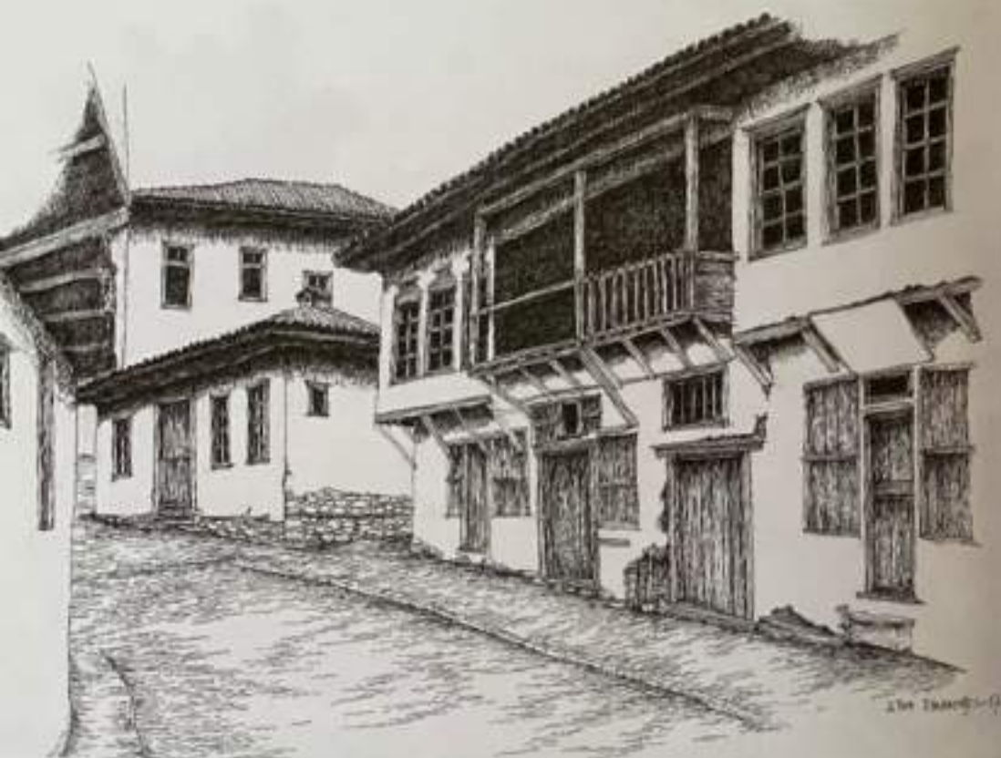
Сл.5. Изглед на градски куќи со дуќани, Штип, 19 век