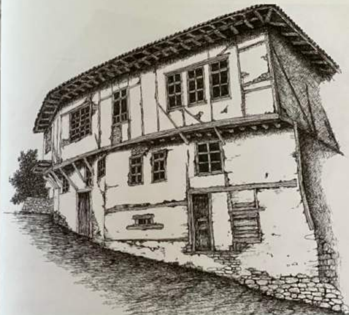
Сл.6. Изглед на градска куќа, Ново село, Штип, 19 век