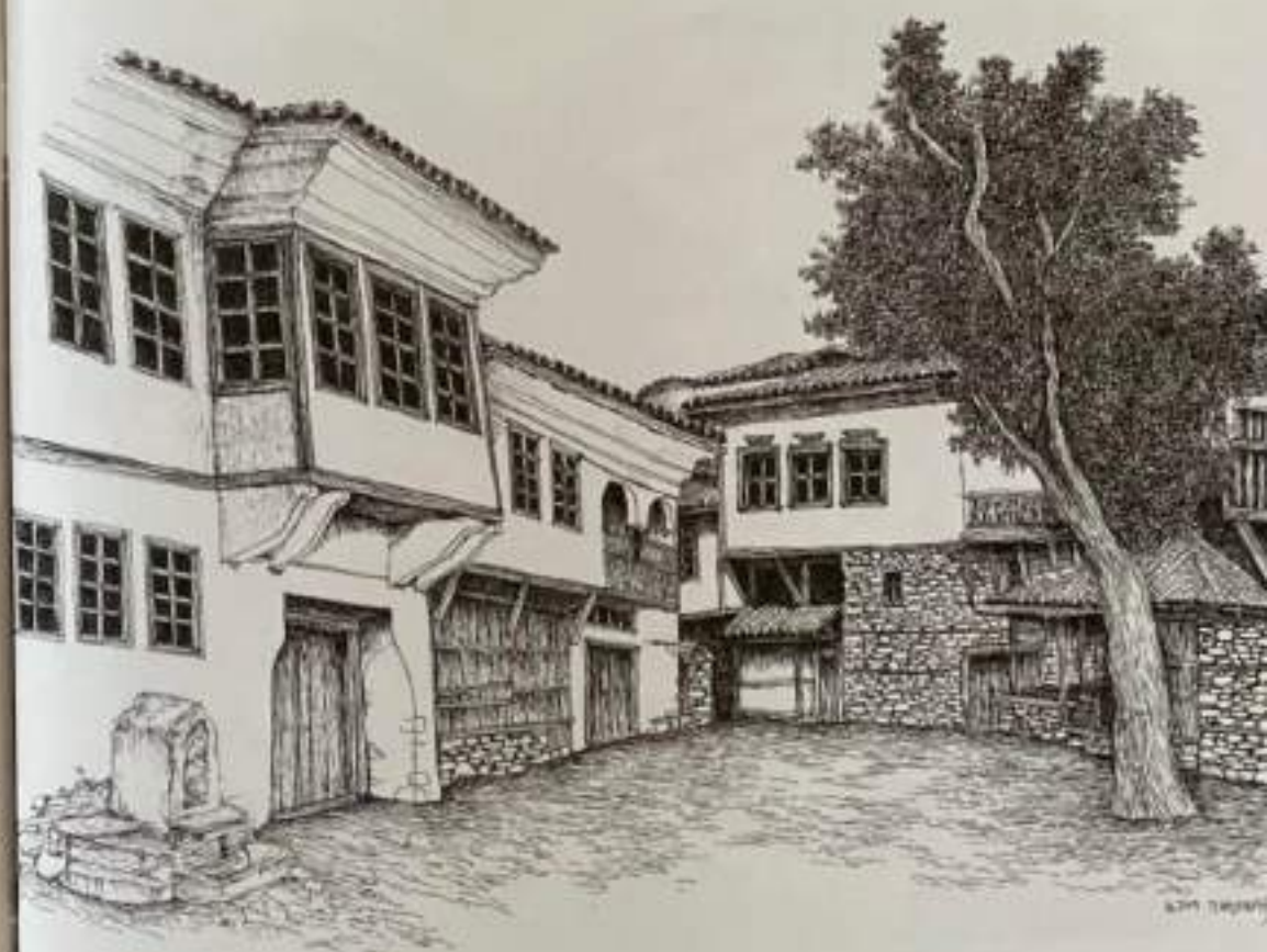
Сл.4. Изглед на градски куќи со дуќани, Штип, 19 век