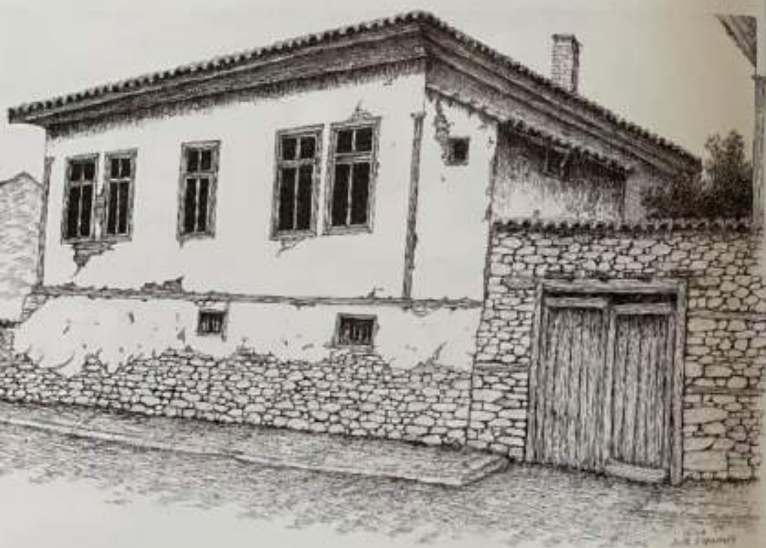
Сл.9. Изглед на градска куќа, Штип, 19 век