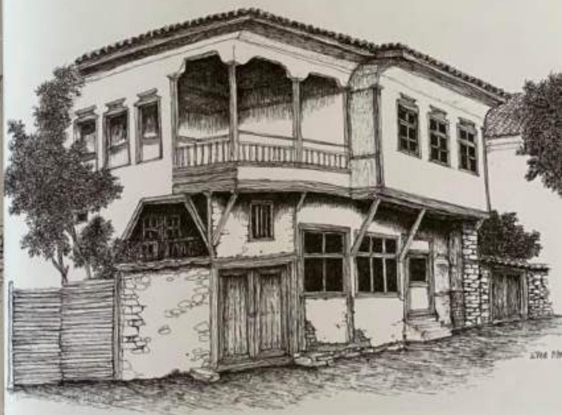
Сл.10. Изглед на градска куќа со чардак, Штип, 19 век