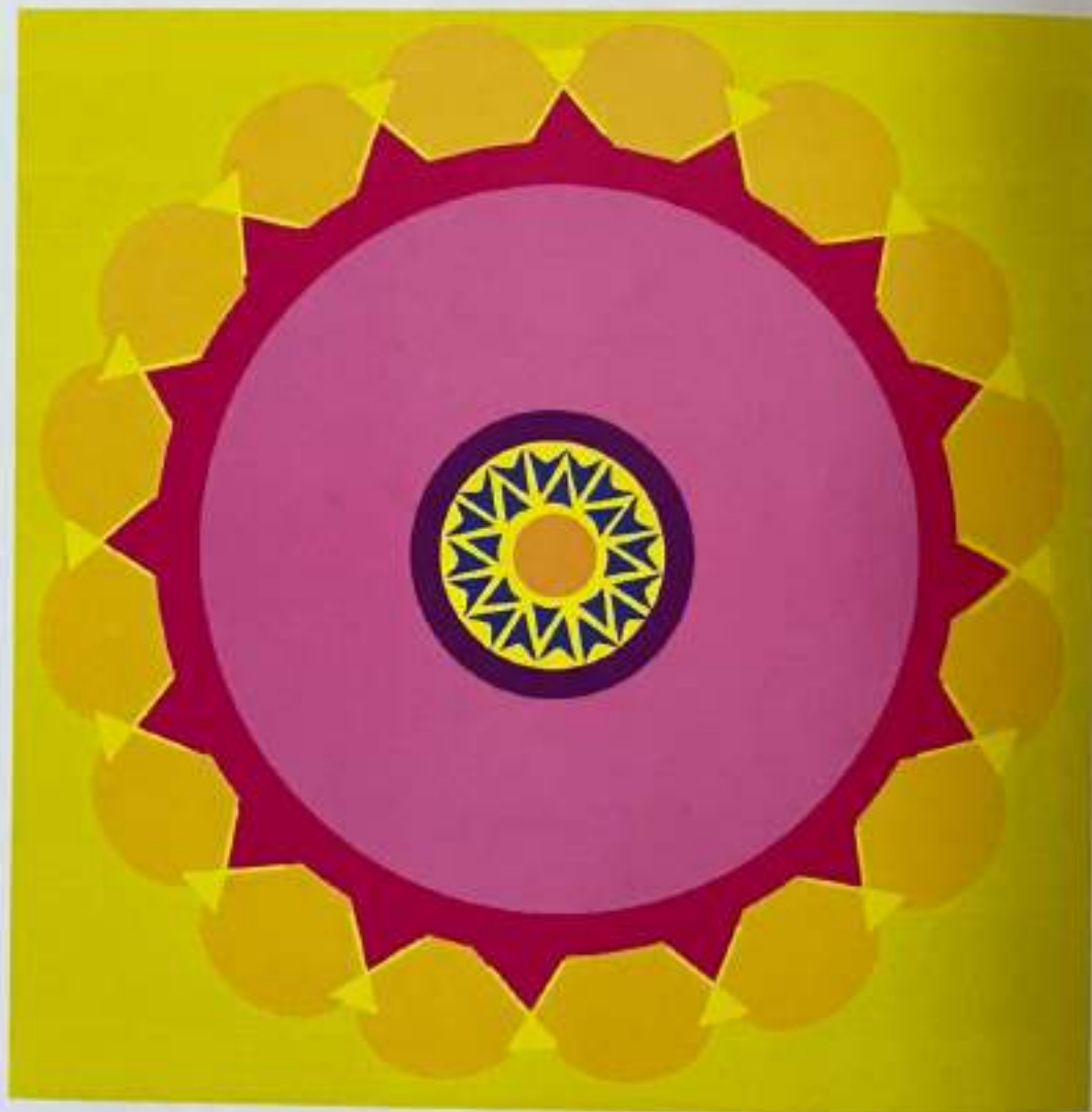
IV МАНДАЛА: СОНЦЕ СПОРЕД БОГДАН БОГДАНОВИЌ