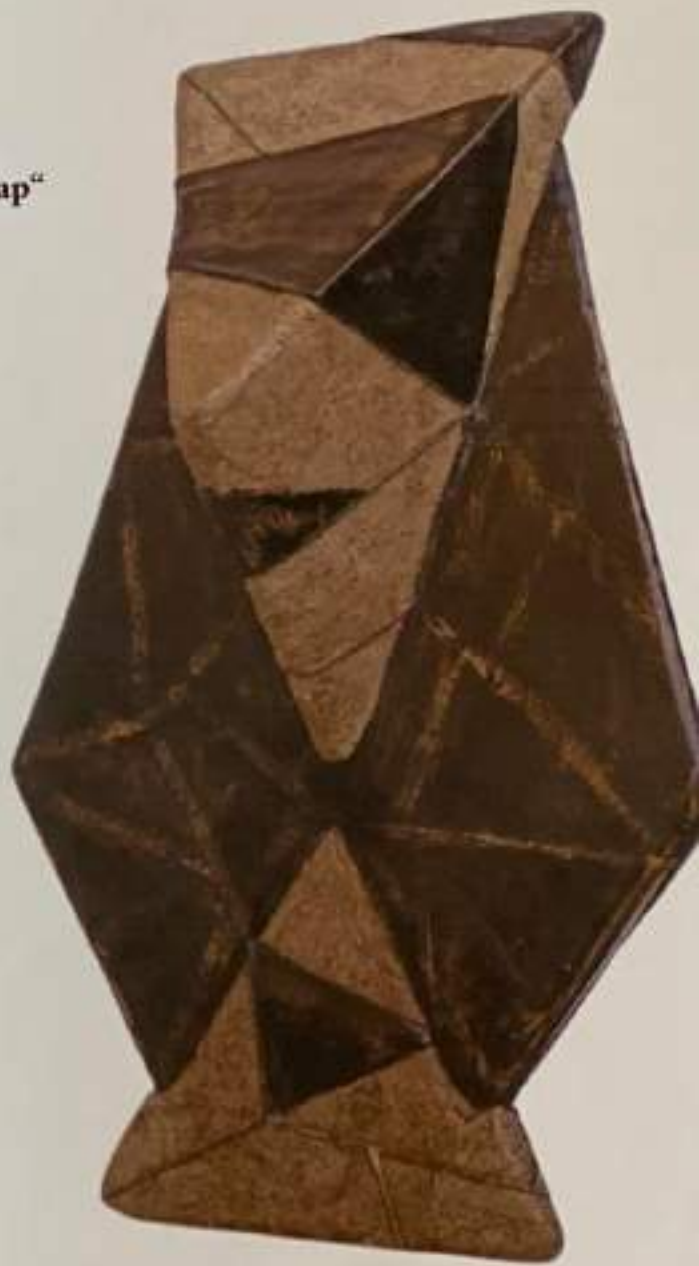
Скулптурно дело „Исар“