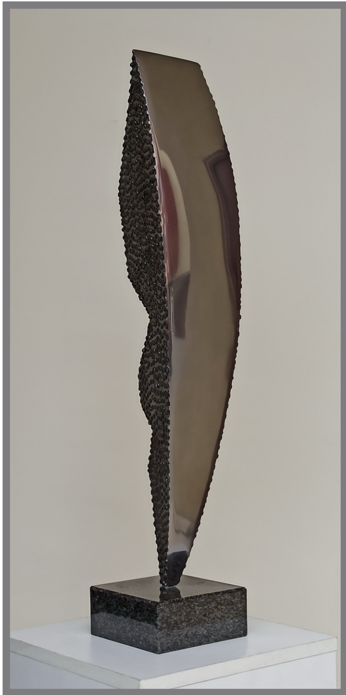
„Човечка мисла” “Human thought” 65,5x12,5x17,5cm.