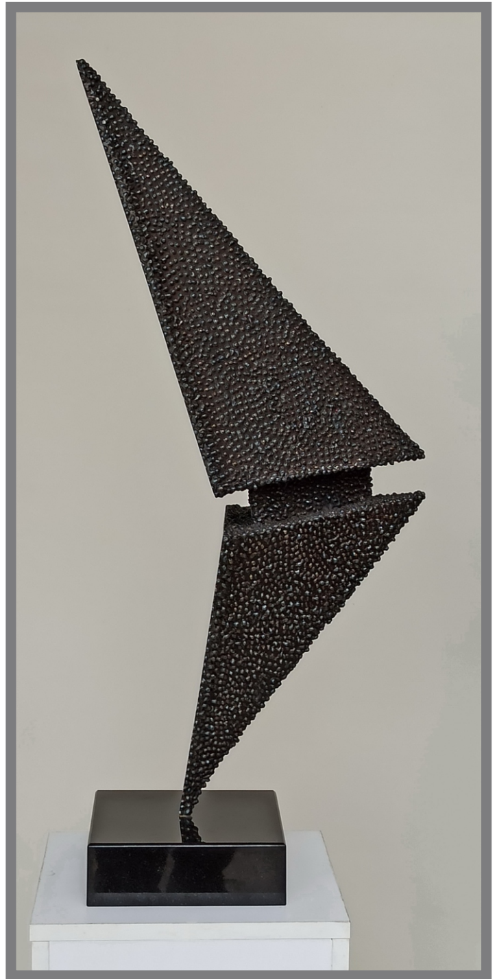
„Метафизичка модификација” “Metaphysical modification” 76x28x36cm.