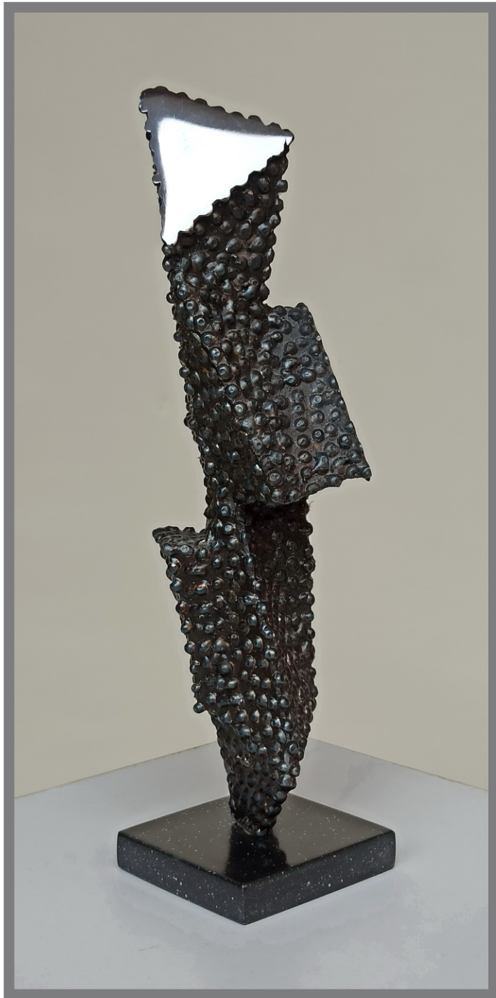
„Будење” “Awakening” 30,5x10,5x9cm.