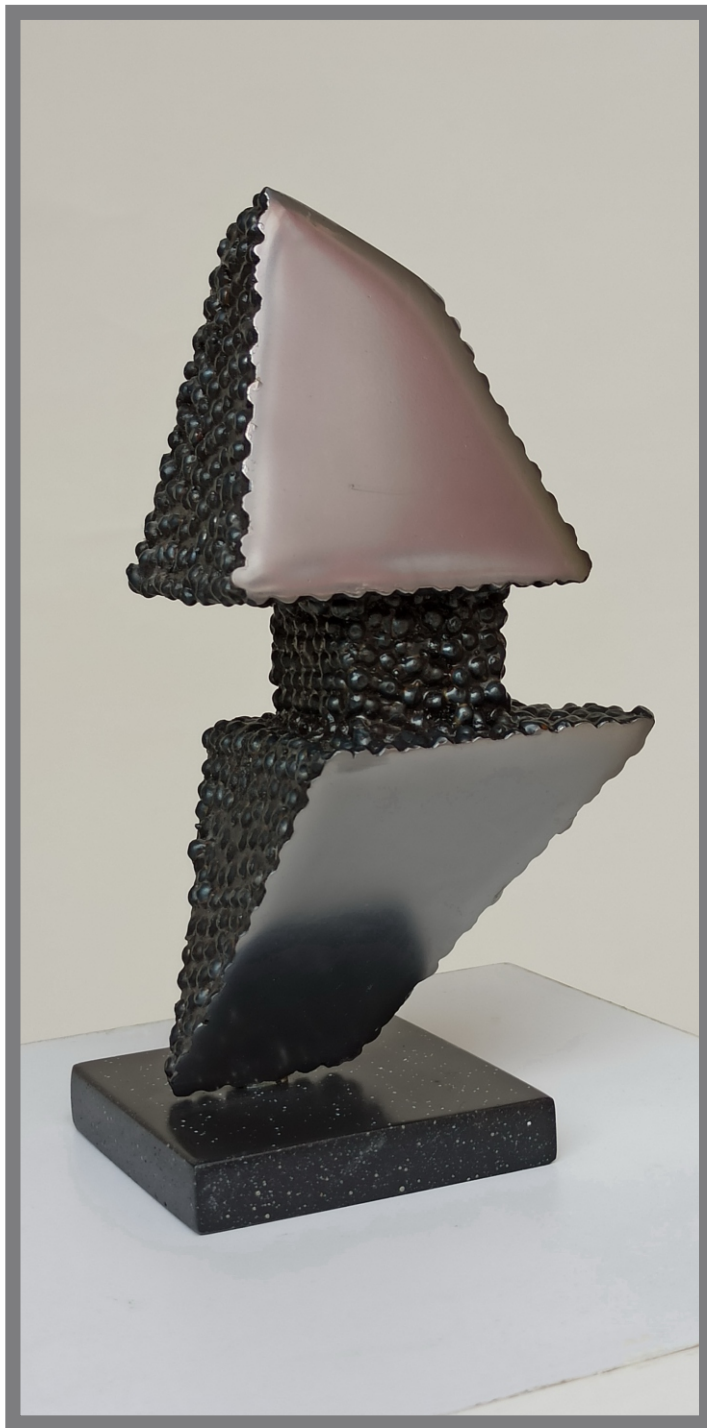
„Пловидба” “Sailing” 23x12,5x9cm.