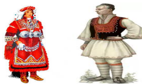
Слика 1. Мариовска женска и машка народна носија.

Како најпозната е Мариовската (женска) носија која е меѓу колоритно најбогатите Македонски народни носии. Интересен е податокот дека невестинската Мариовска носија тежи околу 48 килограми. Мариово како област изобилува и со народно творештво особено со народни песни, митови, легенди и преданија, а огромен дел од нив се запишани во книгите на Марко Цепенков. Исто така мариовскиот живот и случувања се најголем мотив во делата на македонскиот писател Стале Попов кој е родум од Мариово. Областа Мариово е и туристичка атракција, која привлекува со големите изобилства на митови во кои е опишувана. Мариово е област која е позната и по народните приказни. Според народните приказни наводно во Мариово живеел Итар Пејо, големиот мудрец. Тоа е дело на македонскиот писател Марко Цепенков.