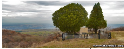
Слика 3. Гробот на војводата Ѓорѓи Сугарев.