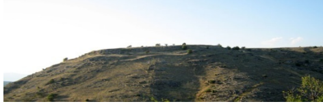
Слика 7. Остатоци од Тврдината Пешта.

Еден од символите на Македонскиот непокор - Тврдината Пешта, се наоѓа на 52 км., од Битола, помеѓу селата Градешница и Старавина. Тврдината Пешта е поврзана со приказната за Калеш Анѓа, мариовска девојка со челична волја спремна и по цена на својот живот да ја зачува својата вера и да не се предаде на прилепскиот кадија.