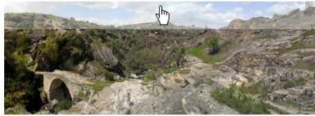
Слика 4. Камениот мост во с.Зович.