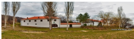
Слика 2. Манастир Св.Ѓорѓи кај с. Паралово.

Во близина на с. Паралово се наоѓа манастирот Св.Ѓорѓи – еден од најубавите во овој крај, надалеку познат по своите конаци. Во овој манастирот се верува дека е скриен еден од прст на раката од Св.Ѓорѓи.