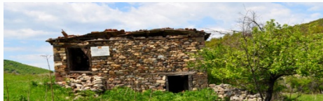
Слика 5. Родната куќа од Стале Попов во ц. Мелница.

Родната куќа на познатиот писател Стале Попов е сместена во близина на една од најпознатите Македонски цркви – Св. Илија, во веќе иселеното Мариовско село Мелница. И самата куќа се наоѓа во очајна состојба, оваа куќа претставува единствен показател за некогашниот живот во ова село.