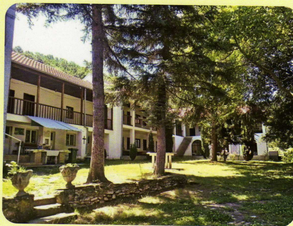
Конаците на манастирот „Св.Горги“ - Паралово, каде е одржана Првата Пелагонска културно научна средба