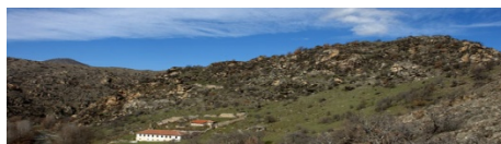
Слика 8. Чебрен - Манастирскиот комплекс во Мариово.

Во минатото манастирскиот комплекс Чебрен бил еден од најбогатите и најпознатите во Мариово и пошироко. Неговата поволна стратешка позиција и фактот што во Мариово за време на турското владеење немало исламизација на населението, го направиле еден од најбогатите во Македонија.