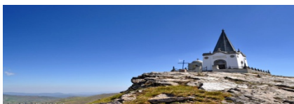
Слика 11. Спомен обележје на Врвот Кајмакчалан на планината Нице. Црквата од 1928г., и костурницата.