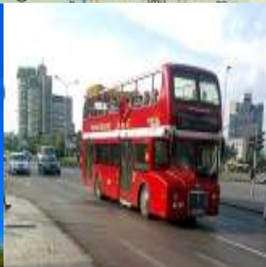
Штип, 2021 г.