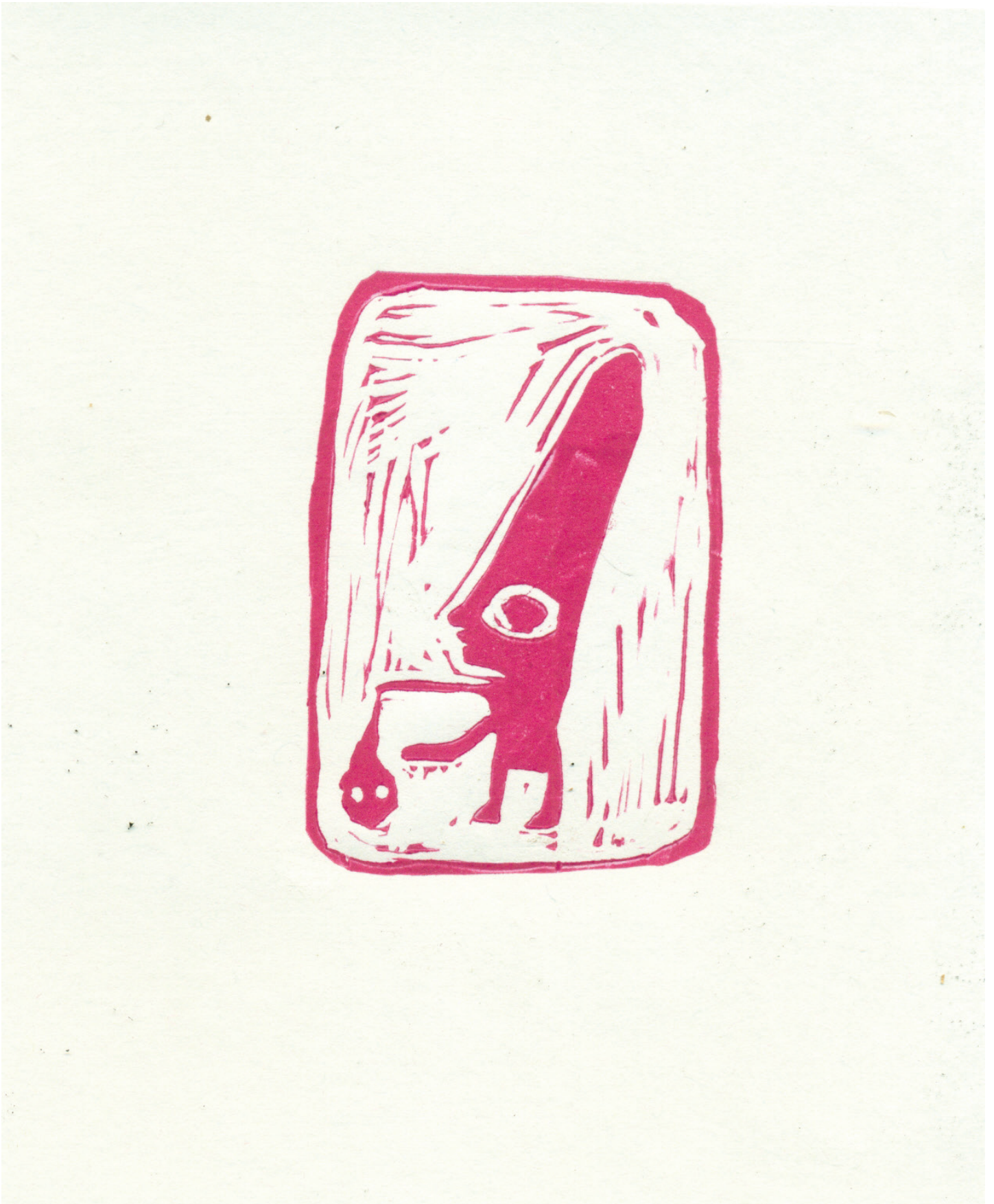
Филип Велковски - Pink Vomit, Линорез, 15 x 10 см, 2019

"Just for the record, being smeared with shit and naked in the wilderness, spattered with pink vomit, this does not necessarily make you a real artist."