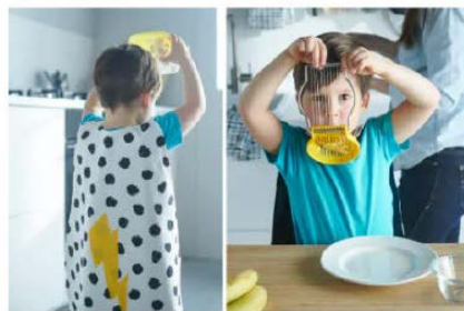
Kuhinjski pomocnik pristize u pomoc