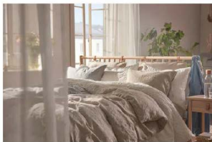
Prirodan put do udobne spavaće sobe