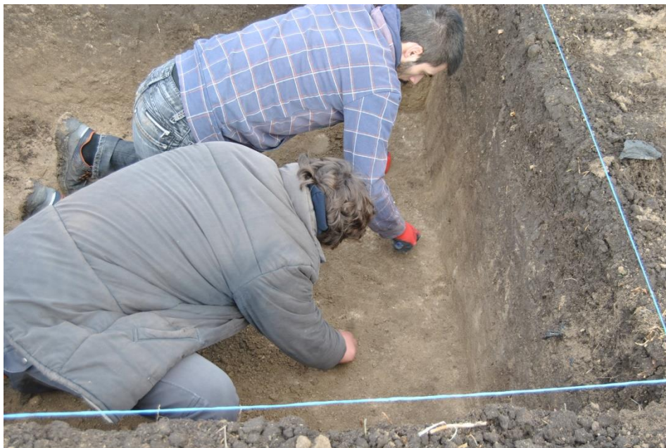
Сонда 1 во текот на истражувањето