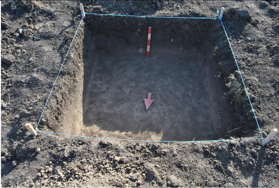
Сонда 1 по завршувањето со археолошкото истражување