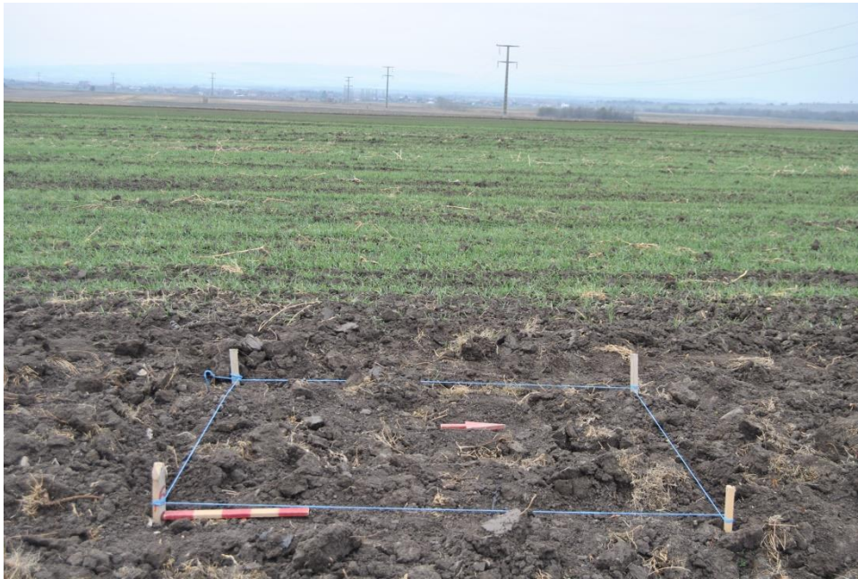
Сонда 1 пред отпочнување со работа