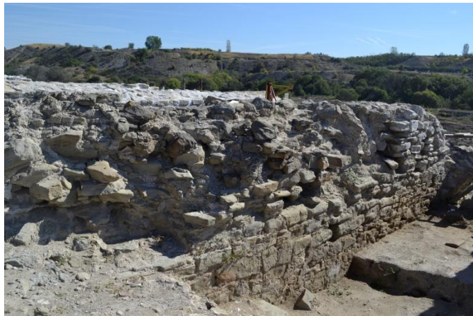
Радијален сид 18, пред конзервација