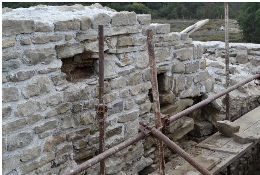
Радијален ѕид 21 по отстранувањето на оштетените камења од лицето на ѕидот