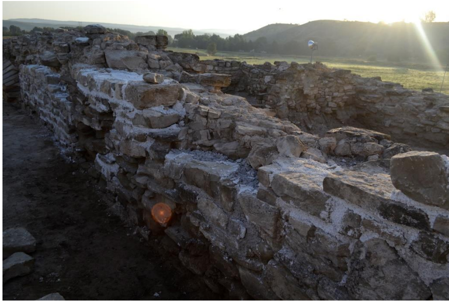
Радијален сид 28 во текот на конзервацијата