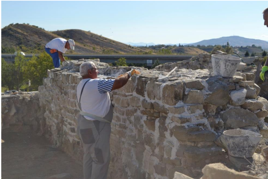
Радијален сид 18, во фаза на затварање на фугите по конзервацијата