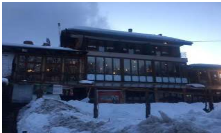
Figure 3. Orphange tower - Prevala

Prizren. This authorization does not include any construction criteria, moreover conditions like underground infrastructure, roads, water system, canalization, road electrification and other factors that do not contribute to the good image of the tourist village.