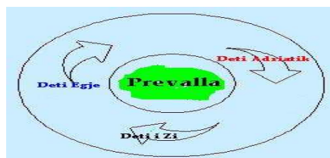
Figure 1. Wind flow in Prevala

Except for its beauty, this place has other healing qualities as it was mentioned above under the influence of air currents. Air currents from the Black sea through Iber river, then the Aegean sea through Lepenc river, as well as the air currents from Adriatic sea through Lumbardh river, create a specific climate in Prevala, by making conditions for healing different diseases, chronical and acute ones.