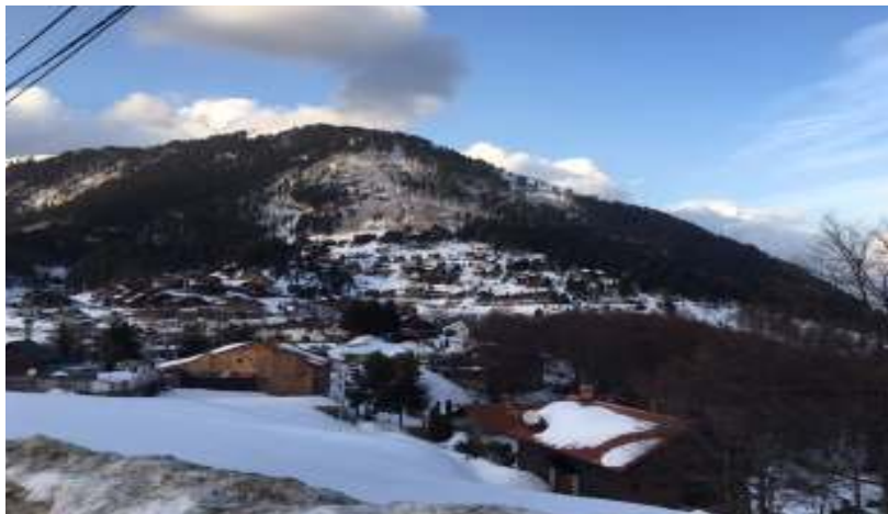
Figure 2. Turist village Prevala

According to the map of National park Sharr, includes only 1% (as mentioned above) of the total amount of the area, this division is made according to the eco-diversity values. Prevala is known as the Balkan's pearl.