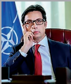
Претседател на Република Северна Македонија д-р СТЕВО ПЕНДАРОВСКИ

Еден од најдобрите начини да се разбере еден народ е да се слуша неговата музика. Преку нејзините партитури може да се следи траекторијата на развојот на културата и општеството, вредностите и вкусовите, но и минливото и трајното во човекот. Музиката ни помага подобро да се разбереме себеси и другите. Повеќе од четири децении, Сојузот на композитори на Македонија СОКОМ и фестивалот „Денови на македонската музика“ овозможуваат на публиката токму такво незаборавно искуство.