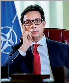
Претседател на Република Северна Македонија д-р СТЕВО ПЕНДАРОВСКИ

Еден од најдобрите начини да се разбере еден народ е да се слуша неговата музика. Преку нејзините партитури може да се следи траекторијата на развојот на културата и општеството, вредностите и вкусовите, но и минливото и трајното во човекот. Музиката ни помага подобро да се разбереме себеси и другите. Повеќе од четири децении, Сојузот на композитори на Македонија СОКОМ и фестивалот „Денови на македонската музика“ овозможуваат на публиката токму такво незаборавно искуство.