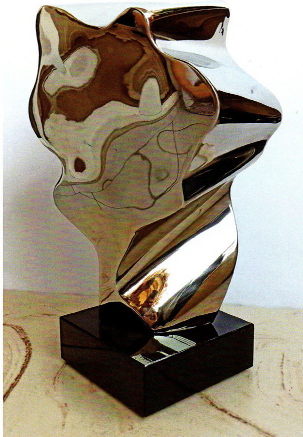
Слободан Милошевски „Запознавајќи се себеси“, инокс, 45,5x26x25 см, 2020 год.