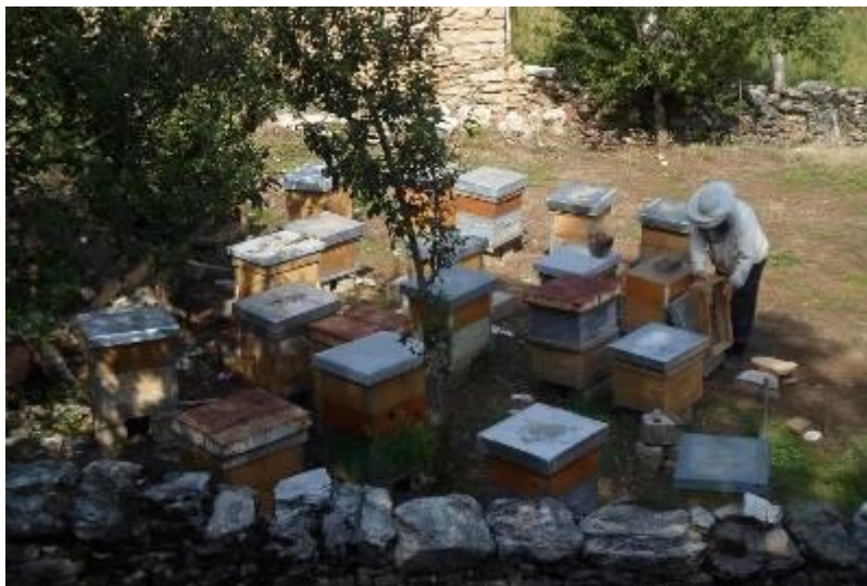
Слика 1. Пчелар со своите пчелни семејства

Името на населбата Бабино се споменува и во Слеченскиот кодик од XVI век.