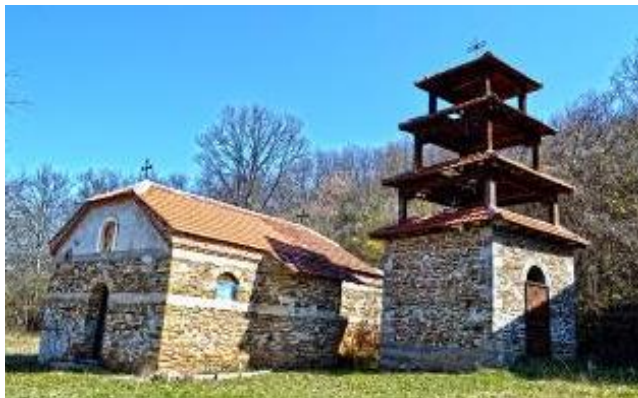
Слика 47. Манастир Св. Апостол Тома

Во селото училиштето е затворено во 2008/9 година. Во селото има две продавници. Најголем број од иселениците се во Битола, Скопје и други градови, како