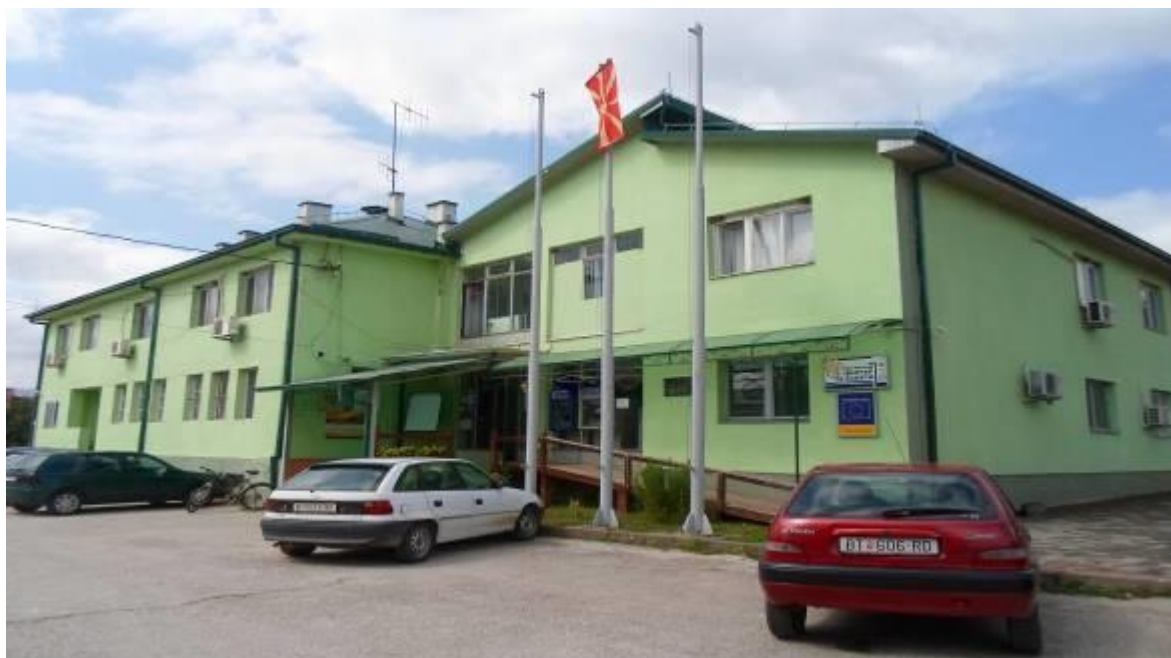
Слика 49. Општина Демир Хисар

Во бројот за население и населби за Општина Демир Хисар за 2002 година се ставени и селата Велмевци, Кочиште и Растојца кои во претходните пописи биле во рамките на општините Кичево, па потоа на Другово (Велмевци) и Крушево (Кочиште и Растојца). Во територијалниот опфат на општина Демир Хисар егзистираат 40 населби или месни заедници и еден град или урбана заедница. Во 1948 година Општина Демир Хисар имала 20.011 жители, од кои во центарот Демир Хисар живееле 543 жители или само 2,7% од вкупното население. Во 2002 година, Општината имала вкупно 9497 жители, од кои Македонци 9179 (96,6%), Албанци 232, Турци 35, Роми 11, Власи 7, Срби 13, Бошњаци 2 и Останати 18 лица. Во градот Демир Хисар живееле 2593 жители (27,3% од вкупното општинско население), од нив 2473 Македонци (95,4%), 62 Албанци, 22 Турци, 11 Роми, 7 Срби, 6 Власи, 2 Бошњаци и 10 Останати лица.