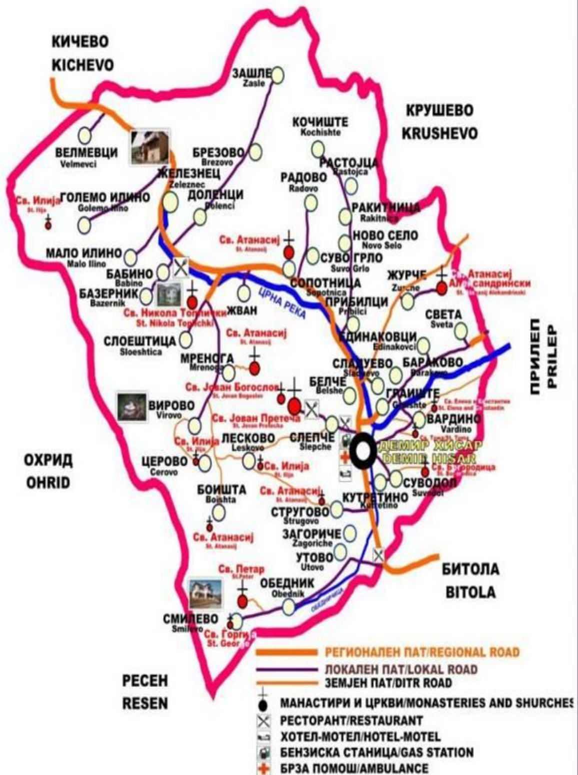
Карта 6. Познати верски и други објекти во Општина Демир Хисар