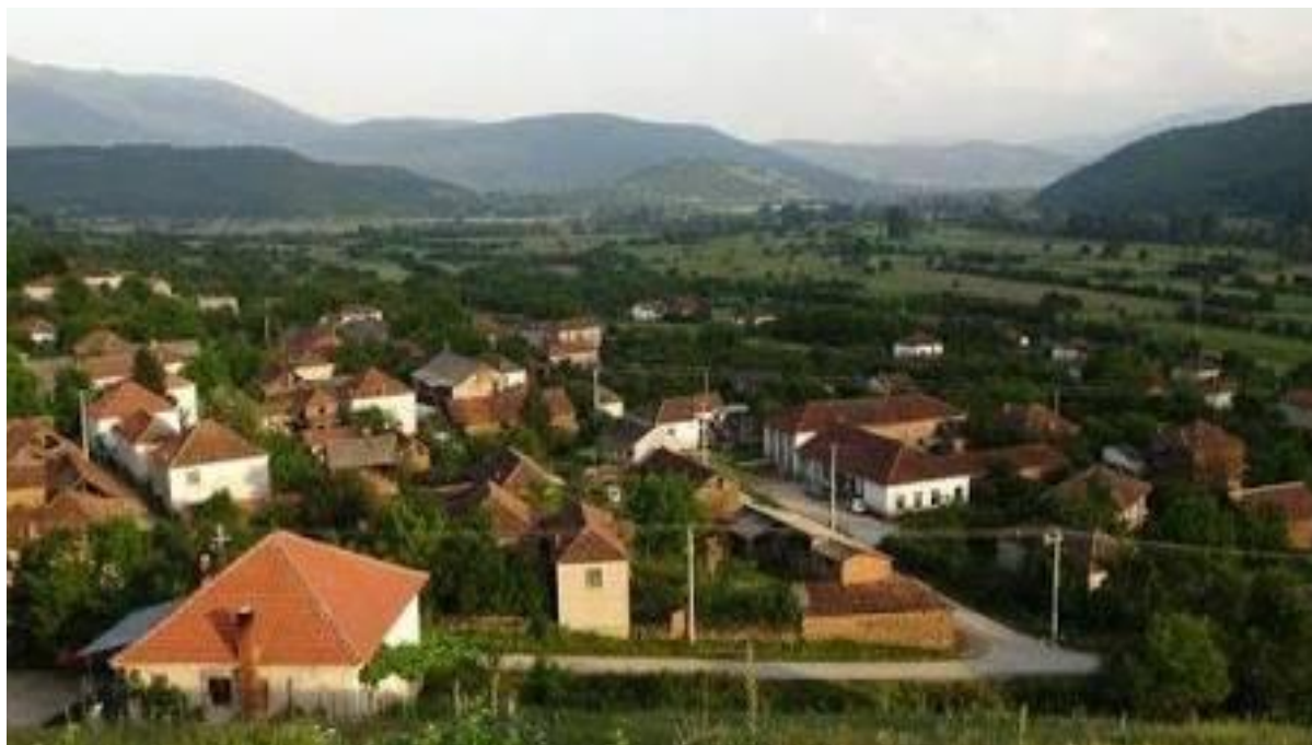
Слика 115. Панорама на Прибилци

Се вкупно во Прибилци имало 35 семејства, 5 неженети и 4 вдовици, или 39 семејства и 5 неженети. Изразено во жители бројот изнесувл 196 лица. Жителите плаќале данок во висина од 1.202 акчиња од кои поголем дел за испенце, што значи населението било македонско со христијанска вероисповест.