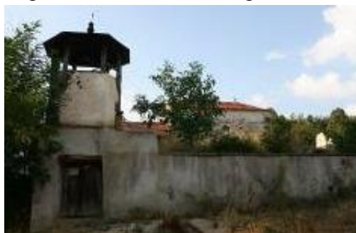
Слика 124. Црква Св. Димитриј

Црква Св. Димитриј – во основа претставува еднокорабна градба со тристрана апсида. Покриена е архитравно има таваничка од штици (најпрво била покриена со свод. Црквата има историско – уметнички карактер и важност за македонското фреско сликарство и начинот на градењето на храмовите. Сидана е со кршен камен и делкан бигор кој е употребен на венецот. Црквата е покриена со ќерамиди и камени плочи над апсидата. Во внатрешноста има галерија, додека на западната страна е поставен трем. Според сочуваниот живопис црквата припаѓа на поствизантискиот период (XVI и XVII век), Во XIX век биле направени значителни поправки. Од постариот живопис само делот во олтарниот простор.