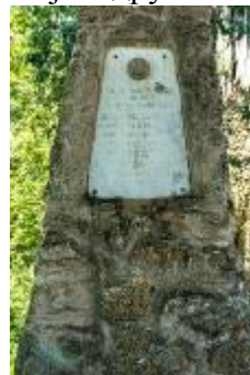
Слика 123. Споменик на паднатите борци од НОБ

Црква Св. Димитриј – во основа претставува еднокорабна градба со тристрана апсида. Покриена е архитравно има таваничка од штици (најпрво била покриена со свод. Црквата има историско – уметнички карактер и важност за македонското фреско сликарство и начинот на градењето на храмовите. Сидана е со кршен камен и делкан бигор кој е употребен на венецот. Црквата е покриена со ќерамиди и камени плочи над апсидата. Во внатрешноста има галерија, додека на западната страна е поставен трем. Според сочуваниот живопис црквата припаѓа на поствизантискиот период (XVI и XVII век), Во XIX век биле направени значителни поправки. Од постариот живопис само делот во олтарниот простор.