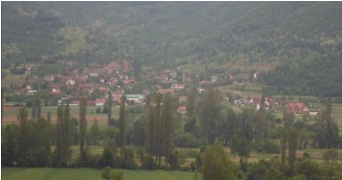
Слика 23. Панорама на Вардино

Во 1900 година Вардино имало 200 жители, во 1914 година 406 жители, во 1925 г. 465 ж., и во 1931 година точно 500 жители. По Втората светска војна, Вардино во 1948 година имало 802 жители, за потоа во 1953 г., како резултат на миграција, бројот на жители да се намалил на 692 ж., на 543 ж., во 1961, па 491 ж. во 1971 г., односно на 419 ж. во 1981 г. и на 327 жители во 1994 година.