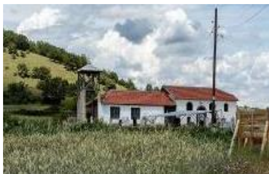
Слика 114. Црква Св. Богородица