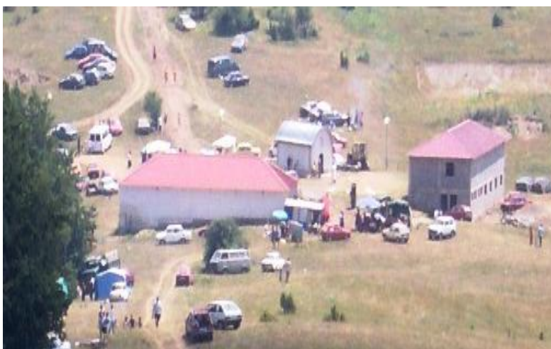
Слика 46. Манастир Илинска Црква

Манастир Св. Илија е изграден 1990 година. Се наоѓа високо на падините на Илинска Планина над селото Големо Илино и Мало Илино. Сместен е на надморска височина од 1544 метри на зарамнетиот дел на планинскиот превој и на самата граница помеѓу општините Демир Хисар и Дебарца. Секоја година на Илинден се одржува голем црковен – народен собор и прослава со многубројни посетители до селата Големо Илино, Мало Илино, Брежани, Велмевци и други села од Демихисарско, Дебарца и од други места. Манастирот, покрај црквата го сочинуваат и два конаци.