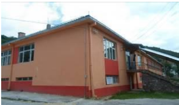
Слика 69. ОУ „Браќа Миладиновци“

Во 1961 г. селото броеше 904 ж., додека во 1994 г. бројот се налил на 506 жители, во 2002 спаднал на 428 жители. Во 2015 г. селото брои над 300 жители. Бројот на иселени семејства изнесува околу 100. Најмногу иселени домаќинства има во Битола, Скопје, Кичево, Ресен, Охрид, Штип, Струмица, Радовиш и други места, а од странство во Австралија, Германија, Србија, Нов Зеланд, Шведска и други земји.