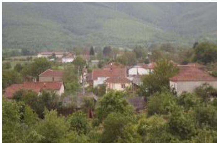
Слика 87. Панорама на Загориче

Географските координати на селото се: 41°11'12" N – северна географска широчина; и 21°11'45" E – источна географска должина. Загориче е оддалечено од Демир Хисар 6 км, додека од Битола 26 км. На исток и на север атарот им се граничи со Стругово, на југ со Утово непосредно блиско село, и дел со Лопатица преку некогашното село Чагор, на исток со атарот на с. Крагуј - некогашни села, (сега раселени) 73 , и со село Кутретино.