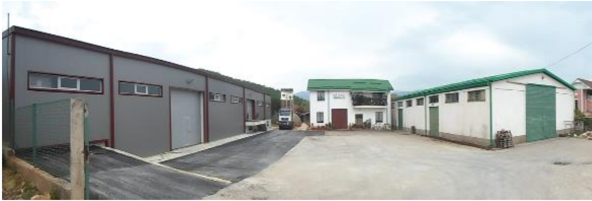
Слика 24. Пржилница за кафе „Пела кафе“

Во селото има и споменик на паднатите борци во НОБ.