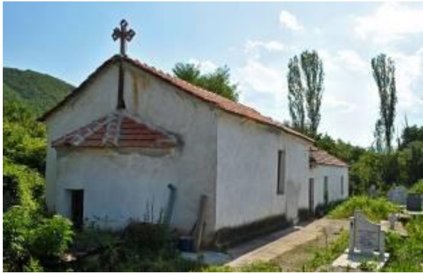
Слика 27. Црква Св. Никола

средината, е голема и претставува триконос со нартекс и има релативно големи димензии. Сидана е со кршен камен во варов малтер. На источната страна има сидови кои се високи повеќе од 2 м. Во црквата, во 1981 г. не се сочувани остатоци од живопис или некој натпис по кој би се одредило времето на градбата и зографисувањето. Според основата и начинот на градењето се претпоставува дека црквата е изградена во периодот од 15 и 16 век.