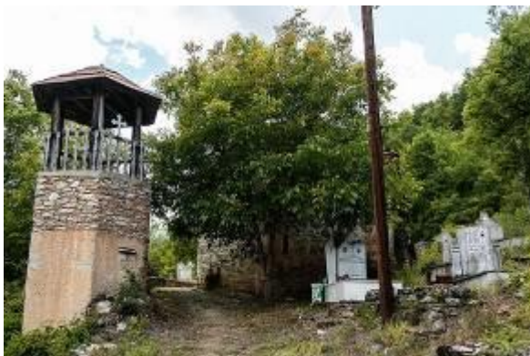
Слика 6. Црква Св. Никола

Христијански празник на селото е Св. Никола, летен 18 (02.06). Тогаш на сретсело се собира голем број народ. Секоја фамилија има своја куќна слава. На 8-ми јуни за време на „Духовден“ се одржува народен собир „Бабински средби“. Од Бабино има голема емиграција во странство и во македонските градови.