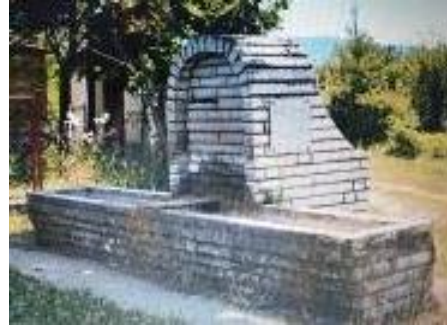
Слика 188. Обновена чеиша

Во селото има една црква Св. Петка и Манастир св. Илија. Селото го празнувало Илинден, и во Церово има црква – манастир посветен на пророк Св. Илија. Пророкот Илија живеел 900 год. пред Христа (роден 816 пр.хр. во местото Тесвит. Во државата владеел немир зашто царот Ахав бил многу нечесен и паган. Кога меѓу народот завладеал неморал пророкот Илија се помолил на Господа и три години дожд не заврнал и меѓу народот зафатил голем глад. Земјата испукала, изворите и реките секнале, а многу стока и луѓе изумреле. Народот се помолил на Пророк Илија и тој на Господа му се помолил па заврнал дожд. На Св. Илија многу елементи му се препишуваат од врховниот пагански бог на Словените – громовникот Перун. Илинден е аталија (строг) празник.