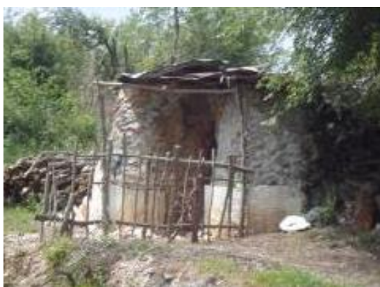
Слика 56. Варница

Од 1952 година селото има електрична енергија, во 1965 добива вода, а во 1973/74 година и асфалтен пат. Во селото има и јавна чешма.