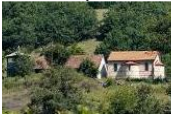
Слика 96 и 97. Споменик на паднати борци во НОБ и Црква Св. Никола