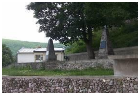
Слика 152. Споменици Илинден и НОБ

Од селото Смилево има голема емиграција во странство и градовите на РМ. Во Бугарија, конкретно во Софија има цела област со смилевци именувана „Смилевска падина“, во Битола исто така има „Смилевски баир“ – место каде граделе смилевците куќи за себе, помагајќи се еден со друг.