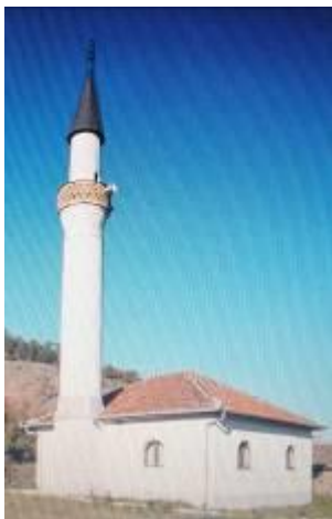
Слика 113. Цамија во Обедник