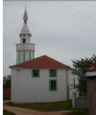
Слика 183. Џамијата во Суводол