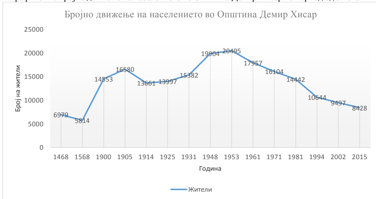
Графикон 1. Бројно движење на населението во Општина Демир Хисар во период од 5 века

Гледано по национална структура, низ сите пописи од 1953 до 2002 година во општината доминираат Македонците со над 96 % (Види Табела)