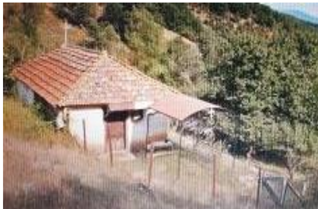
Слика 176. Црква Св. Богородица