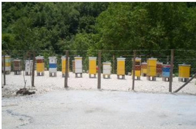
Слика 80. Сандуци за пчели

Според кажување на постари жители во 1960 година, во Железнец имало над 3000 овци и друг сточен фонд, а денес нема ниту една. Селото е електрифицирано до 1960 година, водовод има од 1983, а асфалтен пат, приклучок до селото од 1996 година. Во селото до пред дваесетина години работеше сушара, имаше еден магацински простор и продавница. Во селото има подигнато споменик на паднатите борци во НОБ.