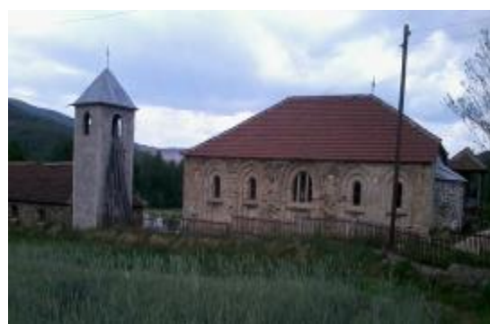
Слика 107 и 108. Црква Св. Спас – стара и нова црква