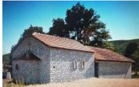
Слика 132. Црква Св. Илија

Празник на селото е Илинден. Во селото има една црква посветена на Св. Илија.