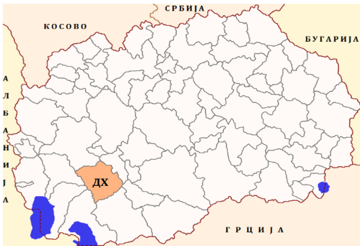
Карта 3. Местоположба на Општина Демир Хисар во Р.С.Македонија

Општина Демир Хисар има речиси природни граници на север се граничи со Општина Кичево, на североисток и исток со Општина Крушево, на југоисток со Општина Могила, на југ со Општина Битола, на југозапад со Општина Ресен, на запад со Општина Охрид и Општина Дебарца. (Види: Патна карта на општина Демир Хисар)