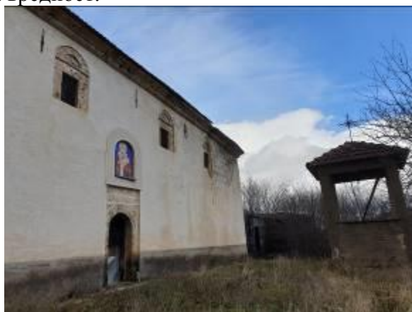
Слика 45. Црква Св. Никола

Црквата Св. Никола во Големо Илино е подигната на ридот, во непосредна близина на селото. Според написот на јужниот ѕид, црквата е изградена во 1824 година, а живописана во 1896 година од зоградот Серафим. Покривот е изработен од ќерамиди и е двоводен. Храмот, во основа, претставува еднокорабна градба, покриен со полукружен свод. Дел од покривот на западната страна и апсидата се покриени со камени плочи. На северниот и јужниот ѕид од внатрешната страна има пилистри поврзани со лакови во горниот дел. Фасадите од четирите страни се фугирани. Во последниве децении, на западната страна е дограден трем.