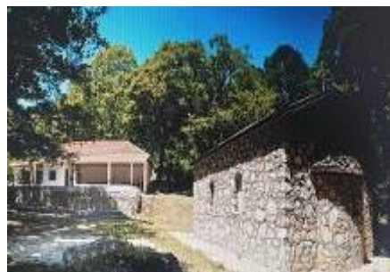
Слика 145. Црква Св. Никола Слика 146. Манастир Св. Ѓорѓи