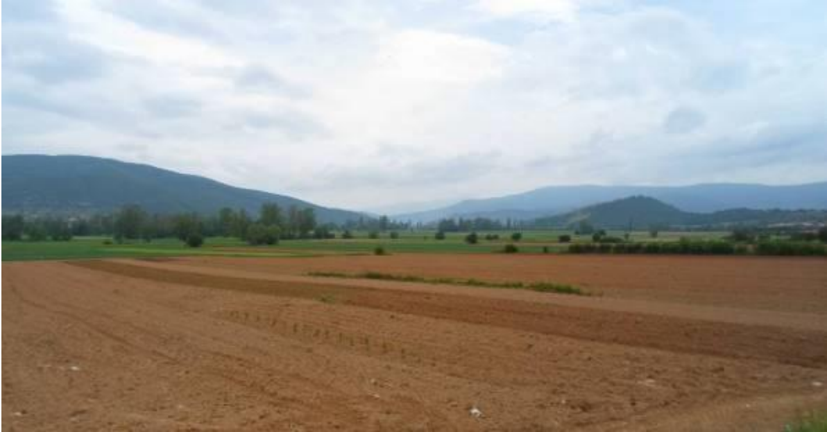
Слика 64. Демирхисарското Поле, гледано од село Единаковци