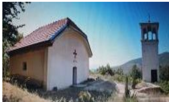
Слика 189 и 190. Црква Св. Петка и Манастир Св. Пророк Илија