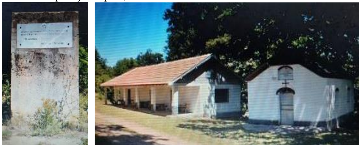
Слика 100-101. Споменик на паднати борци во НОБ и Црква – Манастир Св. Пророк Илија

Црква Пророк Св. Илија - Илиница – Старата црква се наоѓала во Долна Маала, заградена со ѕид заедно со селските гробишта и камбанаријата. Подигната е кон крајот на XIX век. Претставува еднокорабна градба со висок дрвен свод и полукружна апсида. На северниот дел и јужниот ѕид од внатрешната страна има декоративни пиластри кои продолжуваат како ребра на сводот. Сидана е од кршен камени делкан бигор на отворите и венецот. Покривот е двоводен, од керамиди и камени плочи над апсидата. Фасадите се фугирани. Во внатрешноста црквата е малтерисана и варосана нема живопис. На западната страна има трем на приземје и кат. Има наос, олтар заграден со штици и икона на влезот од пророк Илија. Објектот се наоѓа во запуштена и пропадната состојба. Во 1980 година е изграден нов објект црква – манастир Пророк Св. Илија. Покрај црквата има чешма и два објекта трпезарија и мала куќарка со можност за престој на верници.