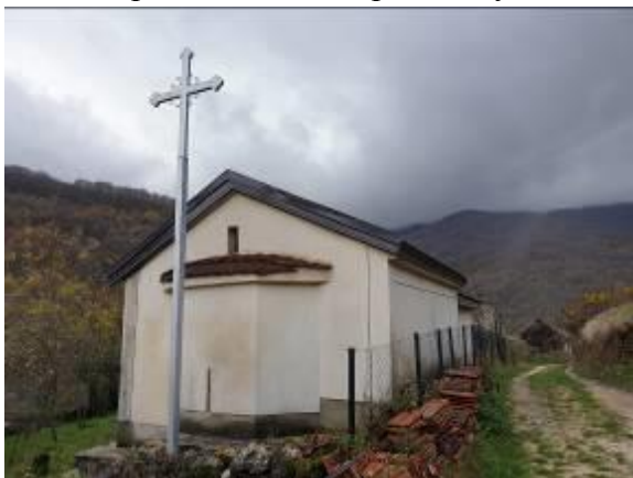
Слика 44. Црква Св. Петка

живописот во конката на апсидата кој е со посебни стилско-ликовни вредности. Општо црквата има историска и уметничка вредност.