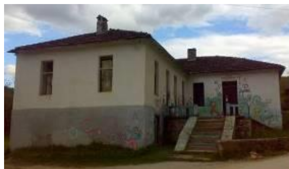
Слика 139. Поранешното училиште

Во 1981 г. имаше 180 куќи – домаќинства. Куќите се претежно сидани од кршен камен, покриени со ќерамиди (порано со камени плочи). За зидање, покрај камен се употребувал и керпич – непечена тула. Во селото, од скоро е затворено училиштето, а деца од селото предметна настава следат во ООУ „Браќа Миладиновци“ во Жван. Во селото има споменик на паднатите борци од НОБ. До скоро во селото работеше продавница, здравствена амбуланта, две/три фарми. Сепак, во селото има помал број крави, овци, кози, живина и сандаци со пчели.