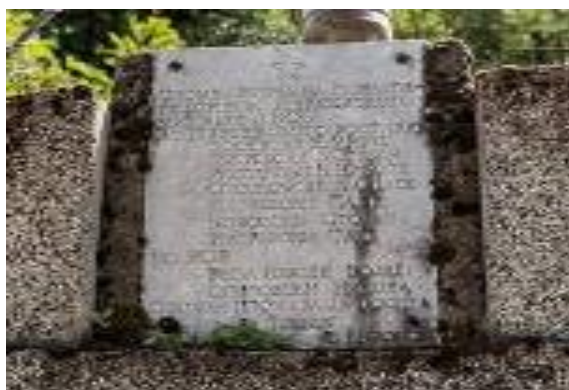
Слика 40. Црква Св. Петка Слика 41. Спомен плоча на паднати борци од Илинден и НОБ