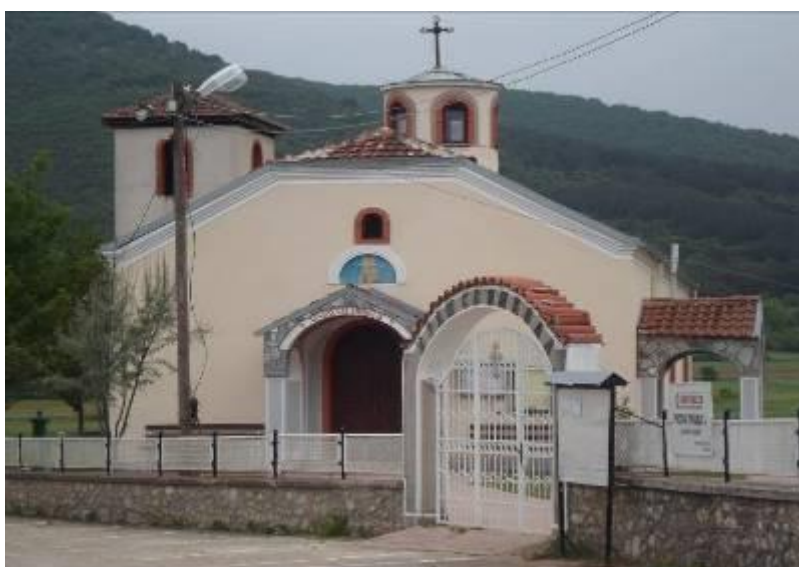
Слика 53. Црква Св. Никола, гробјанска црква