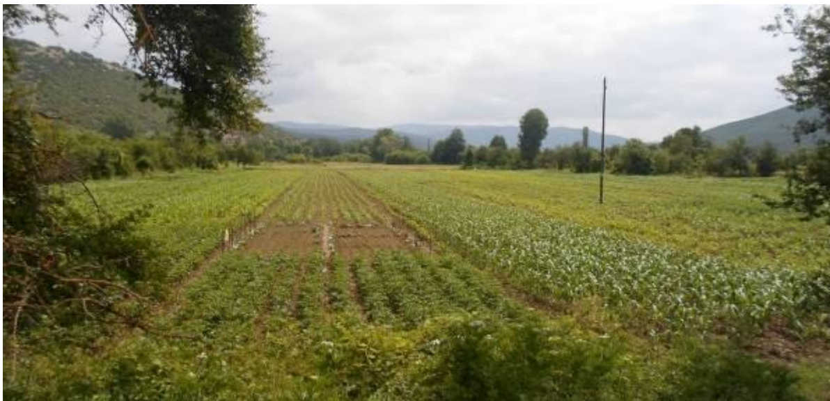
Слика 68. Насади на грав, пченка, пипер и друго во Жванско Поле

Во 1961 г. селото броеше 904 ж., додека во 1994 г. бројот се налил на 506 жители, во 2002 спаднал на 428 жители. Во 2015 г. селото брои над 300 жители. Бројот на иселени семејства изнесува околу 100. Најмногу иселени домаќинства има во Битола, Скопје, Кичево, Ресен, Охрид, Штип, Струмица, Радовиш и други места, а од странство во Австралија, Германија, Србија, Нов Зеланд, Шведска и други земји.