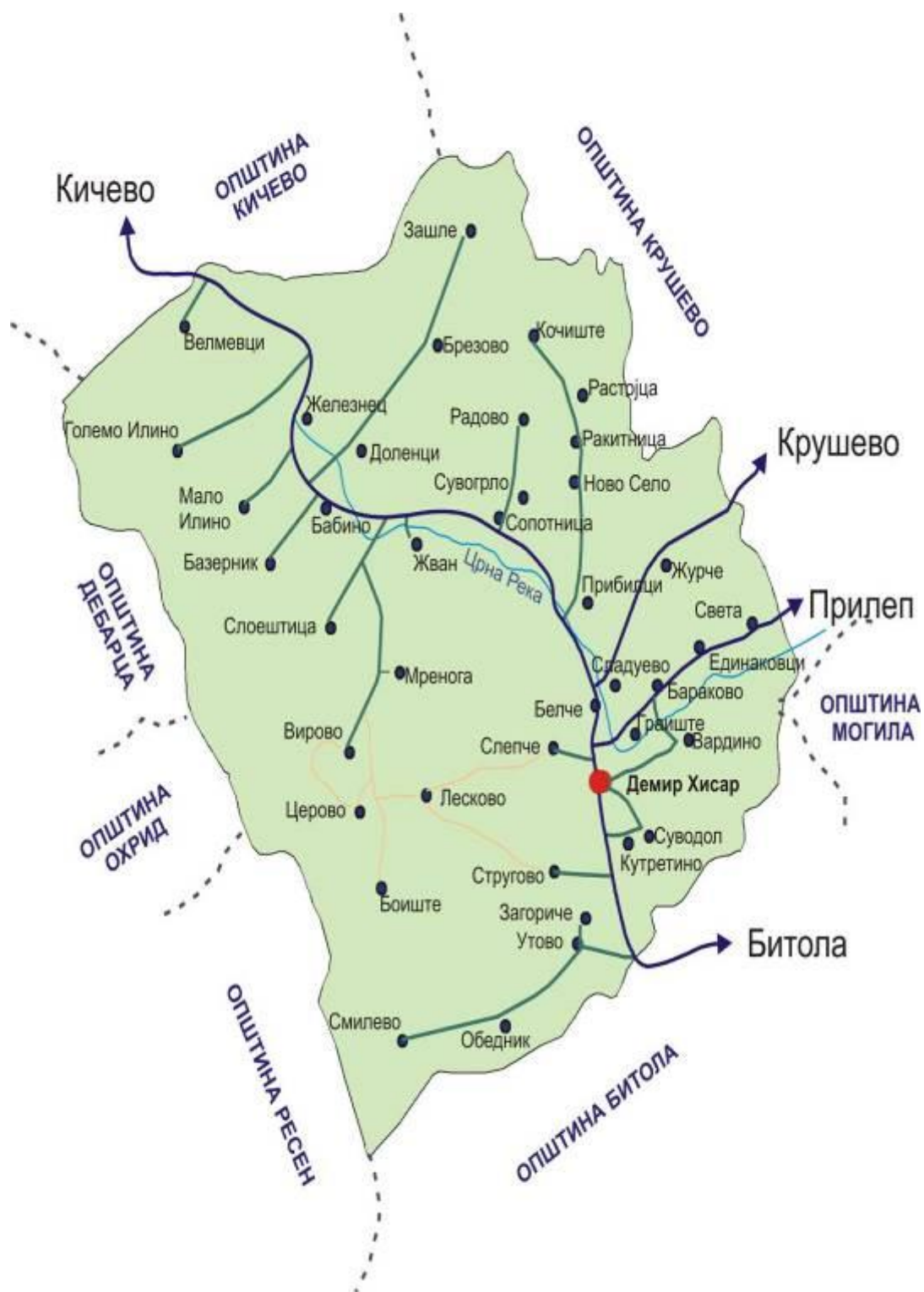
Карта 1. Патна карта на Општина Демир Хисар