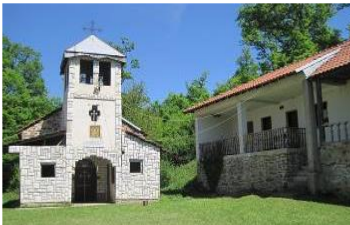
Слика 137. Манастир Добромирово

Манастир Добромирово - Св. Пресвета Богородица Балаклија или Источен Петок. Според археолошките наоѓалишта тука постоела црква од средниот век. Според легендите, манастирот Добромирово е поврзан со војсководецот Добромир на Самоиловата војска. Во неговите конаци низ вековите свој одмор наоѓале и македонските самостојни владетели Добромир Хрс и Добромир Стрез. По нивното име манастирот го добило името „Добромирово“. Денешната манастирска црква е изградена на помал дел од старите темели во 1970 година. Денес, во манастирскиот двор се подигнати два нови конака. Слава на манастирот е Источен Петок, по Велигден и Илинден. Во непосредна близина на манастирот има чешма, позната под името „Самоилова Чешма“, која кај народот е позната по нејзината лековита вода.