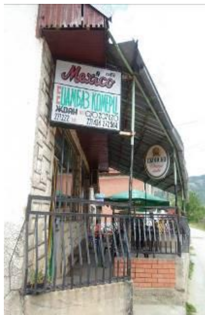
Слика 70. Колонијална продавница „Дамбас комерц“ - Жван

Во 1950 година селото е електрифицирано, во 1970 г. добива водовод, а во 1975 година добива и асфалтен пат. Во селото има 2 јавни чешми, 2 воденици, пошта, има основно училиште, две продавници со кафеански дел, 2 шпедитерски превозника, а амбулантата, аптеката и сушарата за тутун се затворени.