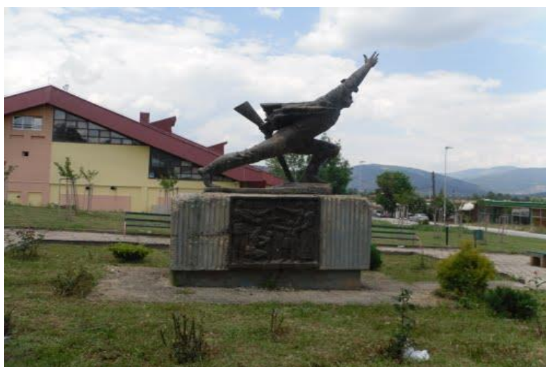
Слика 52. Споменик на НОБ