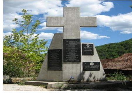
Слика 3 и 4. Стариот и новиот споменикот во Бабино

Во Бабино има библиотека „АЛ-БИ“ со преку 20.000 наслови разновидна литература. Првите книги биле донесени во 1882 година од Багдат, Техеран, Дамаск, Истанбул, Анкара на персиски, статотурски и арапски. Во библиотеката има и книги на старословенски јазик, како и бројни вредно документи и ракописи. Во состав на библиотеката има театар на отворено, мала етнoлошка поставка, а во дворот спортски реквизити за деца, неколку маси, клупи и со простор за скара. Бабино е познато како село со најмногу книги и учители.