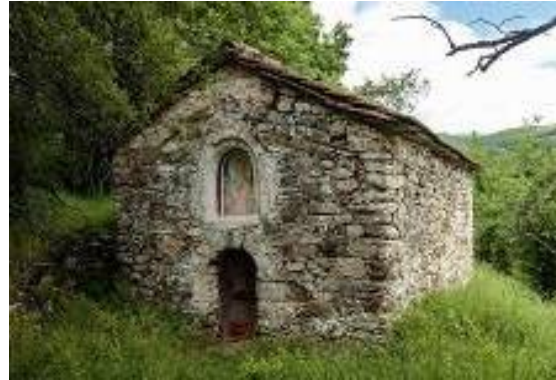
Слика 22. Црква Св. Илија