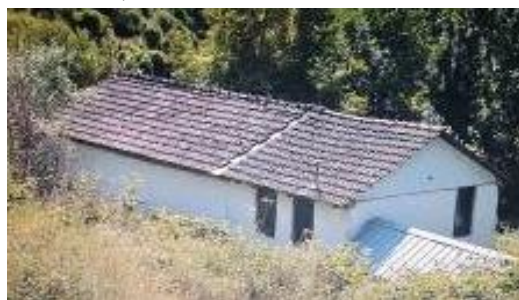
Слика 122. Црква Св. Архангел Михаил

Црква Архангел Михаил е подигната во 1856 г., живописана во 1875 година. Живописот е сочуван фрагментарно бидејќи е на повеќе места излупен, обновена кон 1925 год. Во основа претставува еднокорабна градба со полукружна апсида, покриена со полукружен свод. Покривот е двоводен, фасадата на црквата е малтерисана, подот е од камени плочи, на западната страна црквата има трем. Црквата е обновена во 1934 г. и повторно реновирана кон 80-тите години на XX век.