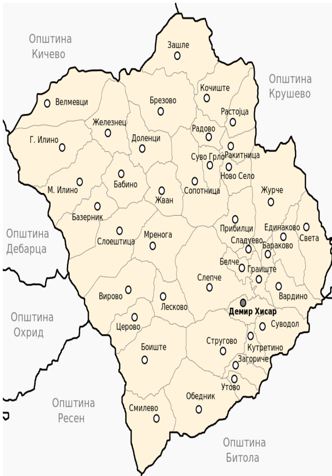
Карта 2. Населби во Општина Демир Хисар