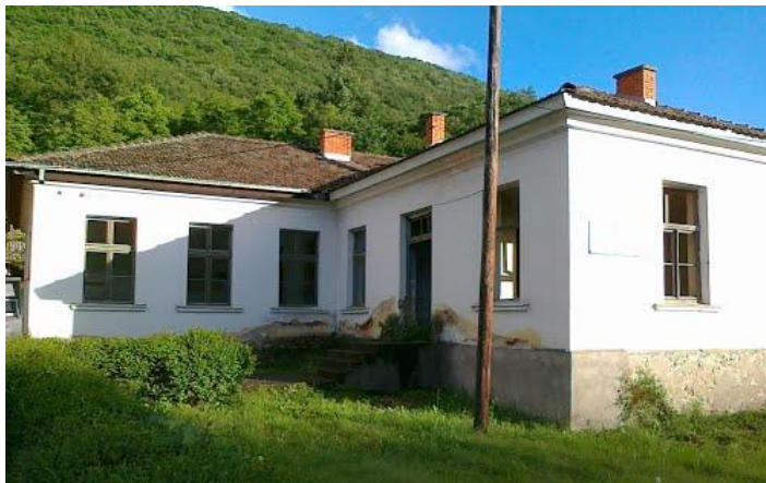
Слика 55. Училиштето во Доленци

Селото има поделско-шумска функција, а тоа значи дека населението се занимавало со обработка и продажба на дрво и сеење на житни растенија и садење зеленчук. Во Доленциу имало училиште уште од 1914, а подобро организирана настава по Првата светска војна. До пред некоја година во селото работело училиште до IV одделение.