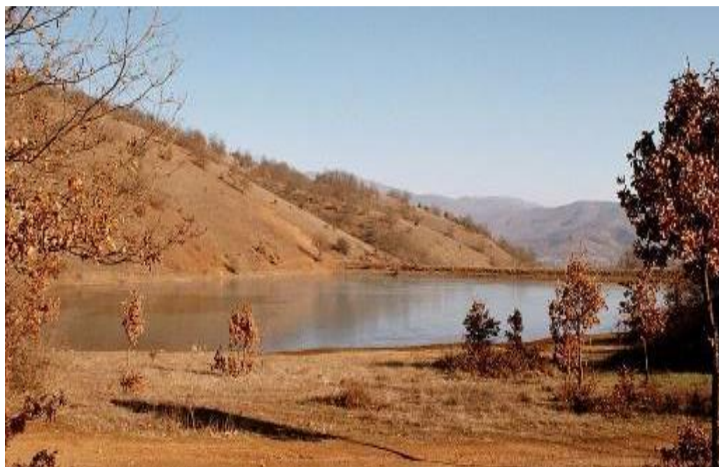
Слика 173. Вештачка акумулација „Стругово“