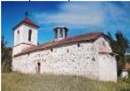
Слика 171. Црква Св. Атанасиј Велики

Манастир Св. Антониј - Се наоѓа над селото во шумската зона и во близина на месноста Манастириште. Граден е на простор каде претходно имало стара црква – манастир. Новата црква и коначите се изградени од неодамна.