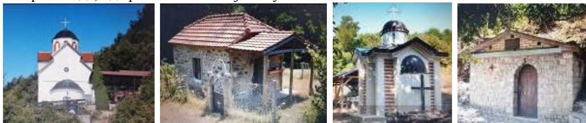
Слика 156-159. Црква Св. Ѓорѓи, Св. Димитриј, Св. Петка и Св. Недела

на егуменот Петар подолго време била препуштена на забот на времето и станала руина. Денес, манастирската црква е еднокорабна градба со простран наос, иконографисан, со камбанарија. Манастирот е добро уреден и претставува манастирски комплекс од црква, конаци и други помошни простории. Во него престојувале калуѓери кои го обработувале манастирскиот имот. Манастирот располагал со шума, пасишта, мало обработливо земјиште и ситна стока – кози и овци. Во манастирдските конаци останувале подолго време деца и мажи алипни (дементи) во умот кои по извесно време им се разбиструвала главата, се разбира од чистиот воздух, бистрата вода, од третманот на знајни и умни личности.