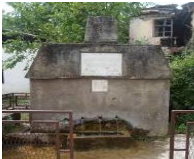
Слика 67. Споменик на паднатите борци во НОБ