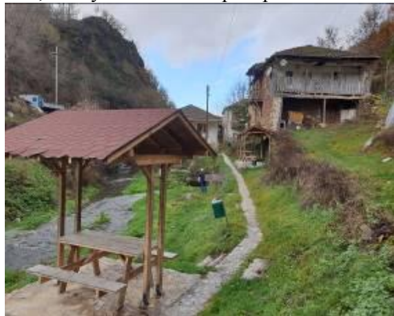
Слика 77-78. Еден од изворите на Црна Река пред и по уредувањето

Во селото коритото на Црна Река се исполнува со брза, пенлива и потемнета вода бидејќи од три-четири куќи од селото излегуваат уште еден-два и повеќе извора кои со бликот на вода веќе ја формираат Црна Река продолжува да ги носи водите низ Демир Хисарско и ги припојува кон себе седумте месни водотечија. После тоа ја свива своја става змијулесто низ Пелагонија, па минува низ тиквешко и се влива во река Вардар внесувајќи ги водите од Македонија во Егејското Море. Вода која лади, вода која е исполнета со живот, вода која пенливо ги излива сите маки и јадови од овој народ кој со