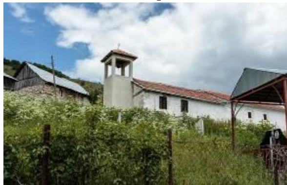
Слика 93. Црква Св. Илија

Црква Св. Илија. – Се наоѓа во центарот на селото. Таа е селска гробјанска црква. Сидана е од кршен камен и делкан бигор на отворите и венцот. Градена е некаде во 1888 година. Живописана од зографот Коста Анастасович од Крушево. Покривот е двоводен од ќерамиди и камени плочи над апсидата. Фасадите се фугирани. На северниот и јужниот ѕид има пиластри. На западната страна црквата има карактеристичен долг трем.