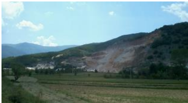
Слика 142. Каменолом

Во близина на Слоештица работи и каменолом, кој е работна организација на Рудник „Железник“. Рудникот дроби четири фракции на крупен и ситен камен за тампонирање на патишта.