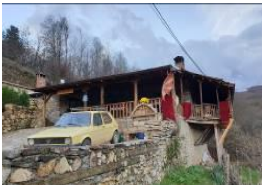
Слика 140. Ресторан „На валајци“

Од неодамна над селото е изграден ресторан „На валајци“, кој подготвува национални специјалитети и поради тоа е посетен од многу гости.