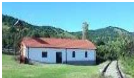
Слика 12. Црква Рождество на Пресвета Богородица

ќерамиди двоводен. Фасадите на црквата се фугирани и освен јужниот ѕид кој е малтерисан. Венцот на црквата е од камени плочи. На западната страна, во продолжение на храмот има трем. Во дворот на црквата има камбанарија. До црквата поминува железничката линија Прилеп – Сопотница, која повеќе децении не е во функција.