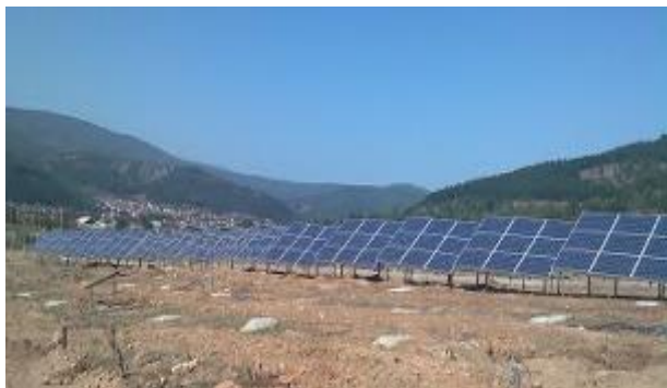
Слика 180. Соларна централа