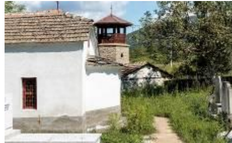
Слика 125,126 и 127. Поранешното основно училиште, споменик од НОБ, црква Св. Ѓорѓи

Во 2015 година бројот на жители изнесува 10 лица. Растојчани има населено и во Демир Хисар, Битола, Скопје, Крушево, Пресил, а од странство во Австралија, САД и други држави. Во 1960 година е електрифицирана, има три јавни чешми, а во 1991 година и асфалтен пат. Во селото има услови за поледелство, сточен фонд нема, но затоа има неколку трактори, живина и сандуци со пчели. Во селото има споменик на паднатите борци од НОБ. Во селото има една црква посветена на Св. Ѓорѓија. Слава на селото е Ѓурѓовден.