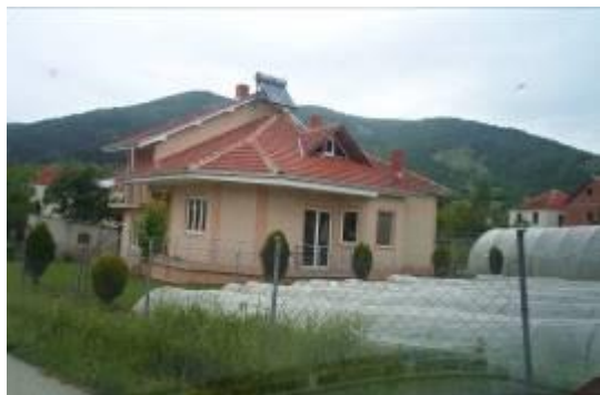
Слика 179. Нова современа куќа

Над селото се наоѓа една голема соларна централа и две мали вештачки акумулации, чија вода се користи за наводнување.