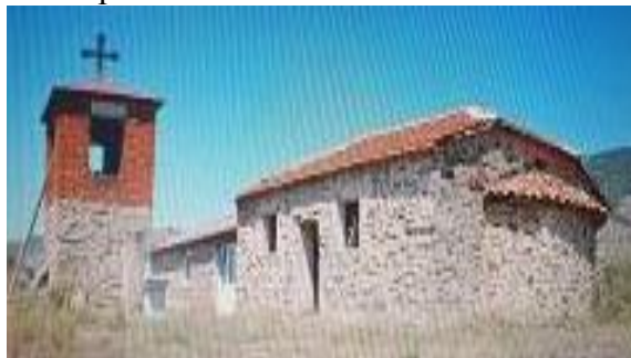
Слика 130. Црква Св. Петка