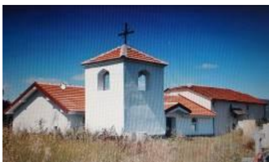
Слика 88. Црква Св. Никола