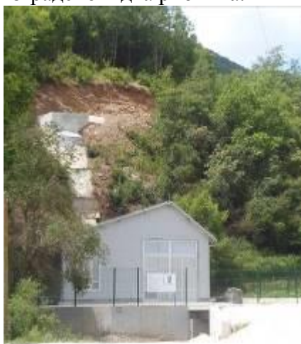
Слика 79. Мала хидро централа

Под село има мала хидро централа која се наоѓа на Кушња Река која доаѓа од Мало Илино. Во селото има над 500 сандуци пчели. Под селото на Црна Река има изградено и два рибника.