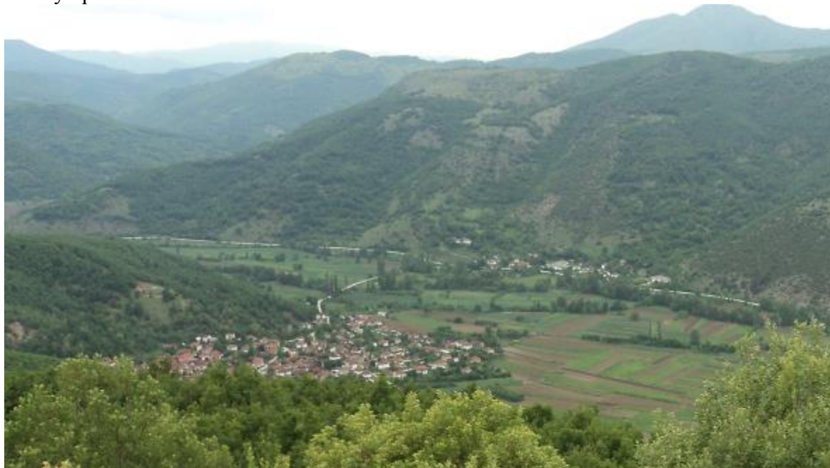
Слика 65. Панорама на Жван

синтагма Жван и означува Дол, Рид. Во семантички поглед ојконимот означува „село кое му припаѓало на Жван“ 62 .