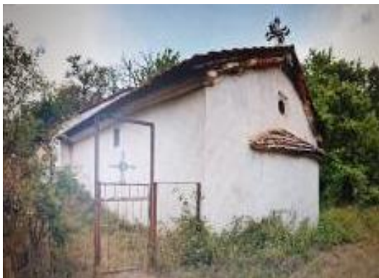
Слика 175. Црква Св. Атанасиј

Црква Св. Атанасиј Велики. – изградена 1886 год. Во основа претставува еднокорабна градба со полукружен низок своди полукружна апсида без прозор. Сидана е со кршен камен и фугирана фасада. Покривот е двоводен, од керамида. На западната страна има трем. Од постариот живопис во црквата сочувана е само претставата на Св. Богородица во конхата на апсидата. Во дворот на црквата се селските гробишта.