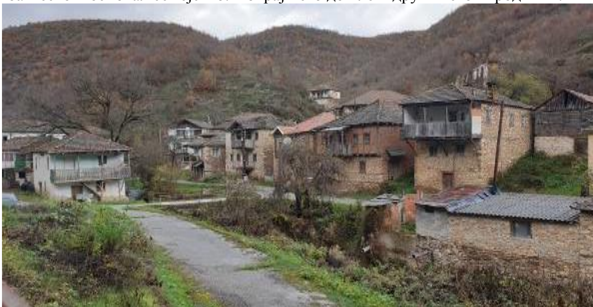
Слика 75. Средишниот дел на Железнец

Ојконимот потекнува од личното ст.сл. име Железко, Железник 67 . Има и претпоставка дека Железнец го добило името поради железната руда што се вади во непосредна близина. Во тоа село живееле рудари кои работеле на рудникот. Железнец е село кое му припаѓало на Железко кој прв се доселил во тоа место и основал семејство. Покрај него дошле и други негови роднини.