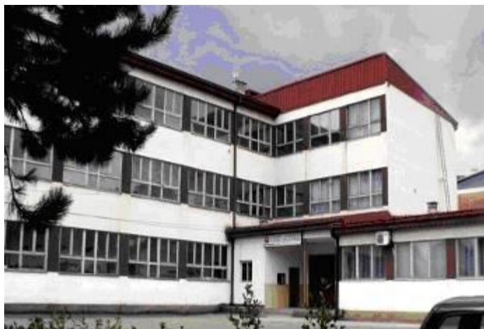
Слика 50. ООУ „Гоце Делчев“

Во Демир Хисар работи едно основно училиште „Гоце Делчев“, формирано во 1948/49 година. Ова училиште се состои од едно централно деветгодишно училиште во Демир Хисар и подрачни училишта и тоа во Стругово, Суводол, Вардино, Света, Журче, Единаковци, Прибилци и Слечче. Во 2000/01 година престана со работа подрачните училишта во Загориче, а во 2008/09 год. и во с. Граиште.