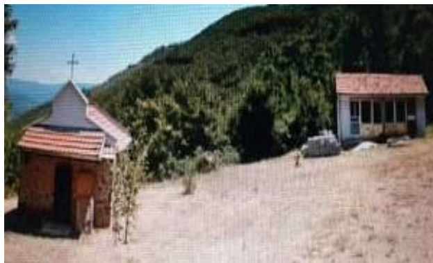
Слика 73 и 74. Црква / манастир Св. Архангел Михаил и црква / манастир Св. Илија