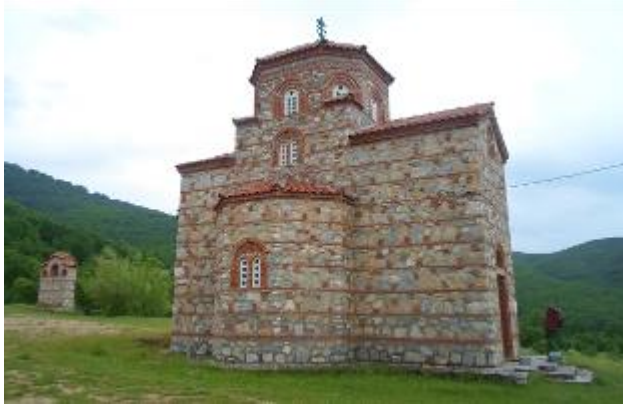
Слика 182. Манастир Св. Богородица