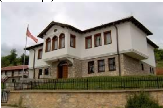
Слика 151. Меморијален музеј (2003)

Во Смилево во текот на годината се одржуваат неколку манифестации: Денови на Смилевскиот конгрес (2-7 мај), со полагање цвеќе на споменичните обејжја, историски час, изложба, промоција, меморијален или друг перформанс, потоа „Петровден“ (12-13 јули) – одбелжување на верскиот празник Св. Петар и Павле со голем народен собир во Манастирот „Св. Петар“, и Илинден во Смилево (2.август) со Културно - уметничка програма, марш по врвиците на Смилевските илинденци, востанички ручек и Панихида за Даме Груев (23.декември).