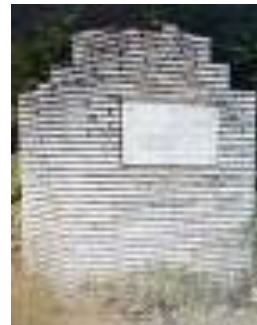
Слика 165 и 166. Живинарска фарма Слика 167. Споменик од НОБ

Празник на селото е Св. Никола летен на 2 јуни. Црквата им е посветена на Св. Николај Мираклијски – Чудотворец, а манастирот на Св. Атанасиј. – се наоѓа над селото во чиста природа.