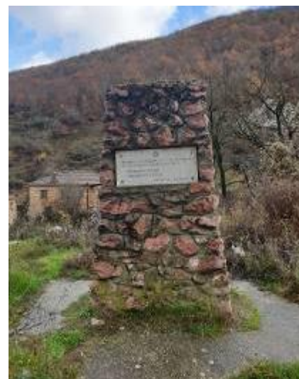
Слика 81. Споменик на паднати борци во НОБ

Селото ја слави Голема Богородица (28.08), а се слави и Св. Ѓорѓија (Ѓурѓовден, 06.05.). Во селото има една црква посветена на Пресвета Богородица.