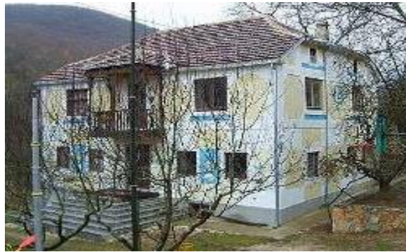
Слика 5. Библиотека „Алби“ на Стево Стеваноски

Во Бабино има библиотека „АЛ-БИ“ со преку 20.000 наслови разновидна литература. Првите книги биле донесени во 1882 година од Багдат, Техеран, Дамаск, Истанбул, Анкара на персиски, статотурски и арапски. Во библиотеката има и книги на старословенски јазик, како и бројни вредно документи и ракописи. Во состав на библиотеката има театар на отворено, мала етнoлошка поставка, а во дворот спортски реквизити за деца, неколку маси, клупи и со простор за скара. Бабино е познато како село со најмногу книги и учители.