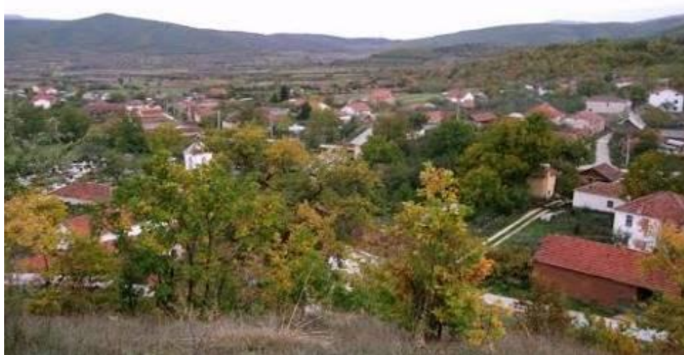
Слика 170. Панорама на Стругово

По Втората светска војна, населбата го бележи следниот број на жители во 1948 г., има 645 ж., во 1953 г. 644 ж., за да во 1961 г., поради миграција село – град се намалува на 607 ж. во 1971 г., на 548 ж., во 1981 г. 535 ж., во 1994 г. 353 ж., а според податоци од пописот од 2002 г. се намалил на 286 жители. Денес, во 2015 г. Стругово има над 220 жители.