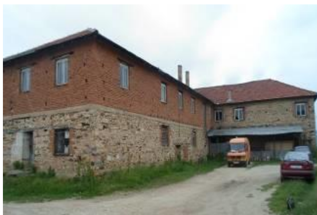
Слика 181. Столарска работилница „Амбиент“

Во селото ги има слените верски објекти: една црква Св. Константин и Елена, еден манастир Св. Богородица и една џамија.