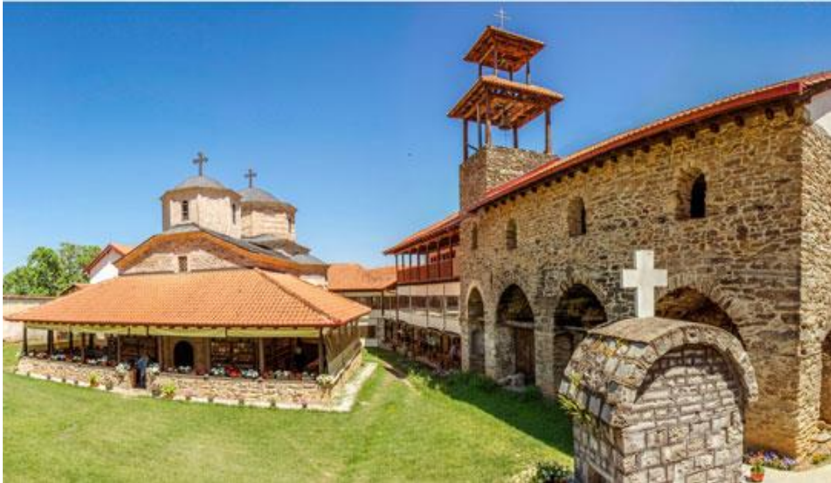
Слика 135. Манастир Св. Јован Претеча

Македонија. Посебно во Демихисарскиот крај каде градењето на храмовите било директно помагано со средства и од Охридската архиепископија. Манастирот претставува комплетен комплекс во Демирхисарско и пошироко, посветен на Свети Јован Претеча – што значи претходник кој се појавил пред Исус Христос и го подготвувал Исуса за натамошните дејанија.