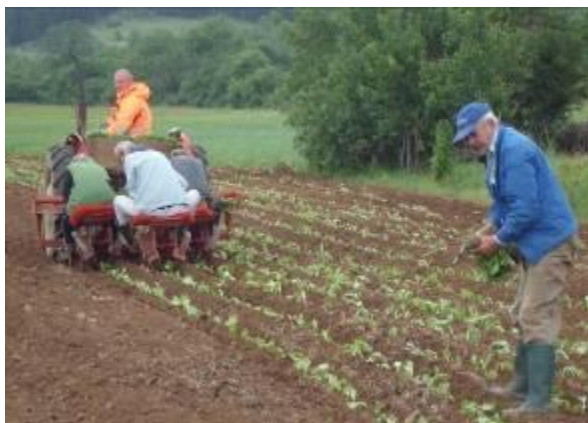
Слика 177. Машинско и рачно садење на тутун

Селото има поделелско-шумска функција. Населението се занимава со одгледување тутун, овчарство и краварство. Во селото пред дваесеттина години имало воденица, пет продавници, фурна за леб и др. Исто така, од сточниот фонд располагало со 600 овци, 100 крави, 130 кози, десетина коњи, живина и сл. За подвлекување е тоа дека, денес сите домаќинства во селото располагаат со трактори, а има и комбајни, косачки и други земјоделски машини, како и камиони, а над 30 куќи на покривите имаат поставено сончеви колектори.