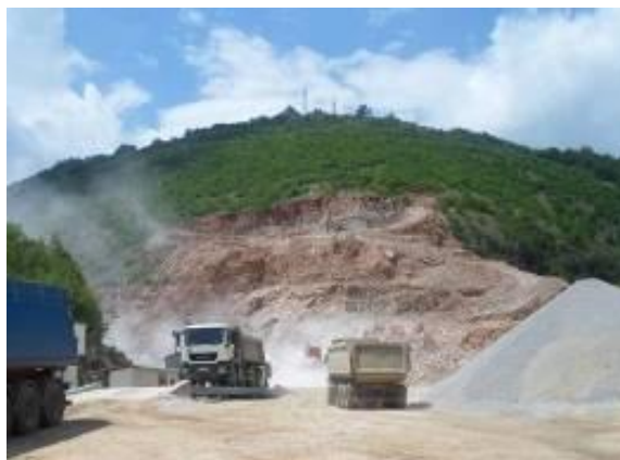
Слика 36. Каменолом „Трансмет“

Од пред неколку години во месноста Ласејца работи каменолом.