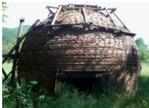
Слика 105. Сидана дупка за правење кумур

Во селото има споменик на паднатите борци во НОБ. Спомен плочата се наоѓа на селската чешма. Селото има храм посветен на Св. Спас – Вознесение Христово и манастир Св. Атанас. Селска слава е Спасовден.