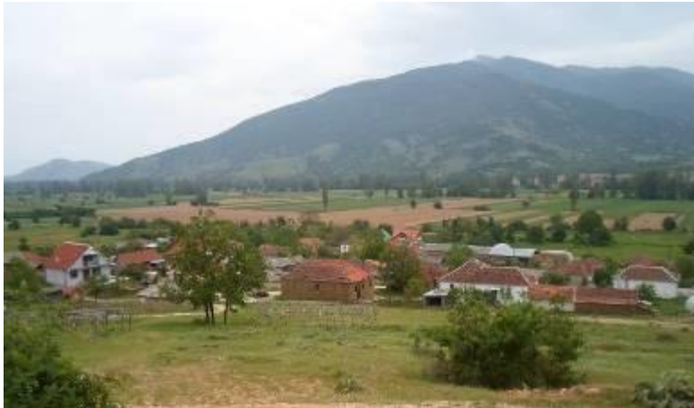
Слика 11. Панорама на Бараково

Бараково е мало рамничарско село од збиен тип со над дваесетина куќи. Се наоѓа на источниот дел на Општината Демир Хисар, од левата страна на Црна Река. Селото е рамничарско на н.в. од околу 600 м. Од Демир Хисар е оддалечено 5,3 км, а од Битола 32 км. Атарот е мал и зафаќа простор само од 1,8 км 2 , (177 ха, Види: Табела 11), обработливите површини зафаќаат 98 ха, пасиштата 78 и само 1 ха под шуми. Атарот на Бараково се граничи, на север и запад со Журче, на исток со Единаковци, на југ Вардино, на запад и југо запад со Граиште. Географските координати на селото се: 41°15'02" N–северна географска широчина; и 21°13'36" E–источна географска должина.