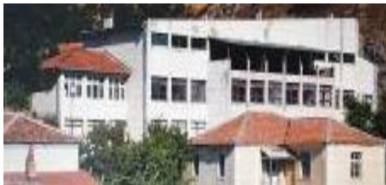
Слика 149. ООУ „Даме Груев“

Основното училиште е изградено во 1928 г. (а дотогаш наставата се изведувала во селската црква). Бројот на ученици во учебната 1928/29 г. бил 104, за да веднаш по ослободувањето бројот се зголемил на 195 ученици. Како резултат на емиграција, бројот на ученици во ООУ „Даме Груев“ е значително намален. Основното училиштето има едно подрачно училиште до V одделение во село Обедник.