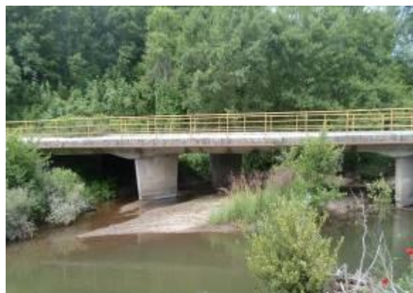
Слика 160. Бели Мост на Црна Река

Официјалното име на селото е Сопотница , неговите етници: сопотничанец , (м.р. ед.), сопотничани , (м.р. мн.), сопотничанка (ж.р. ед.), сопотничанки (ж.р. мн.), а ктетикот е сопотнички пр . Сопотнички ниви ; додека народно се именуваат: сапотничанец , спотниланка , сопотничани .