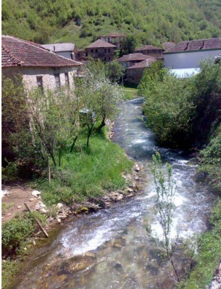
Слика 76. Извориштето на Црна Река

Во 1900 година Железнец имал 320 жители, во 1914 г. 293 ж., во 1925 г. 347 ж., во 1931 г. 356 жители. По Втората светска војна, во 1948 г. бројот на жители изнесува 358, во 1953 г. 398 ж., во 1961 г. 311 ж., во 1971 г. 216 ж. во 1981 г. 133 ж., во 1994 г. 86 ж., во 2002 година 57 ж., и во 2015 г. само 15 жители. Во летниот период од годината во Железнец бројот на жители се зголемува и до над 50 жители.