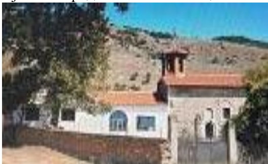
Слика 129. Црква Св. Пантелејмон

Црквата Св. Петка - Преподобна Параскева – е лоцирана под селото. Еднокорабна црква обновена во 1970 година на стара градба, без податок од кога потекнува. Според преданието Турците ја запалиле дека во олтарот нашле скриено вино во повеќе бочви со намера селаните да го зачуваат, а да не платат ушур (данок) за лозје. Во непосредна близина на црквата има споменици, во руинирана форма, подигнати од бугарската војска на погинатите погребани војници од Првата светска војна. Во средина на спомениците има висок крст.