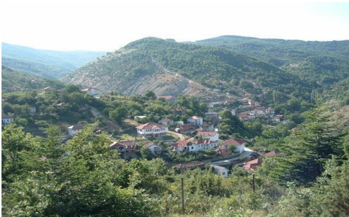
Слика 148. Панорама на Смилево

култури, та поради слабите даночни обврски селото било вброено во слабо економски населби, поради што во 1608 година целото село било задолжено со само 1300 акчи од вакафот на Ахмет-паша од Битола 108 .