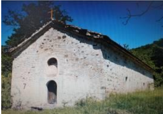
Слика 21. Црква Св. Ѓорѓи

Црква Свети Илија – еднокорабна, покриена со свод. Има мала тристрана апсида. Сидана е со кршен и речен камен, со употреба на делкан бигор на влезот на западната страна. Покривот е од ќерамиди и е на две води. Горниот дел на апсидата од надворешна страна е срушен. Подот на црквата е од бетон. Малтарот од фугите на фасадните ѕидови е отпаднат. Фрескоживописот според стилско и иконографски карактеристики потекнува од XVII век.