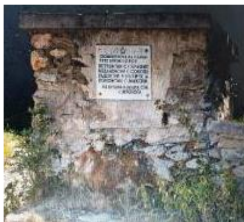
Слика 106. Споменик на паднати борци во НОБ

Црква Вознесение Христово или Св. Спас – Главна селска црква во чии двор се наоѓаат и селските гробишта. Се работи за средновековна црква, која веројатно била изградена во текот на XIV – XVI век. Црквата е еднокорабна градба со полукружна тристрана апсида. Подоцна црквата била продолжена што западниот ѕид бил срушен и во средината на новиот дел поставен столб. Сидана е со кршен камен со употреба на бигор на влезот на кошињата на западната страна. Фасадите се фугирани. На дограденото на фасадата видливи се тенки тули, што значи дека, покрај кршен камен има употреба и на тули. Црквата е покриена со ќерамиди и камени плочи над апсидата. Во внатрешниот дел на црквата има фрескоживопис што е доста оштетен. Во доградениот дел се сочувани само фрагменти на западниот и јужниот ѕид.