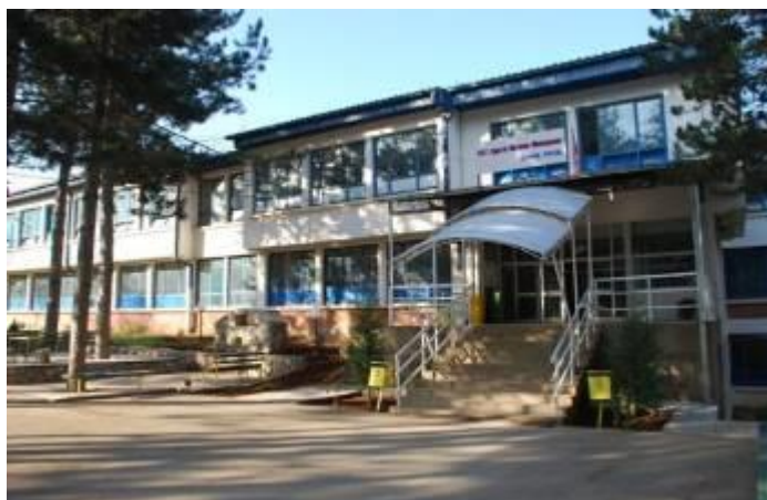
Слика 51. СОУ „Крсте П. Мисирков“

Во текот на годината во Демир Хисар се организираат разни манифестации од кои најважна се: „Богојавленски свечености – Водици“ 19.јануари, 02.август Илинден, 08 септември – ден на ослободување на Демир Хисар и други.