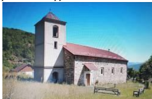
Слика 143. Црква Св. Богородица