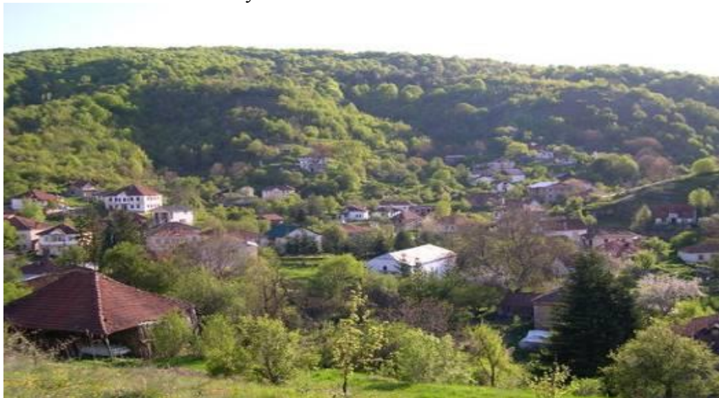
Слика 28. Панорама на Велмевци

Велмевци се споменува во пописот од 1467/68 година, под името „Велмеј“ со 15 семејства и 2 неженети или вкупно 77 жители. Имињата на семејствата на први жители кои се споменети во пописот се: Велко, брат на Ковач; Димитри, син на Иве; Тодорче, син на Воислав; Белче, син на Стојко; Добре, син на Калуѓер; Воислав Степан; Брајан, син на Радослав; Гон, син на Жан; Ѓорго, син на Гон; Ѓорче, син на Тихо; Петко, брат на Воислав; Петко, брат на Калуѓер; Димитри Жан; Јованче Панчар; Пејо, син на Данче; Рале, син на Данче; Рапче, син на Петре. Населението плаќале испенце 820 акчиња. Велмевци се споменува и во пописот од 1568 г. кога имало 25 семејства и 16 неженети или вкупно 141 жители.