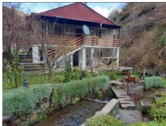
Слика 42. Стара куќа со типична архитектура Слика 43. Нова куќа – викендица

Големо Илино од 1969 година има електрична енергија, од 1978 година водовод, а во 1988 година и асфалтен пат. Во селото двете продавници и воденицата не се во функција, а има и незначителен број овци, кози, коњи, магариња, кошници за пчели и др. Под село има и мала протечна хиродцентра.