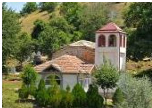
Слика 63. Црква Св. Никола