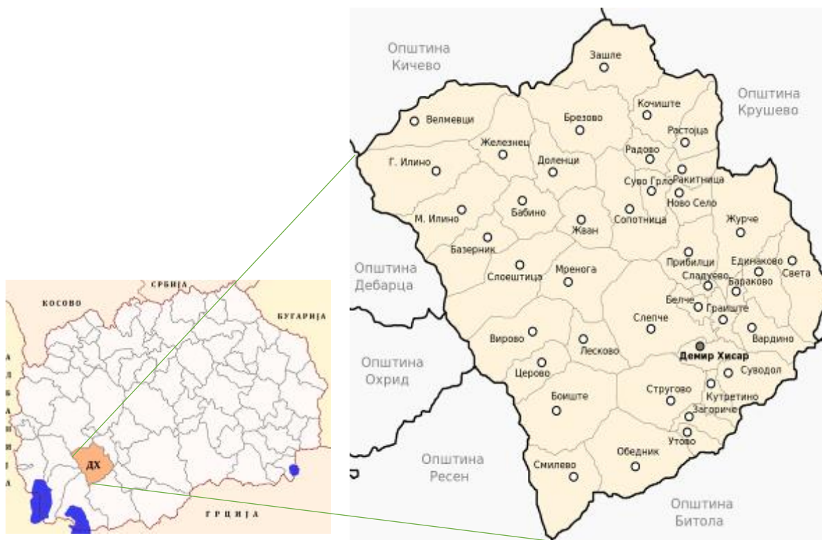
Карта 4. Населени места во општина Демир Хисар