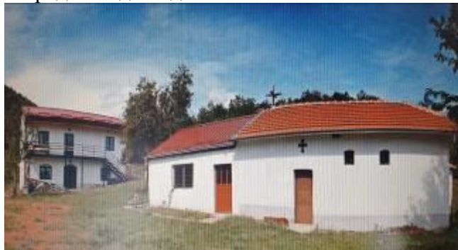
Слика 172. Манастир Св. Антониј