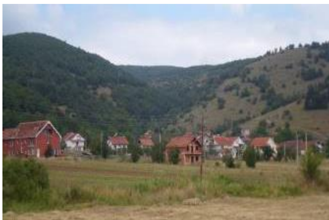
Слика 13. Село Белче