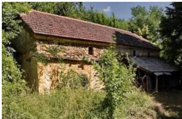
Слика 17. Црква Св. Ѓорѓи

Црквата Св. Ѓорѓи градена во две фази – првиот дел околу 1850 год. Има правоаголна основа со седмострана апсида, архитравно покриена. Аписадата е градена од делкан бигор како и венецот, отворите и кошињата. Покривот е решен на две води, од ќерамиди (првобитно од камени плочи). Фасадите се фугирани. Црквата има таваница од штици со опшивни лајсни. Фрескоживопис има само на северниот и јужниот ѕид изработен во 1878 година.