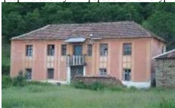
Слика 185 и 186. Стари куќа на спрат и со балкон