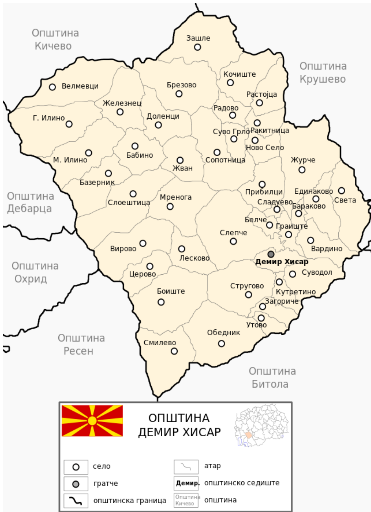
Карта 5. Административна карта на Општина Демир Хисар