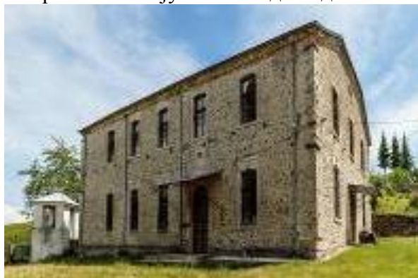
Слика 154. Црква Св. Ѓорѓи

Црквата Св. Ѓорѓи , изградена во 1911 год., една година пред завршувањето на Отоманското пет вековно ропство. Црквата е прилично голема и во основа претставува трикорабна градба со полукружен дрвен централен свод и архитравно покриени странични бродови. Има петгострана апсида со слепи аркади од надворешната страна. Црквата има три влеза и големи пространи прозорци, поставени во два реда на северниот и на јужниот ѕид. Сидовите се од кршен камен, на фасада обработени со фугирање. Покривот е решен на две води и од ќерамиди (по секоја веројатност препокриен, прво бил со плочи). Отворите, венецот и апсидата изработени се од делкан камен. Во внатрешноста црквата има галерија.