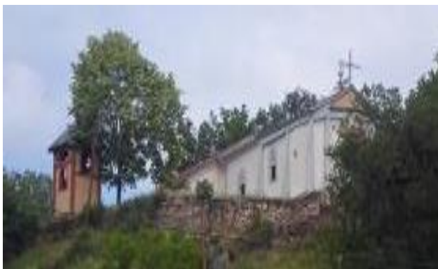
Слика 72. Црква Св. Петка

Црква Св. Петка – гробјанска селска црква. Се наоѓа на височинка којашто доминира над селото покрај левата страна на патот кој води кон Демир Хисар. Претставува еднокорабна градба со полукружен свод и тристрана апсида. Градена е во две фази има карактеристична издолжена основа и висока апсида. Покривот е двоводен, од керамиди и лим над апсидалниот простор. Сидана е со кршен камен и со употреба на делкан бигор на отворите. Фасадите се фугирани и розово обоени. Северниот и јужниот ѕид на црквата од внатрешната страна се зајакнати со пиласти кои во горниот дел се лачно поврзани. На западната страна има изградено трем. Црквата е живописана од зограф Иван Мелников, веројатно во 1931 година. Се претпоставува дека постариот дел на црквата потекнува од пост - византискиот период. Покрај името на светецот црквата се викала Латинска, име што означува старост на храмот.