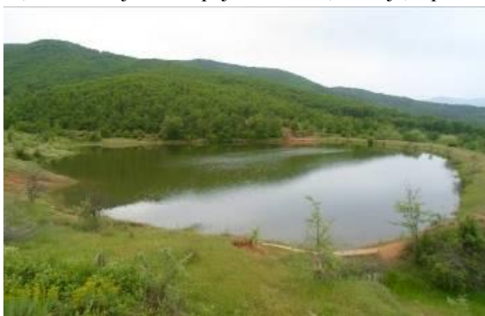
Слика 178. Едно од двете веитачки акумулации

Во Суводол има и голем број доселеници и тоа од: Боишта, Церово, Вирово, Жван, Базерник, Брежани, Лесково, Вардино, Мало и Големо Илино, од старото село Чагор и др. Во 1958 година селото е електрифицирано, водовод има од 1966, а асфалтен пат од 1986 година.