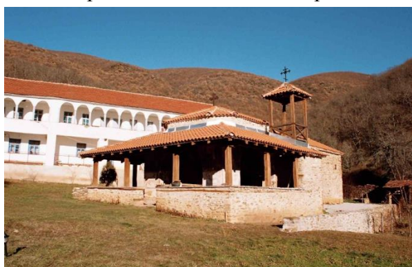
Слика 86. Манастир Св. Атанасиј Александриски

Познато е дека Александриската црква е подигната во 1121 година и целосно е живописана во 1617 година. Според натписот кој се наоѓа над западната врата, потекнува од 1622 година. Во црквата се сочувани два натписа – првиот е напишан над влезната врата и од него дознаваме дека зографисувањето се случило во 1617