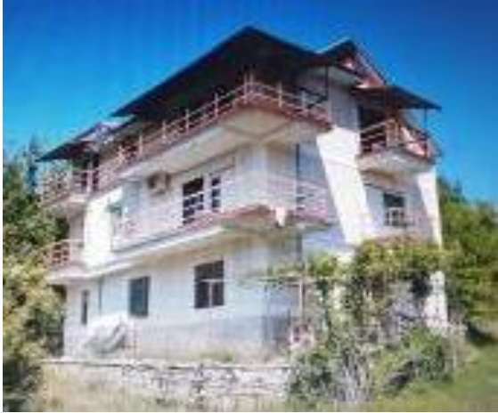
Слика 187. Нова куќа во Церово