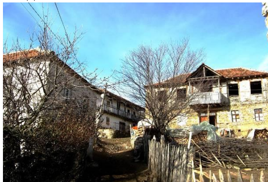
Слика 90 и 91. Куќи во село Зашле