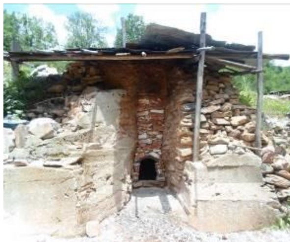
Слика 20. Споменик во Брезово

Во селото имало и дрводелци кои изработувале алати за обработка на волната (фурки, родани, разбои,) алати за обработка на земјата (вили, лопати дрвени, набодни, витли и др.), предмети за домашна употреба (лажици, вилушки, ночви, таруни, сукала, штици за леб, котрита и друго).