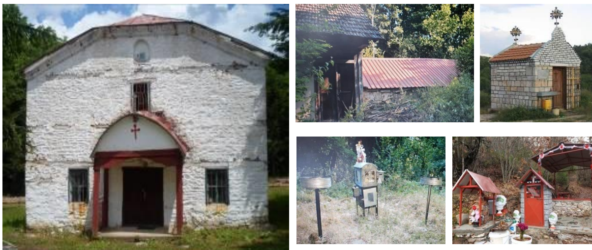
Слика 30-34. Црква Св. Пророк Илија; црква Св. Богородица – „Богоројче“; црква Св. Петка; параклис Св. Огнена Марена и параклис Св. Пророк Илија – женска вода

Селото Велмевци е познато и по првата фудбалска топка која е донесена во 1909 година. Додека пак, првиот фудбалски клуб „Пелагонија“ бил формиран во 1921 година, а во 1941 год. бил преименуван во „Славија“, и под тоа име постоел до 1977 г.