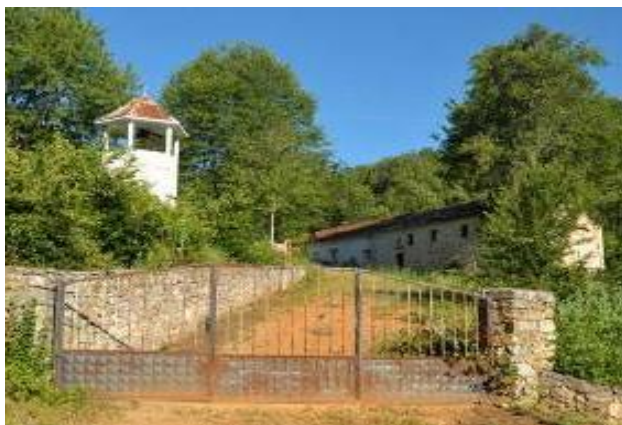
Слика 15. Црква Св. Никола

Црквата Св. Никола - изградена е околу 1925 год. на стари темели и претставува еднокорабна градба покриена со низок дрвен свод. Сводот е двоводен од ќерамиди. Апсидата е полукружна од камени плочи. Од надворешна страна има четири пиластри поврзани со аркади и декорација од тули. Фасадите на црквата се фугирани. Во продолжение на западната страна има трем. На венецот е употребен делкан камен, отворите, ќошињата и апсидата. Сводот на црквата е од камени плочи. Во дворот на црквата се селските гробишта.