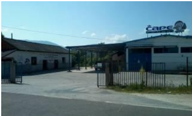
Слика 131. Фабрика за печурки ДОО, Чапе Фунги“

А денес има фабрика за откуп и преработка на печурки „Чапе Фунги“ ДОО. Селото располага со земјоделска механизација – трактори, вршалици и комбајни. Од сточниот фонд има крави, кози и неколку коњи.