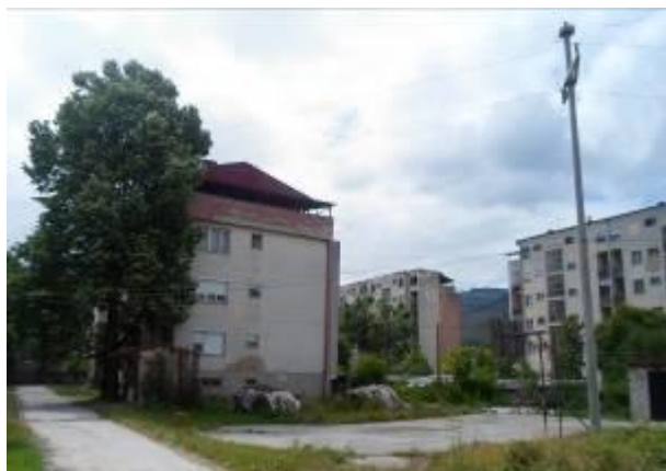
Слика 161. Колективни станбени згради

Во времето од 1955 год. некаде до 1969/70 година (без прекин) се сообраќаше воз од Сопотница до Бакарно Гумно, пренесувајќи руда, патници и друг вид на стока. Возот минуваше Сопотница – Граиште – Единаковци – Света – Бучин и кај Бакарно Гумно патниците и рудата се пренефрлуваа во друг воз од кои дел за Скопје, а дел за Битола според нивните желби и потреби за патување.