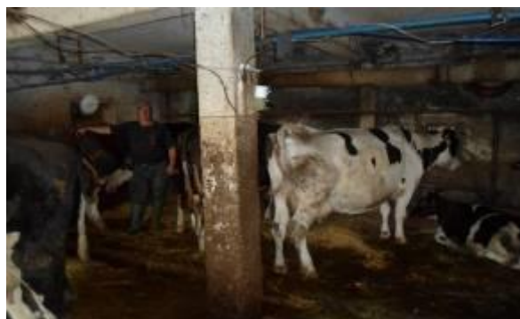
Слика 184. Внатрешност на крварска фарма