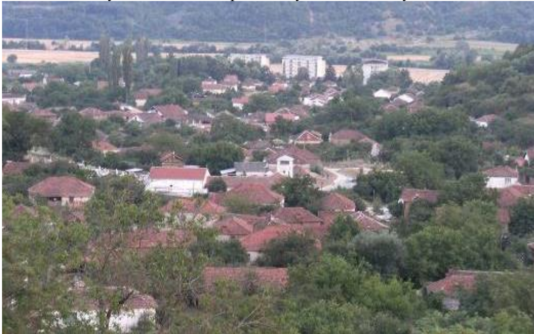
Слика 162. Панорама на Сопотница

Во Сопотница секогаш имало развиено основно образование. Се споменува дека во турскиот период имале егзархиско училиште во кое биле образовани свештеници. Некаде кон 1913 г. било отворено училиште на српски јазик. Во 1914 г., Бугарските војски отвориле училиште на бугарски јазик. Во 1918 год. било отворено основно четиригодишно училиште на српски јазик, а проширено во 1927 година. Во 1931/32 година во организација на тогашната набавно – продајна задруга која работела во селото, изградена е дрвена брана на Црна Река (вренгија), со земјен канал во должина од 6 км. Оваа брана. По војната е модернизирана со бетониран канал и опфаќа околу 300-400 ха со наводнување по нат на бразди и пумпи за наводнување 122 .