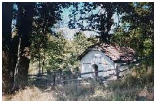
Слика 109. Манастир Св. Атанас

Манастир Св. Атанас се наоѓа над селото во месноста „Грнчари“. Местото е природна реткост на густа стара повеќе вековна дабова шума. Овде пред повеќе векови имало црква – манастир кој подоцна бил разрушен. Стариот верски објект е обновен во 1998 год.