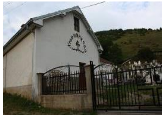
Слика 168. Црква Св. Никола

Црква Св. Никола Мираклијски - Чудотворец – Изградена во 1874 година. Во основа претставува еднокорабна градба, покриена со полукружен свод. Има петтострана апсида. Сидана е со кршен камен и делкан бигор на венецот, прозорците и вратите. Фасадите се малтерисани и бело обоени. Покривот е од камени плочи над апсидата, додека поголемиот дел од ќерамида (првобитно со камени плочи) и двоводен истек. На источниот ѕид над апсидата и на влезниот на западниот ѕид има прозорци во форма на четворолист. Подот е од керамички плочки. На западната страна има трем. Има и висока камбанарија, со ѕвон набавен од Солун. Општо црковниот комплекс претставува велеченствена композиција на христијански храм и помошни простории. Црквата е главна за населбата и во дворот се селските гробишта.