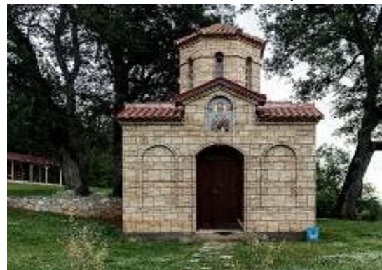
Слика 169. Манастир Св. Атанасиј

Градбата има правоаголна основа, со полукружна апсида во нејзиниот заден дел и претставува крсто-куполен храм. Особено забележителна е осумаголната купола што се издига во среднишниот дел на покривот на црквата и над која е поставен крст. Од манастирот се протега прекрасен видик кон Средно или Сопотничко Поле, текот на Црна Река, Ставрако и пошироко. Во склоп на манастирот спаѓаат црквата, трпезаријата, чешма, уреден двор, сите градени од жителите на Сопотница и пошироко.