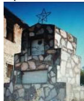
Слика 120 и 121. Сред село - стари напуштени куќи и споменик на паднати борци од НОБ

Селото е сиромашно со малку плодно земјиште и единствена егзистенција им била од стока и дрводелство. Тоа било главната причина да се иселат и емигрираат жителите низ градовите на РМ и во странство. Денес во селото речиси сите куќи се празни, а во летен период доаѓаат привремено да престојуваат само околку 20-30 лица. До пред некоја година во селото има фарма на овци и повеќе сандуци со пчели. Во селото има и споменик на паднатите борци во НОБ. Селска слава им била Св. Арангел Михаил (21.11.).