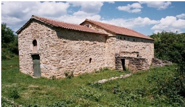
Слика 7. Манастир Св. Никола Топлички

Топлички манастир. - Се наоѓа на просторот помеѓу селата Бабино, Жван и Слоештица во месноста „Топлица“. Манастирот се наоѓа во атарот на село Бабино. Храмот на Топличкиот манастир е сложена архитектонска целина составена од главна црква или наос (машка црква), нартекс (женска црква) на западната страна и северен параклис 19 Доградениот дел од јужната страна е во урнатини. Конаците на манастирот, исто така, се урнати. Според написот на западниот ѕид на влезот, црквата е живописана во 1537 година. Црквата е еднокорабна градба, зајакната до внатре со два пиластри на северниот и на јужниот ѕид и покриена со полукружен свод. Има тристрана апсида внатре со две ниши од северната и јужната страна. Црквата е сидана со кршен камен. Надвор и отворите се од обработен бигор. Најпрво црквата била покриена со камени плочи, но подоцна, кон првата половина на XX век препокриена со ќерамиди. Сидането е извршено со кршен камен во варов малтер. Има влез од надворешна страна на западниот ѕид и директна врска со наосот преку отвор на јужниот ѕид. Подот е од камени плочи. Фреско-живописот во црквата е целосно сочуван.