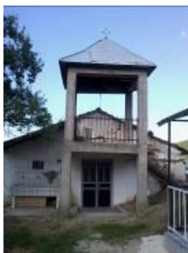
Слика 144. Црквата Св. Атанас