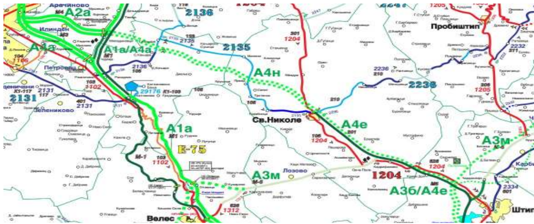
Карта 1. Приказ на новиот афтопат Миладиновци – Штип и експресниот пат Велес-Кадриџаково