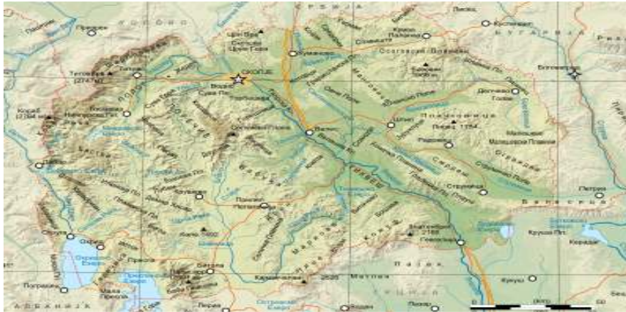
Карта 3. Приказ на планините во РС. Македонија