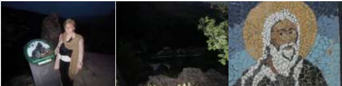
Слика 3. Илин камен, Црквата Св. Илија и мозаик на ликот насликан на црквата.

За таков пример сведочи легендата во с. Звегор за “Илин камен” тоа е карпест блок висок 2 метри, до кој се искачува пешки, при што си во контакт со зелена шума, шумски плодови и панорамски поглед од Илин камен кон манастирот Св Илија и планинската убавина во опкружување. Според верувањата во времето на Османлиското владеење, убавата Илина посакала да се скамени да не ја грабнат турците ова ја потврдува силната вера на Илина како христијанка за тоа време. Поради верувањето во моќта на каменот низ отворот во карпата се протнуваат многу неротки наоѓајќи го решението за својот проблем, а каменот е даруван со крпа, маица, цвеќе и друго.