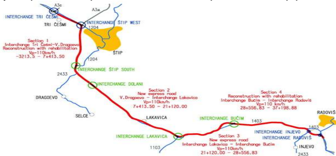
Карта 2. Приказ на новиот експресен пат Штип-Радовиш