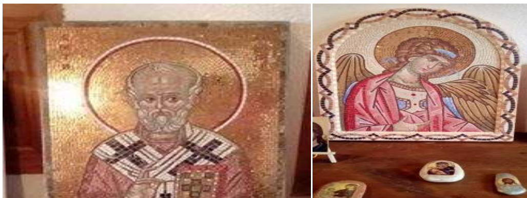
Слика 5. Икони изработени со природен камен и бои на мозаици на монахињите во Манастирот ” Свети Архангел Михаил “- Берово

Чоколаден локум го изработува Отец Фоти во манастирот “Успение на Пресвета Богородица” – Берово, една кутија за туристите се продава за 160 денари, природен и органски локум на отецот од Берово.