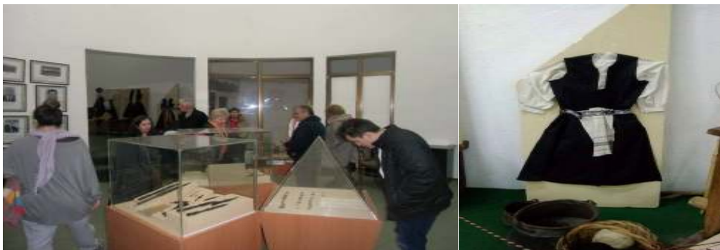
Слика 4. “Домот на културата во Делчево”, изложена народна носија од овој крај.

Природата на туристичкото сообраќајно искуство вклучува движење од една до друга локација, вклучувајќи го степенот на задоволство од посетата на различни манастири и вредности на изработки, ракотворби на вредните раце на монасите разните мозаици со природен камен и боја како уникатна изработка.