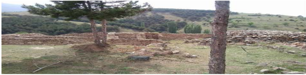
Слика 7. Слика од патниците кои беа на патувањето во Источна македонија