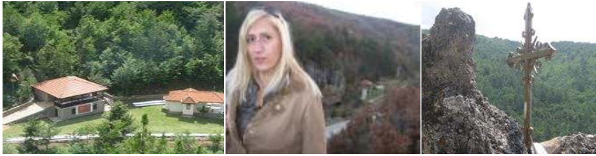
Слика 2. Панорамска гледка од Илин камен и Илин камен означен со крст.

Од ова може да се заклучи дека овој дел на Македонија има голем потенцијал за развој на многу атрактивни спортови и атрактивни видови на туризам како што се рурален, еко туризам, ловен, палаглајдинг, маунт бајкинг, планински и манастирски.