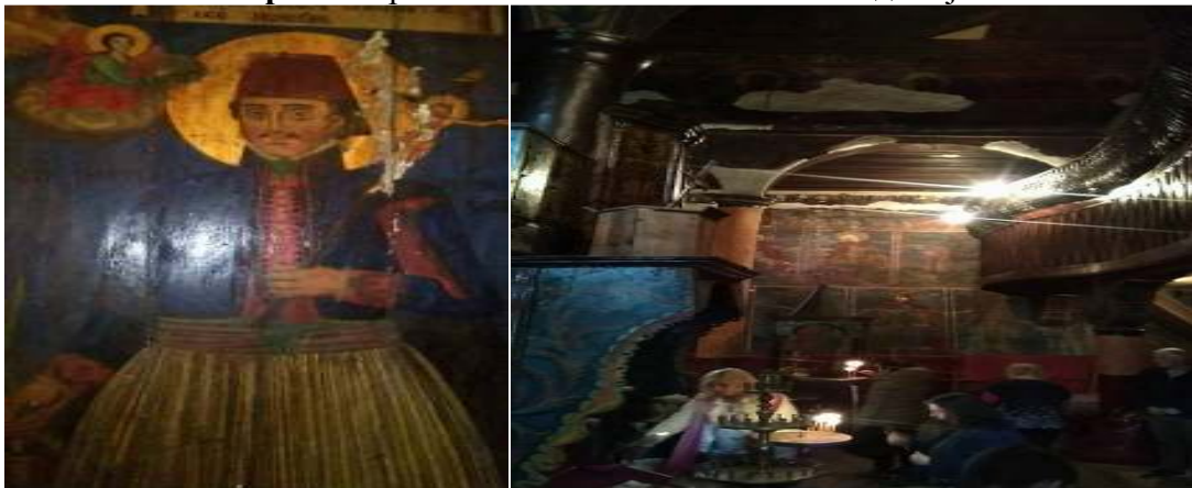
Слика 1. Икона на Свети Ѓорѓи Кратовски која само овде ја има, облечен во турска облека во сукња во црквата Свети Елена и Константин – с. Разловце.

Бања- СПА Кежовица - Штип центар која го исполнува телесното здравје на посетителот рекреативно и за равој на бањскиот туризам.