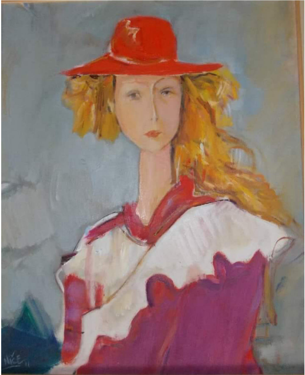
Ниче Василев „Девојка со црвен шешир“ 50x60cm