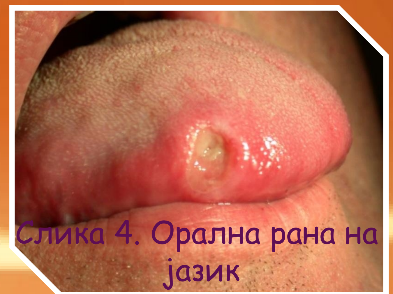
Слика 4. Орална рана на јазик