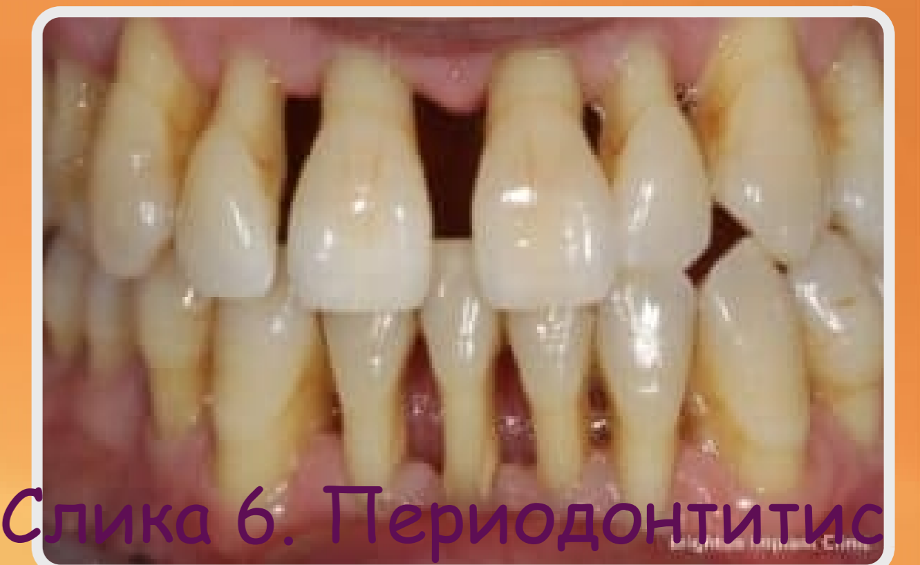
Слика 6. Периодонтитис