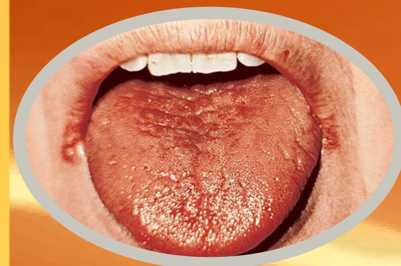
Слика 7. Хипосаливација