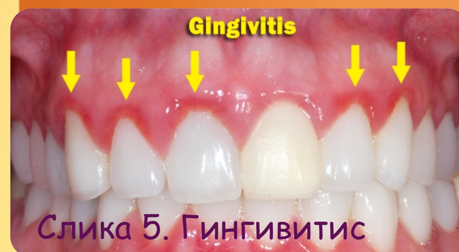
Слика 5. Гингивитис