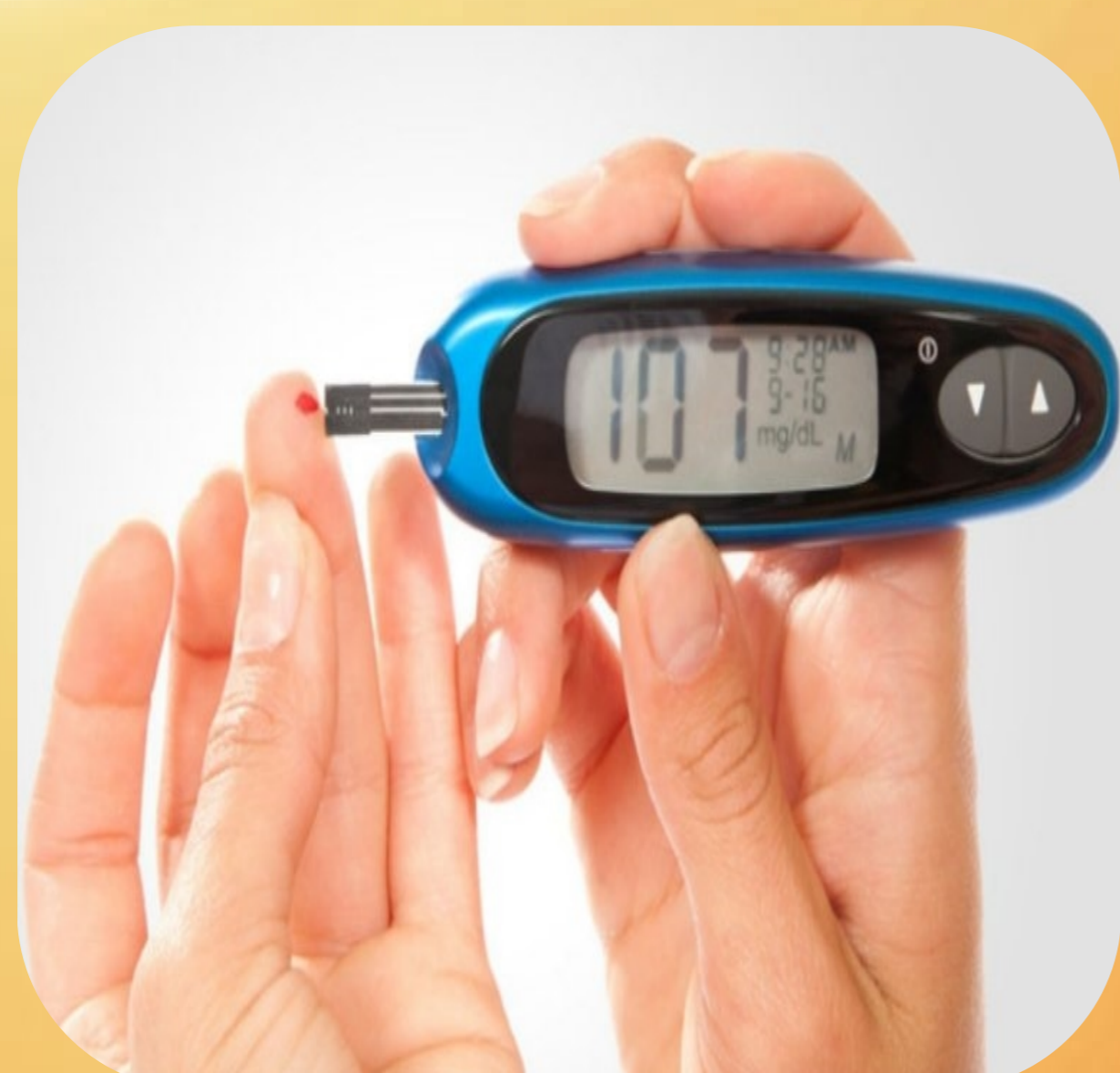
Слика 2. Мерење на инсулин