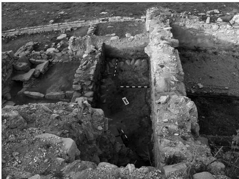
Сл. 6. Деталј од работилница за стакло.