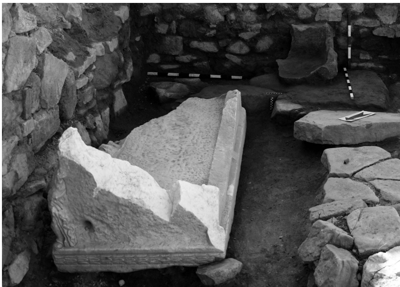
Сл. 1а. Поила за вода.

Североисточниот влез, преку кој градот комуницирал со субурбиумот, 10 е затворен во подоцнежната градежна фаза 11 со преграден ѕид во кој биле вградени сполии од постари градби, бази и основи, со зачуван врежан натпис врз една од нив. 12 Тој водел директно на улицата Виа Декумана, која во овој дел се шири во помал плоштад со широчина до 10 m, која засега е откриена во должина од 15 m. 13 Поплочена е со големи неправилни камени плочи. Јужно од него, непосредно до самата порта, откриено е поило за вода за кое секундарно е употребен саркофаг од бел ситнозрнест мермер со богата и многу квалитетно изработена