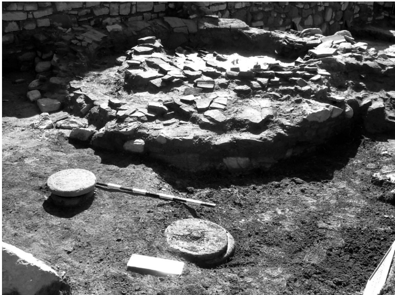
Сл. 2. Печка, прва фаза на истражување.