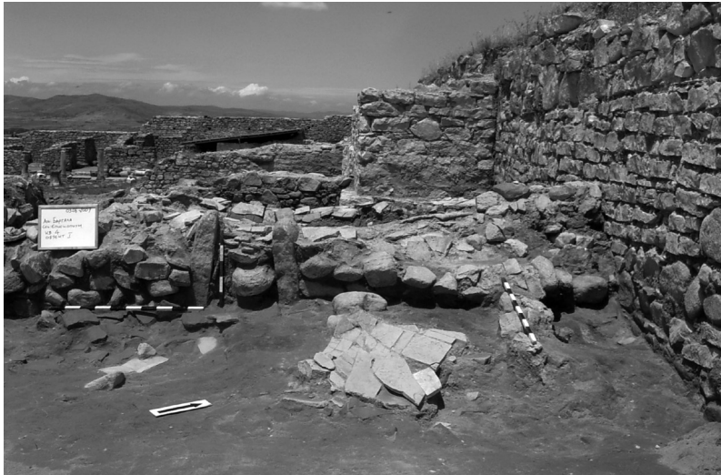
Сл. 4. Работна платформа пред печка.