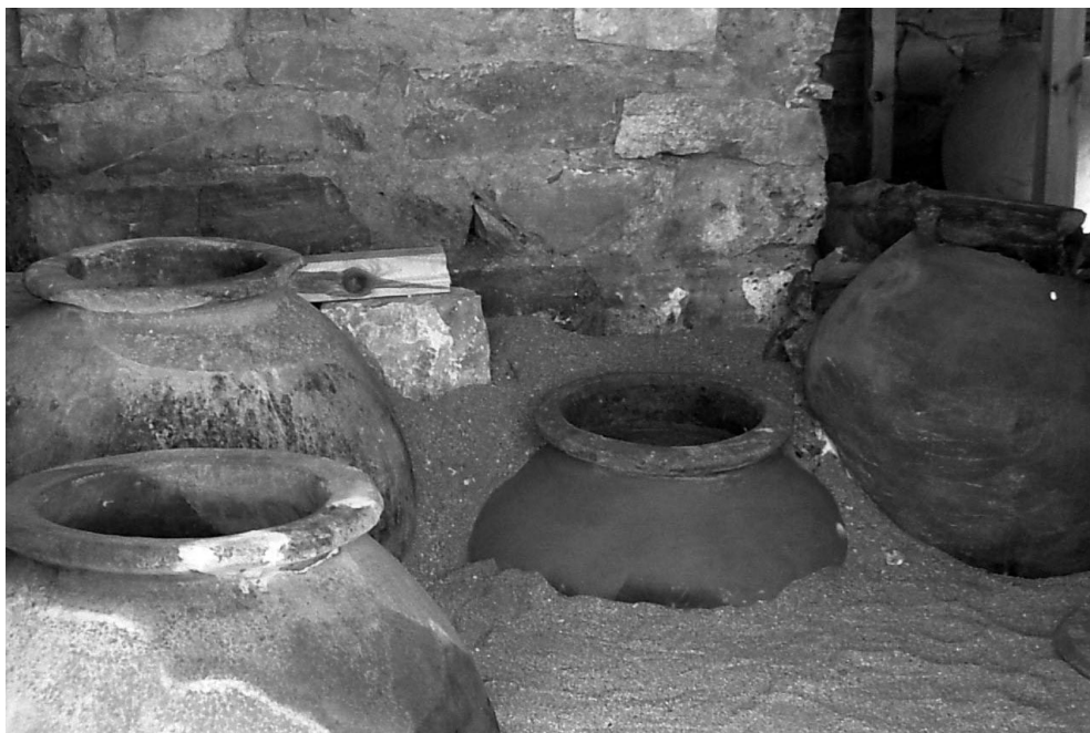
Сл. 8. Деталј од хореум.

неколку влеза, кои подоцна, во средината на VI век биле затворени. Не е потврдено присуство на движен археолошки материјал во текот на истражувачките активности. Нејзината поврзаност со просторијата 1, квадратурата што ја зафаќа и изведениот доводно-одводен систем, како и квалитетно поплочената подна партија, нè наведуваат на помислата дека ова бил просторот кој бил користен при процесот на ферментација на виното. 29