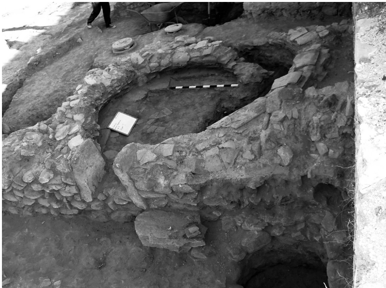
Сл. 4а. Печка со отпадна јама.

надворешен ѕид, премачкан со малтер, видливи се декорации изведени во свеж малтер со мотиви на риба. 22 Со оглед на основниот ѕидарски слог, тој најверојатно ѝ припаѓа на постарата градежна фаза. Сидан е од камен со квалитетен малтер како врзивно средство, а врз него е видлива подоцнежна интервенција во делот на влезната партија (сл. 5), како и надсидување во различен ѕидарски слог во техника на сувосид. Влезот со широчина од 1 m преку кој се влегувало во просторија поплочена со неправилни камени плочи дополнително е засидан. Од неа се влегува во простор со димензии од 1,70 x 1,20 m, кој се поврзува со соседната просторија со димензии 3 x 3,4 m, сместен меѓу двете изѕидани камени платформи за зацврстување на одбранбениот ѕид П3 и П4. Подното ниво на последната спомената просторија е поплочено со керамички подни тули со нееднаква димензија, секундарно употребени, со исклучок на еден мал дел во продолжение на П3 кој не е поплочен