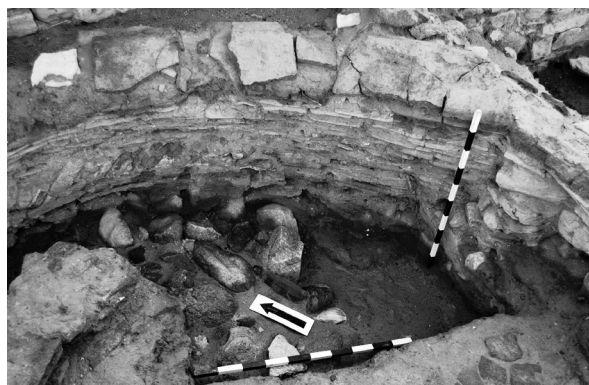
Сл. 3а. Печка, изглед внатре, детаљ.

се отвори до длабочина од 0,60 m во однос на просторијата која целата беше исполнета со пепел (сл. 4а).