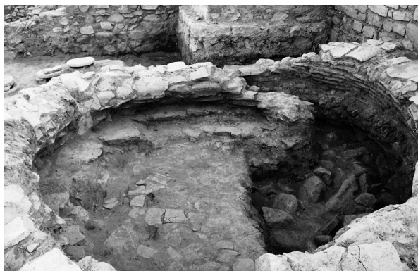
Сл. 3. Внатрешен изглед на печка.