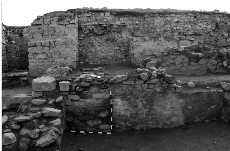
Сл. 5. Објект 2 преградена влез-на партија и надсидување во втора фаза.