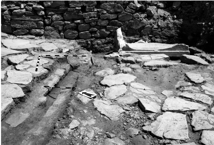
Сл.1. Детал од улица со дел од водоводна инфраструктура.