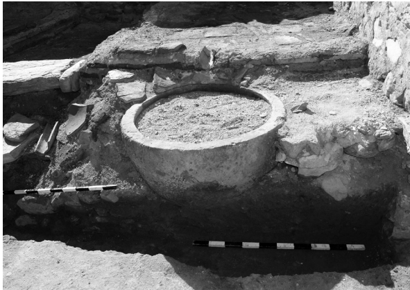
Сл. 7а. Сад таложник.