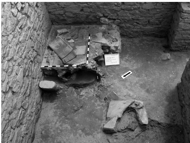
Сл. 6а. Печка за стакло

простор за комуникација, веројатно во функција на када, користена во процесот на изработката на стаклените предмети. Откриените елементи во текот на истражувањето укажуваат дека објектот бил опожарен, или намерно разурнат. Во јужниот агол на просторијата 2а видлив е приклучок во централниот градски одводен систем (план 1).