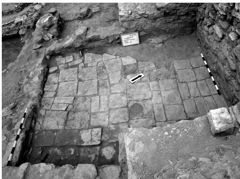
Сл. 5а. Објект 2, детаљ.

(сл. 5а). Намената на овој објект со правилна форма со димензии од 7,5 x 5 m е сè уште недефинирана.