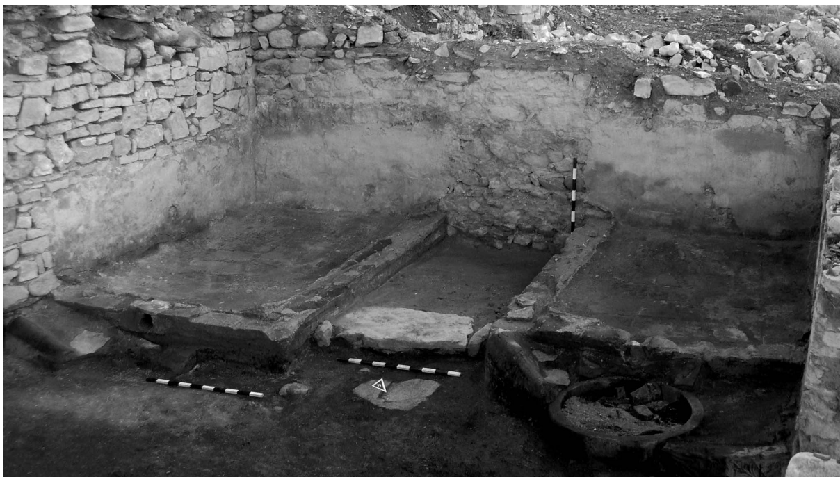
Сл. 7. Винарија - вински преси.

влезни партии преку отворениот трем на западната и затворениот трем на северозападната страна. Објектот е прилепен на обидието од бедемот, чие надворешно лице во овој дел (куртина Е) е премачкано со малтер и декорирано со претстави на риби, 25 веројатно и овде како елемент на ехаристичната симболика која на некој начин била поврзана со првобитната намена на самиот објект. 26 Подните партии кај две од просториите биле поплочени со неправилни камени плочи, а имале и квалитетна инсталирана доводно-одводна мрежа. Просторот, во некоја подоцнежна фаза, веројатно претрпел дополнителни измени и преградувања, кога и служи за потребите на винаријата. Приспособени се три простории со вкупна површина од 152 m 2 . Просториите се наредени една до друга во низа заради процесот на производство (план 1).