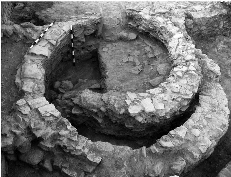
Сл. 2а. Печка, прва фаза на истражување.

фигурална декорација (сл. 1, 1а). Фигуралната претстава е свртена кон одбранбениот ѕид. 14 Југоисточно од поставениот саркофаг, врз камените плочи со кои е поплочена улицата, има уште едно поило од грубо обработен камен кое со многу голема веројатност може да се поврзе со објектите кои функционираше во постарата градежна фаза. И двете камени поила сосема се вклопуваат во градската инфраструктурна мрежа за доводно-одводниот систем. 15