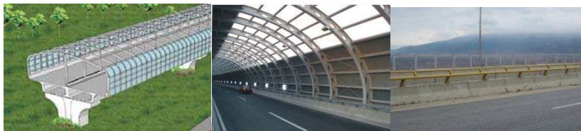
Слика 8 Видови звучни галерии и транспарентна бариера поставена од двете страни

решение за заштита од преголемата бучава. За овој дел се препорачуваат две можни решенија. Едното е да токму на овој дел, каде постои мост со конвенционална ограда од бетонски елементи и челични цевки, да се изведе звучна галерија која ќе овозможи да се намали нивото на бучава на дозволеното ниво од двете страни на автопатот (Слика 8). Во голем број градови од Европа и светот постојат вакви решенија.