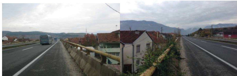
Лева лента Тетово-Скопје Десна лента Скопје Тетово Слика 7. Поглед на двете ленти од автопатот на првата делница

Анализираната делница на овој дел од автопатот е една од најкарактеристичните делови на целиот автопат. Можеме слободно да кажеме дека овој дел припаѓа во класифицираните делови за урбана и рурална средина. Ова тврдење се заснова на фактот дека во непосредна близина на автопатот некаде и од двете страни се наоѓаат индивидуални куќи блиску до патот (Слика 7). Нивната висина не е рамна на оние згради во урбаната средина, но сепак, иако се со еден, два или три ката, нивото на бучавата е секојдневно присутно во целодневниот нивен живот, што се гледа од високата фреквенција на возила, лесни и тешки, преку целата година, дење и ноќе.