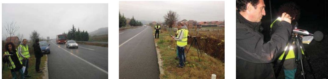
Слика 4. Дневно и ноќно контролно мерење на првата избрана делница

На слика 4 е прикажано практичното мерење со инструментите при дневно и ноќно мерење на едно од избраните мерни места.