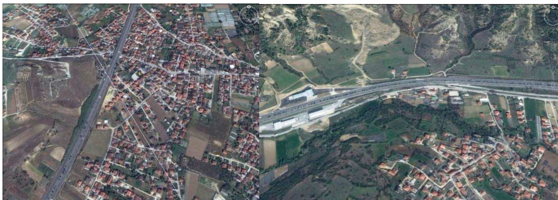
Слика 2. Микролокација на двете делници со мерните места

Микролокациите на двете избрани делници со мерните места се прикажани на Слика 2.