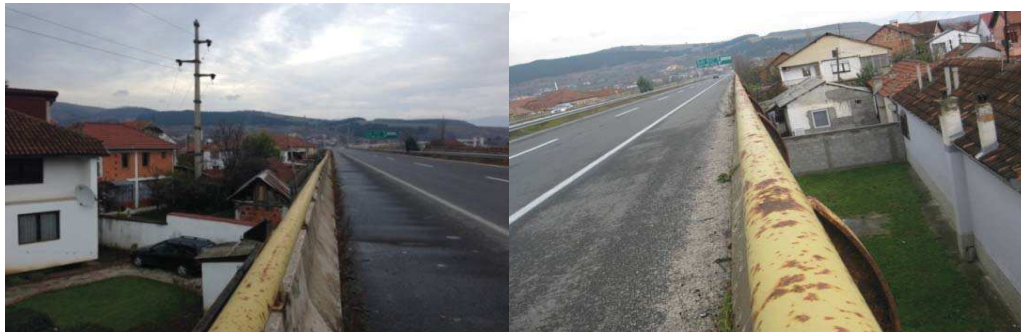
Слика 3. Поглед на локацијата на автопатот со изградените објекти до самиот мост

Од двете страни во близина на автопатот се изградени индивидуални куќи кои во локацијата на мостот и насипот, се речиси залепени за него. Во продолжение на автопатот кон Тетово постојат повеќе објекти (најмногу индивидуални куќи) на десната и левата страна на која се извршени и контролните мерења (Слика 3). Патот на оваа делница е во правец сè до неговото разделување за влезот во Општина Горче Петров (Скопје Запад) и обиколницата, каде има благо закривување.