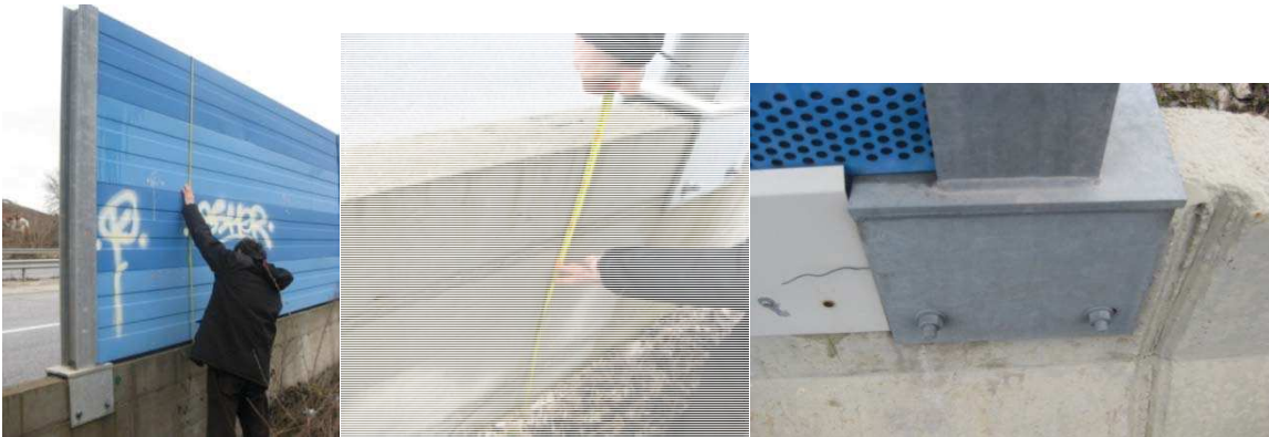
Слика 10. Звучната бариера на влезот во Ѓорче Петров со карактеристични детали