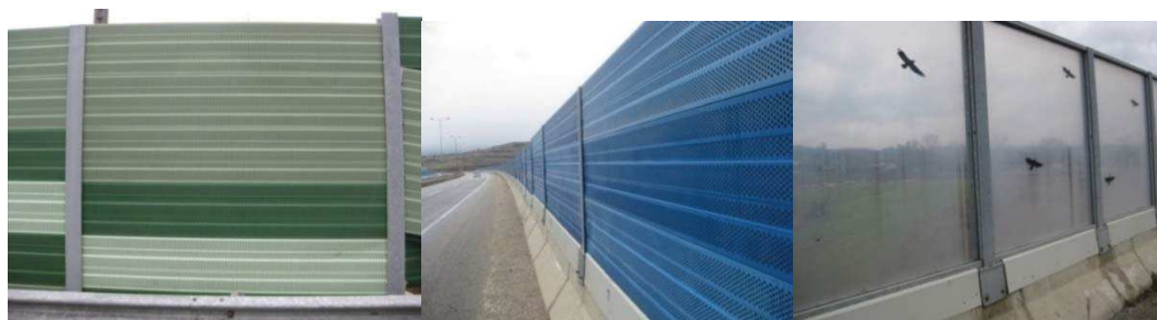
Слика 8. Апсорбтивни и транспарентни бариери изведени на обиколницата Тетово-Скопје

Овој тип на звучни бариери се одликува со висок коефициент на впивање до 0,85% и може да ја намали бучавата и до 36dB(A). Предложените мерки за заштита од бучавата секако дека ќе го намалат нивото на бучава под дозволеното, но изборот треба да се направи според можностите и да се избере оптималното решение.