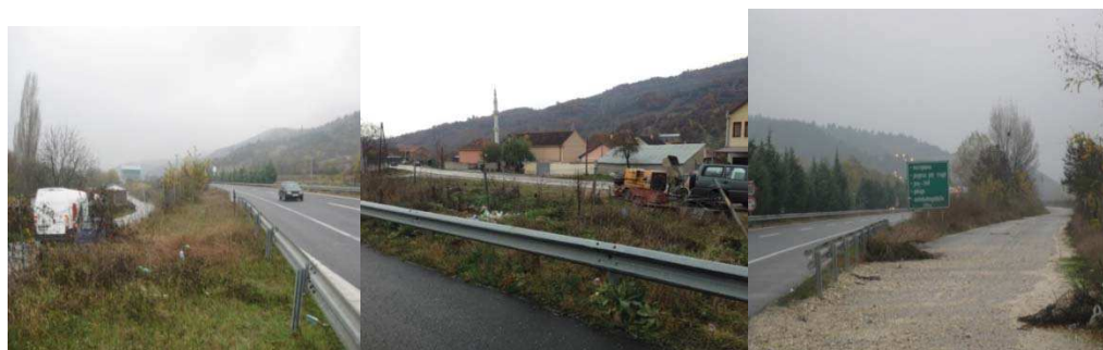
Слика 5. Поглед на локацијата на автопатот и неговата околина на втората делница

Избраната делница за анализа е делницата од автопатот A 2 (E65) Скопје-Тетово на км 4+499,41 во атарот на селото Долна Арнакија каде постои населба која се наоѓа на левата страна од автопатот и е во непосредна близина на коловозот. На овој дел од автопатот постои и наплатна рампа (Слика 5).