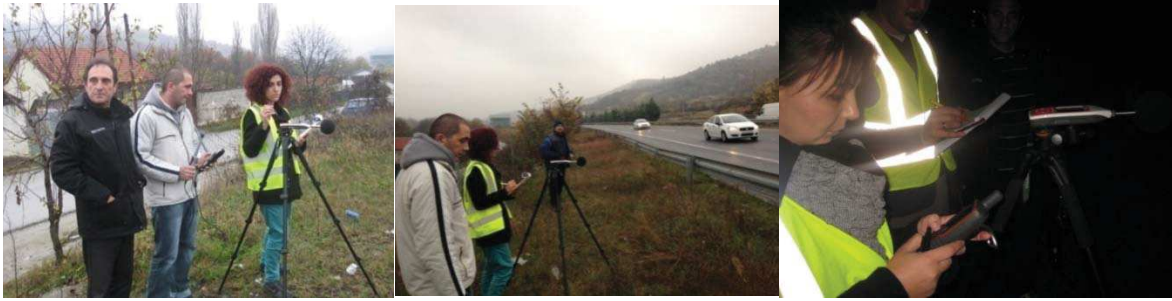
Слика 6. Дневно и ноќно мерење на бучавата за втората делница од автопатот Скопје-Тетово

делници, се исти како и за првата делница. На Слика 6 се прикажани мерењата со пакетот инструменти, дадени погоре, во функција на дневно и ноќно мерење во избраните контролни мерни места.