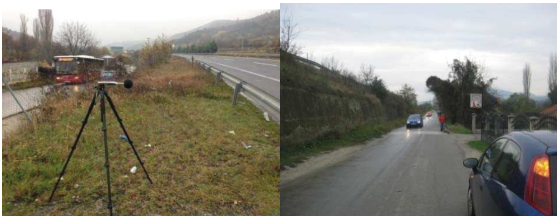
Слика 9 Поглед на локацијата од втората делница

Оваа делница истотака има свои специфики во однос на локацијата, каде освен автопатот, блиску до него минува и регионалниот пат, а некаде ги дели бетонски потпорен ѕид (Слика 9).