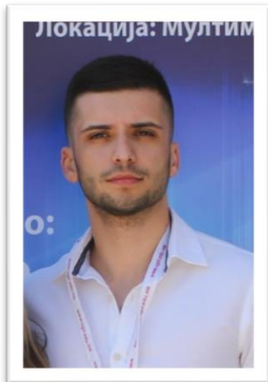
Генерален секретар: Александар Лонгуров