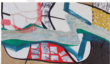
Пространство ( Space )