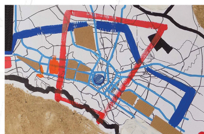
Урбанизам ( Urbanism )