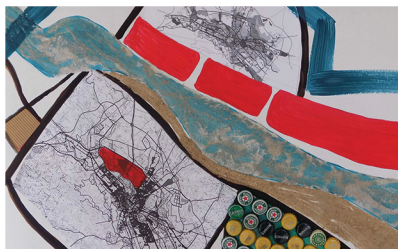
Зона ( Zone )