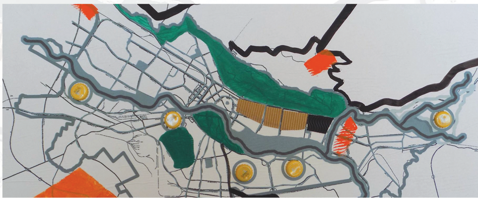
Линеарен развој ( Linear development )