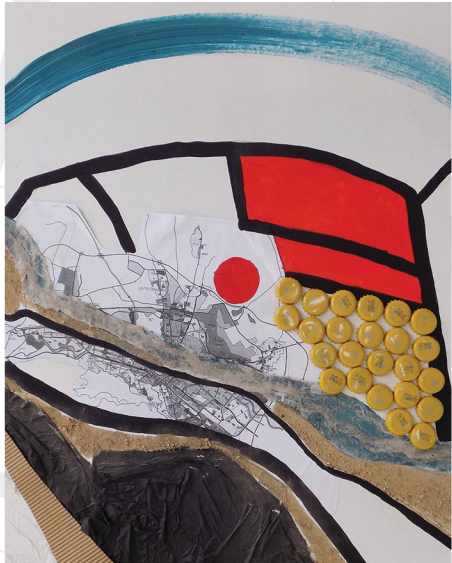
Градско јадро ( City core )