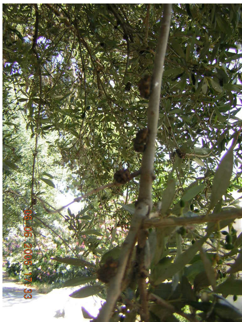
Рак рани ( Pseudomonas savastanoi )