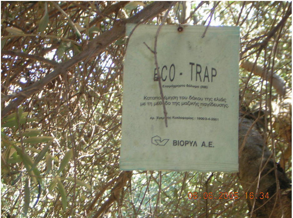
Предна страна на мамка тип „Привлечи и уби” со феромон за контрола на маслиновата мушичка