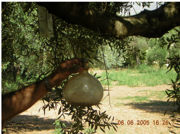
McPhail стаклена мамка за ловење маслинова мушичка