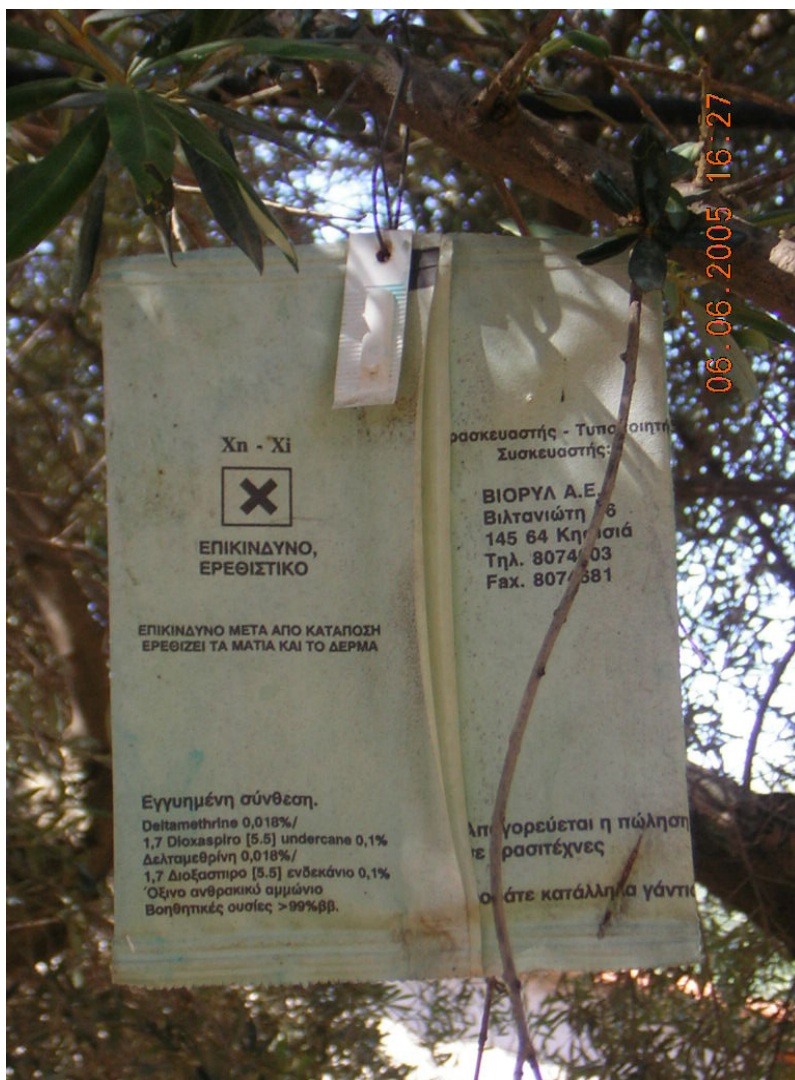
Задна страна на мамка тип „Привлечи и уби” со феромон за контрола на маслиновата мушичка