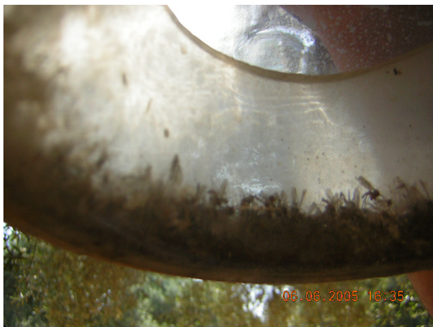
McPhail стаклена мамка со уловени маслинови мушички